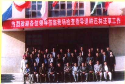
全州退耕还林(草)现场观摩会代表合影