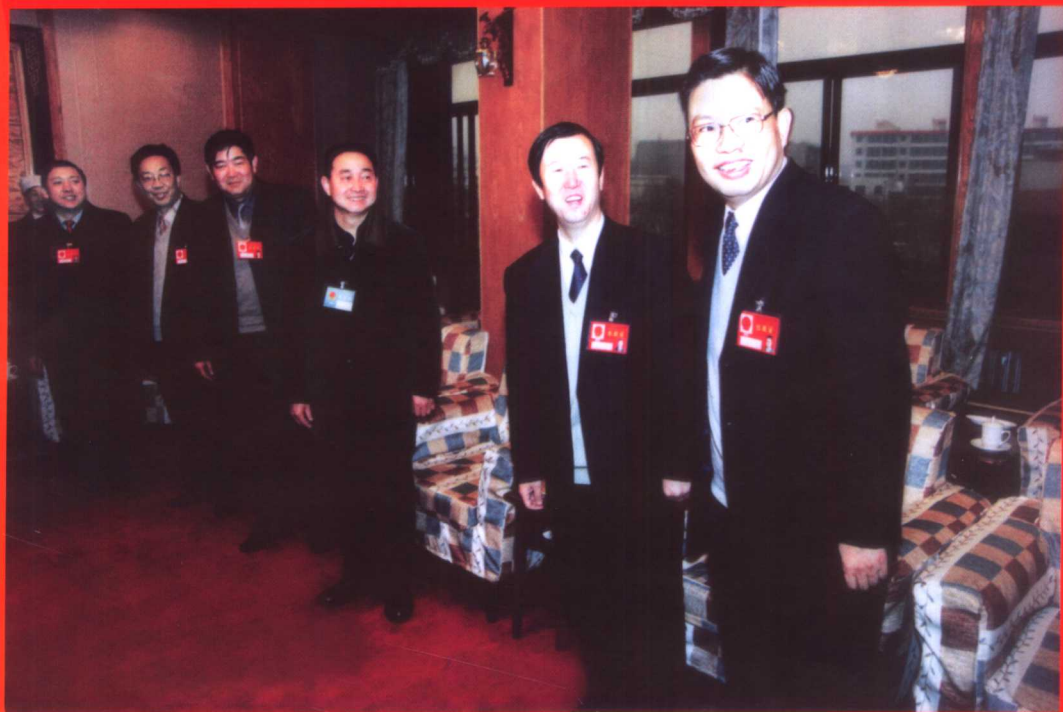
2002年1月18日，青海省委副书记、省长赵乐际看望海北州出席省九届人大五次会议的代表