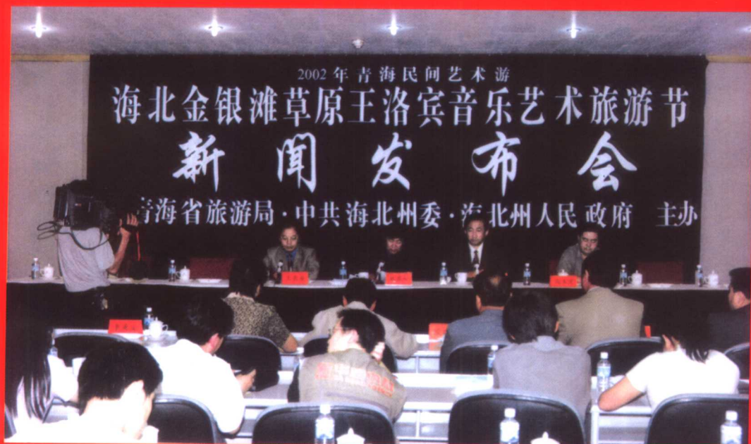
2002年青海民间艺术游——海北金银滩草原王洛宾音乐艺术旅游节新闻发布会于2002年6月27日在青海会议中心举行