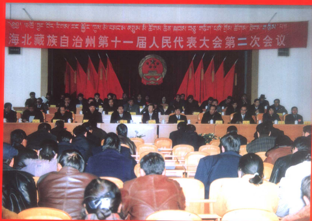
2002年1月28日至2月1日，海北藏族自治州第十一届人民代表大会第二次会议在西海镇召开