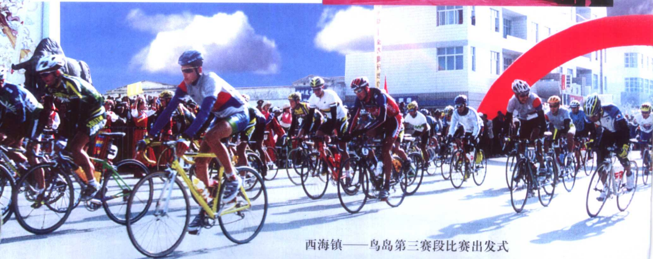
西海镇——鸟岛第三赛段比赛出发式