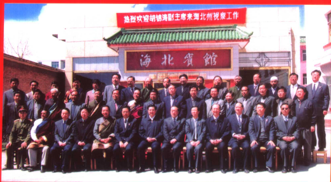
2002年5月23日，中共中央政治局常委、国家副主席胡锦涛与省、州、县领导合影