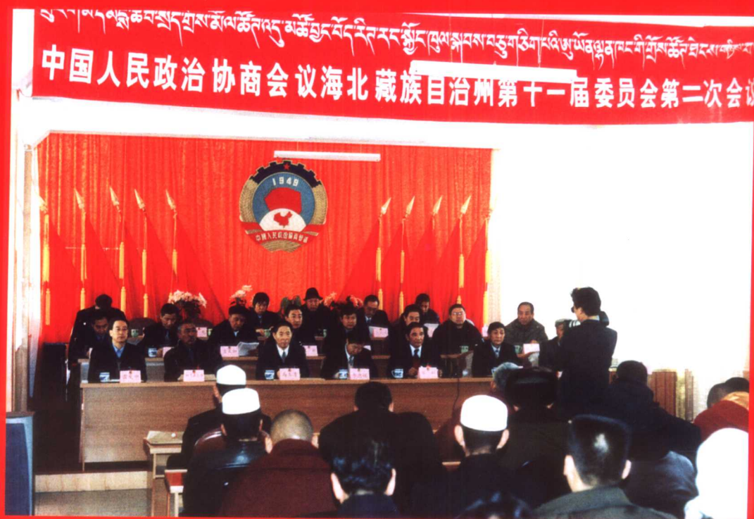
2002年1月27日至31日，中国人民政治协商会议海北藏族自治州第十届委员会第二次会议在西海镇召开