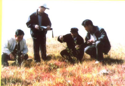
2002年10月,青海湖农场的11.8万亩退耕地通过国家级验收