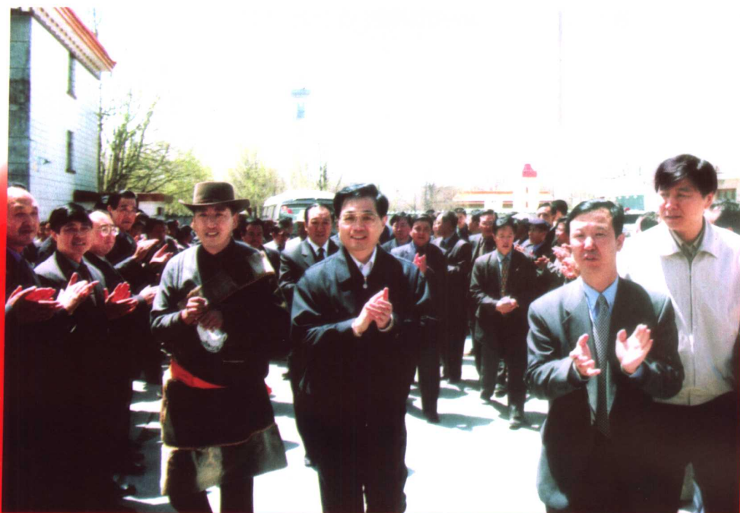
2002年5月23日，中共中央政治局常委、国家副主席胡锦涛来海北州视察工作