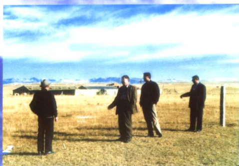
场领导现场察看围栏草场