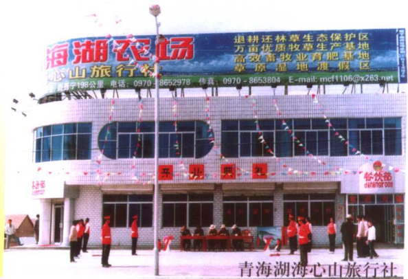
青海湖海心山旅行社

青海湖农场位于海北藏族自治州刚察县境内,南临青海湖,北靠达坂山,东与刚察县哈尔盖乡接壤,西与伊克乌拉乡为邻,东西长40公里,南北宽10公里。全场占地总面积为23.4万亩,耕地面积为21.8万亩,海拔高度为3230米。全场现有总人口3600人,在职职工768人,离退休人员687人,其中管理人员68人,各类专业技术人员及教师88人。场部机关下设两办四科(党政办、项目办、政工、财务、生产、保卫)为农场行政管理机构。设有学校、医院、驻宁办事处3个事业单位,4个农业分场12个农业中队,建筑公司、旅游公司为农场生产经营单位。全场实行三级管理(总场、分场、中队)两极核算(总场、分场)的管理体制。