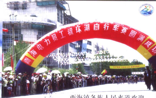
西海镇各族人民夹道欢迎