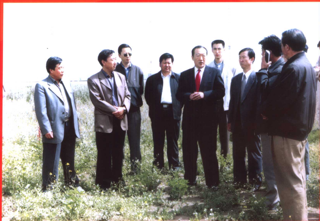
2002年8月6日至8日，青海省委书记苏荣在省委常委、省委秘书长李津成，海北州委书记李忠保，州委副书记、州长旦科的陪同下在海北州进行工作调研