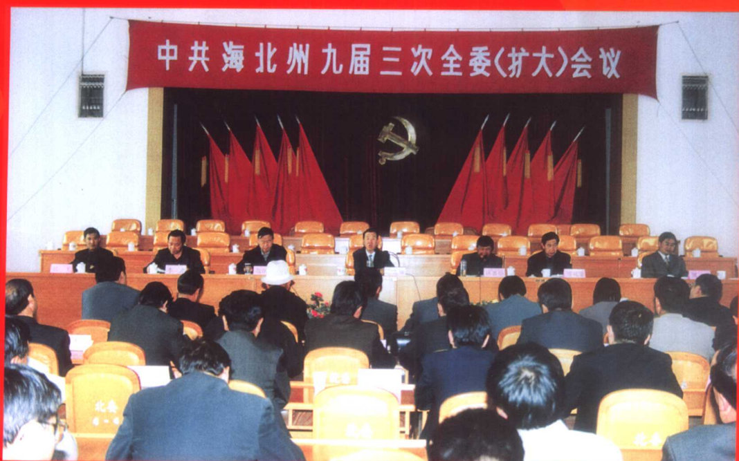
2002年5月28日，中共海北州九届三次全委(扩大)会议在西海镇召开