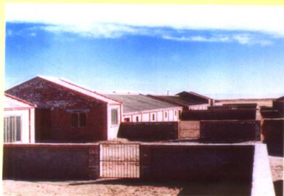
高效畜牧业基地的暖棚羊舍