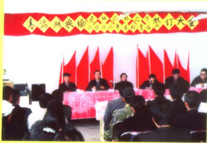
2002年全场退耕还林(草)目标签订大会