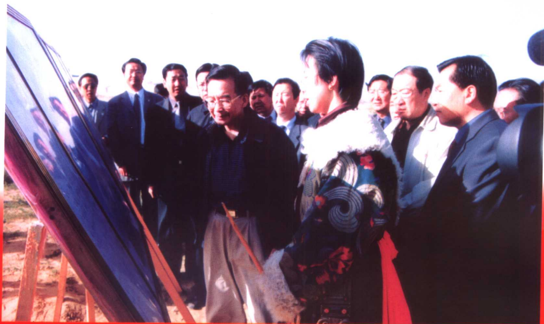
2002年8月28日，中共中央政治局委员、国务院副总理温家宝在海北州海晏县克土治沙点听取有关治沙情况的介绍