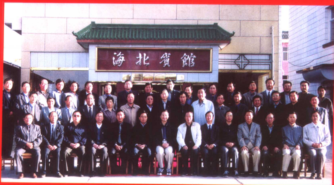
2002年8月29日，中共中央政治局委员、国务院副总理温家宝与省、州、县领导合影