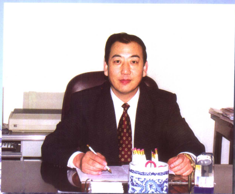
海北藏族自治州人民政府州长 旦科

只争朝夕，与时俱进，才会在发展中闯出新路子，实现新跨越。全州上下都要紧紧围绕经济建设这个中心和加快发展、富民强州这一主题，以更加求实的精神，扎实的作风，着眼长远，立足当前，抓住重点，集中精力，用最有效的措施，进一步把经济结构调优，把经济质量提高，把发展的基础打好。前不久召开的州委九届二次全委会，提出了2002年工作的奋斗目标、总体思路和工作重点，全州上下要以这次会议精神为指导，力争2002年在固定资产投资、农牧业结构调整和推进产业化经营、工业增速提效、发展旅游业、小城镇建设、改善人民群众生活水平上实现新突破、新提高。要认真按照“三个代表”要求，进一步加强和改进党的作风，着力提高各级党组织的创造力、凝聚力和战斗力。正确处理改革、发展、稳定的关系，大力推进以德治州和以法治州进程，为全州经济社会发展创造良好的思想道德环境和民主环境，以优异成绩迎接党的十六大的胜利召开！