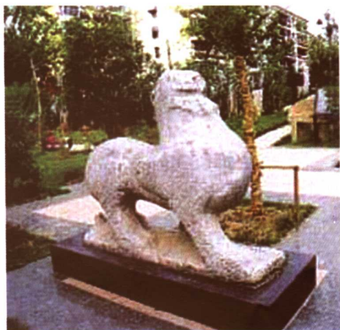
梁昭明太子萧统墓道石刻（辟邪）