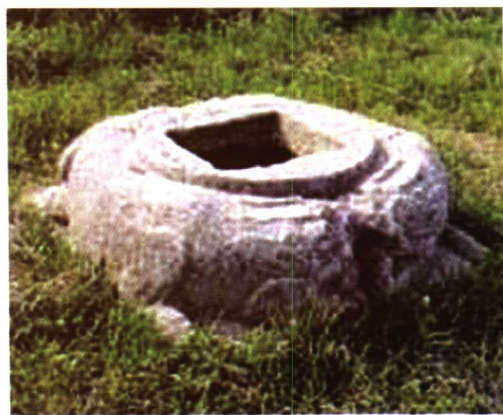
仙林张家库佚名墓道石刻（东石柱座）