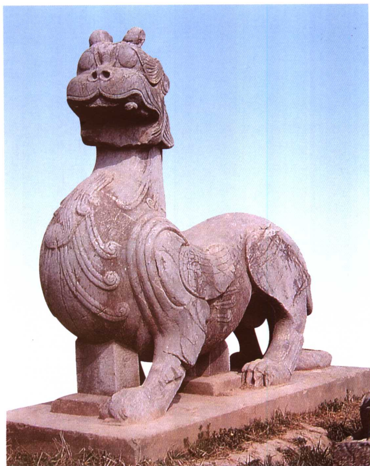
齐武帝萧赜景安陵前石兽