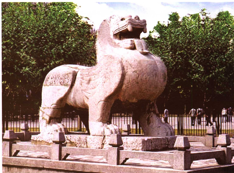
梁桂阳简王萧融墓道石刻（西辟邪）