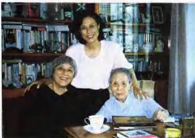
1990年创办“冰心儿童图书奖”。韩素音、冰心、葛翠琳在冰心卧室中合影。