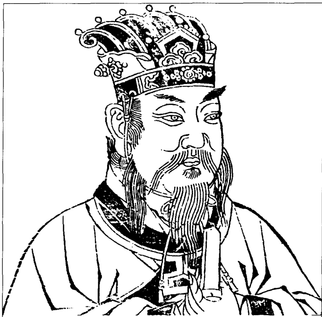
周文王 姓姬名昌,商末时为西伯侯。曾被商纣囚禁羑里,演八卦而成《周易》,列为六经之首。他提倡笃仁、敬老、慈少、礼贤下士,在位时国家强盛。

⑨开门见山,此为第一:开门见山,这里曾国藩把“神”和“骨”喻作两扇大门,把人的命运喻为门外显而易见的大山,认为只要看了人的“神”和“骨”,就等于打开了人的命运之“门”,可以测知人的命运了。此为第一,“此”在这里不是指本篇,而是指“神”和“骨”,“此为第一”意思就是说“神骨”是观人的第一要诀。这两句话