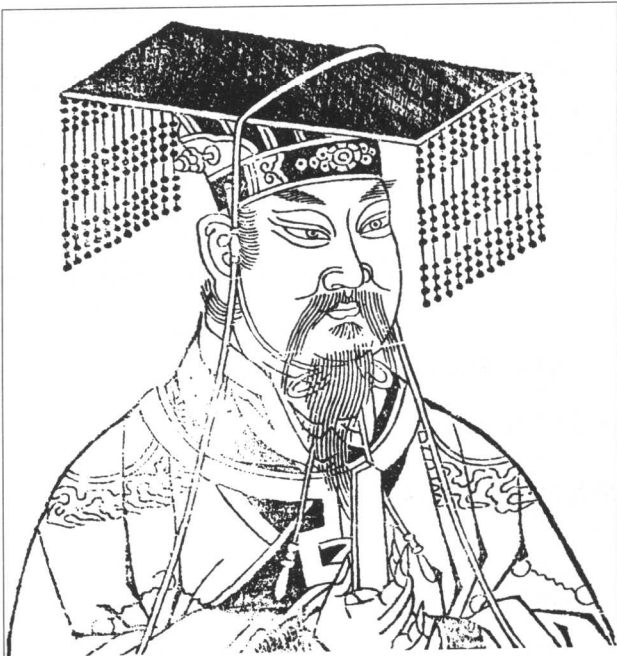
周武王 西周王朝的建立者。姓姬，名发。继承其父文王的遗志，在牧野之战中灭掉残暴的商王朝，建立了西周王朝。

两眼注：“目为心候，故应心而心不倾倚，则视不回邪；志不怯懦，则视不衰悴。”这里也旨在说明内心与眼神的关系。《左传》里有一个故事，说的是周景王派单成公到戚邑去会见韩宣子。单成公目光低垂，言语迟缓。叔向说：“单成公快要死了吧？大臣上朝都有一定的位置，会见诸侯时进退有一定的秩序。上衣的左右襟要在胸前交会，腰带的结