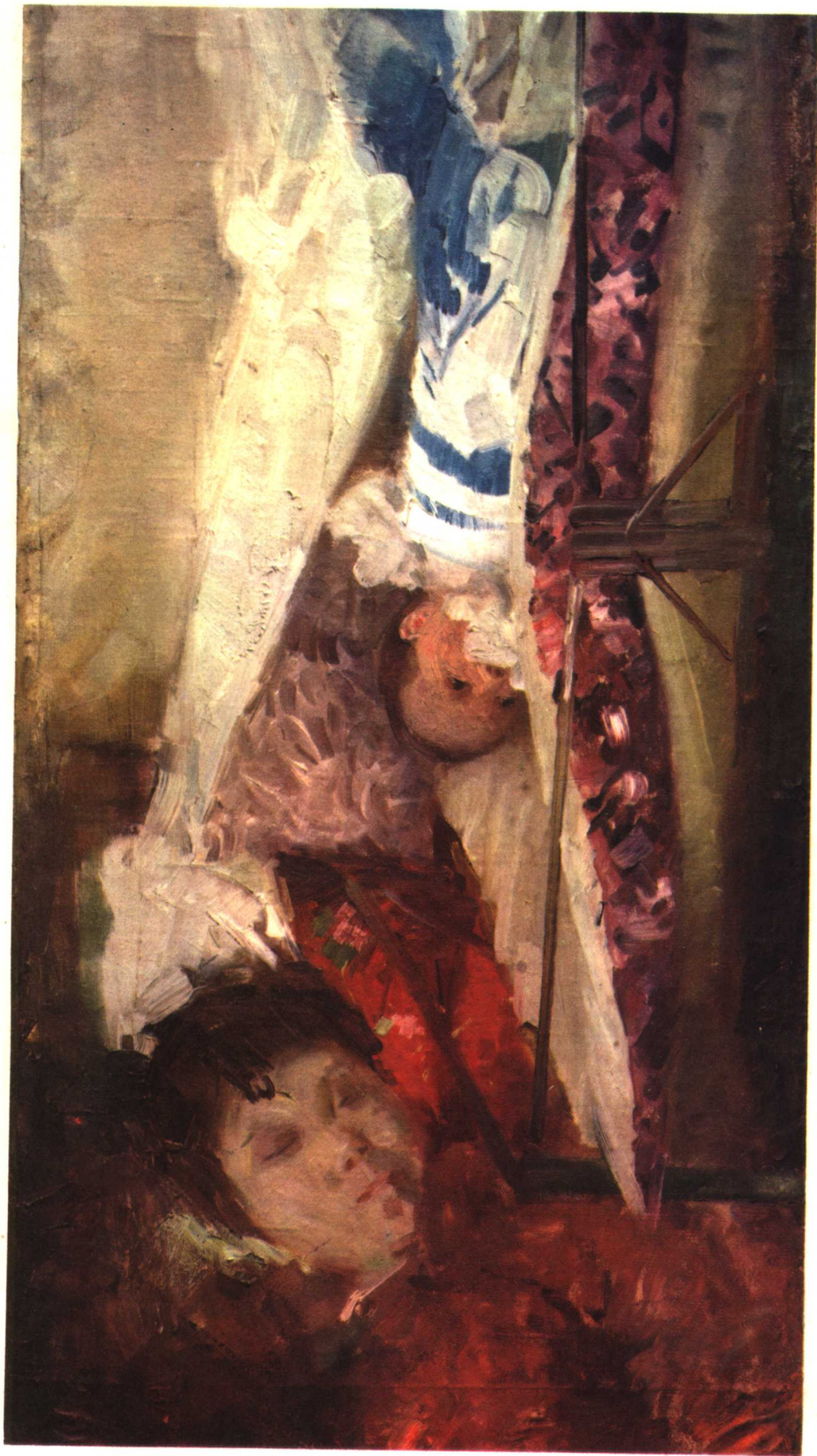
7 新生儿 1960年 48·85厘米