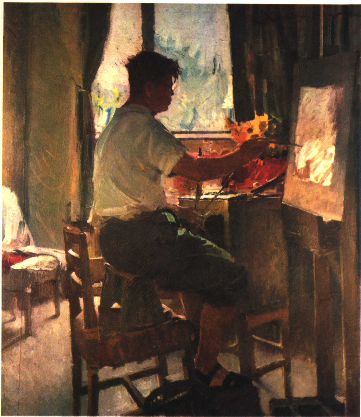
17 孜孜不倦 1973年 120 × 103厘米