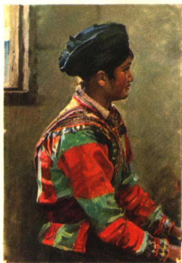
18 大凉山女儿 1974年 75×53厘米 (全图和部分)