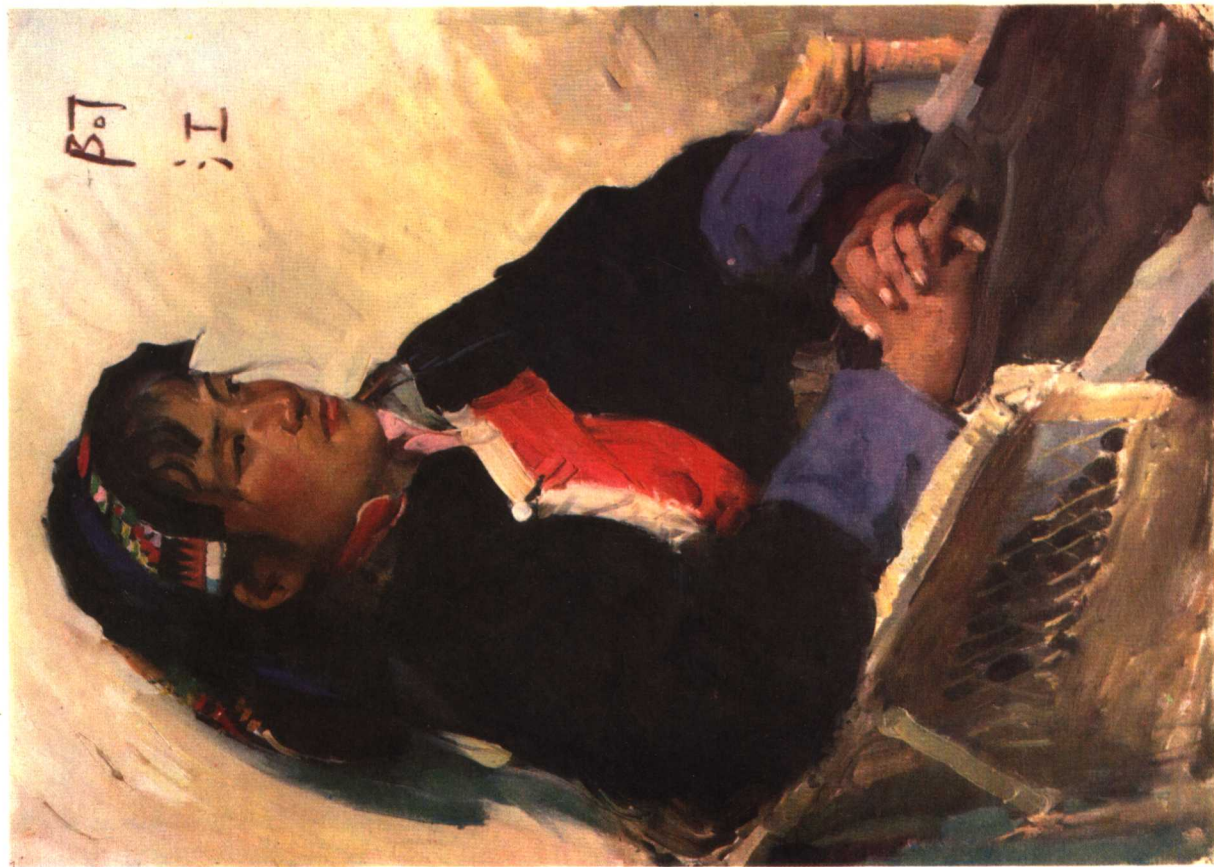
12 马尔康的女护士 1974年 76×53厘米