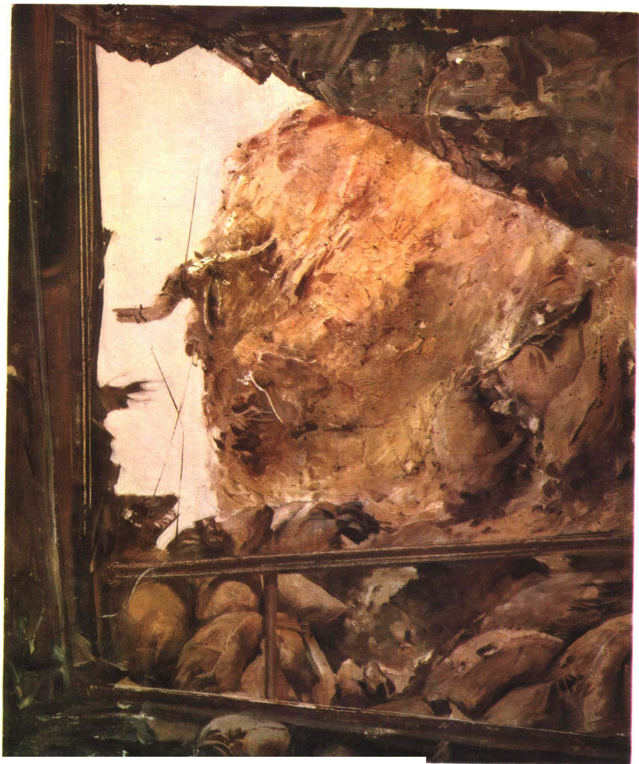
上 甘 岭 537.7高地残存工事 1956年于朝鲜 48×56.5厘米