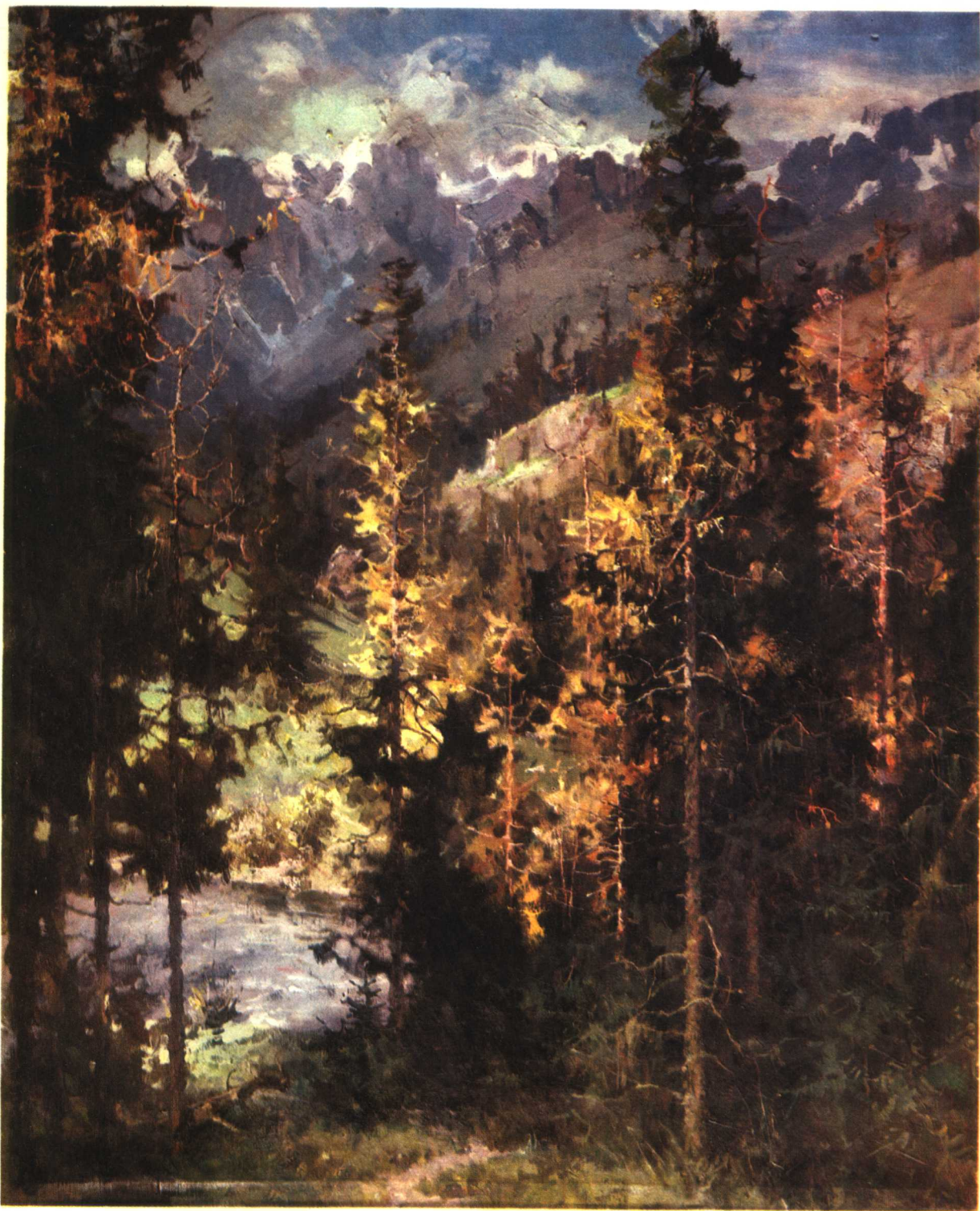
11 梭磨河边 1975年 112×93厘米