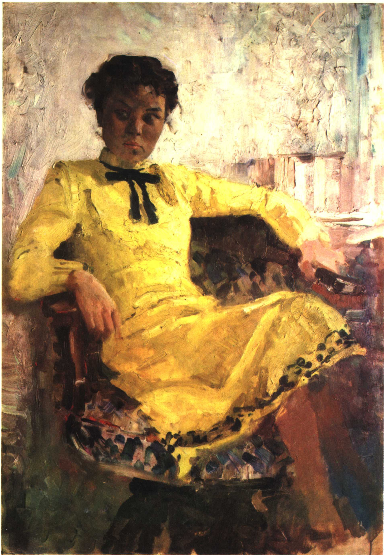
5 习 作 1959年 100 × 77厘米