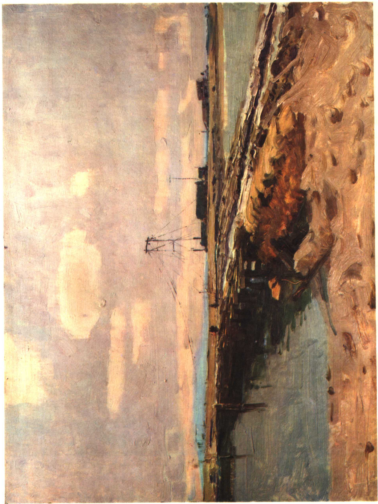
2 鸭绿江边一便桥 1962年 41×53厘米