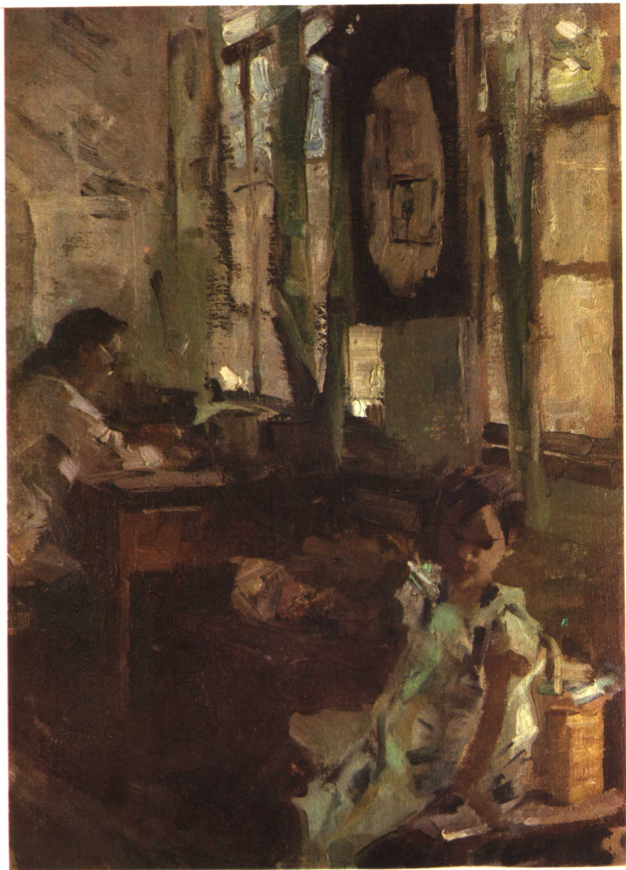
4 速 写 1959年 37.5 × 27.5厘米