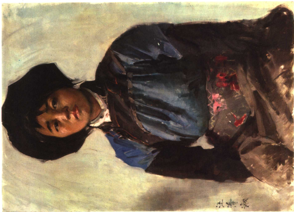
13 四川汶川羌族学生 1974年 76×53厘米