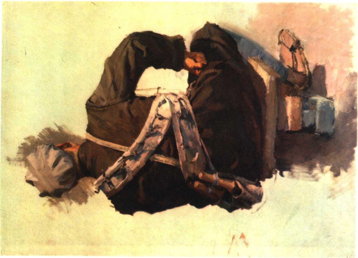
14 《古田会议》习作之一