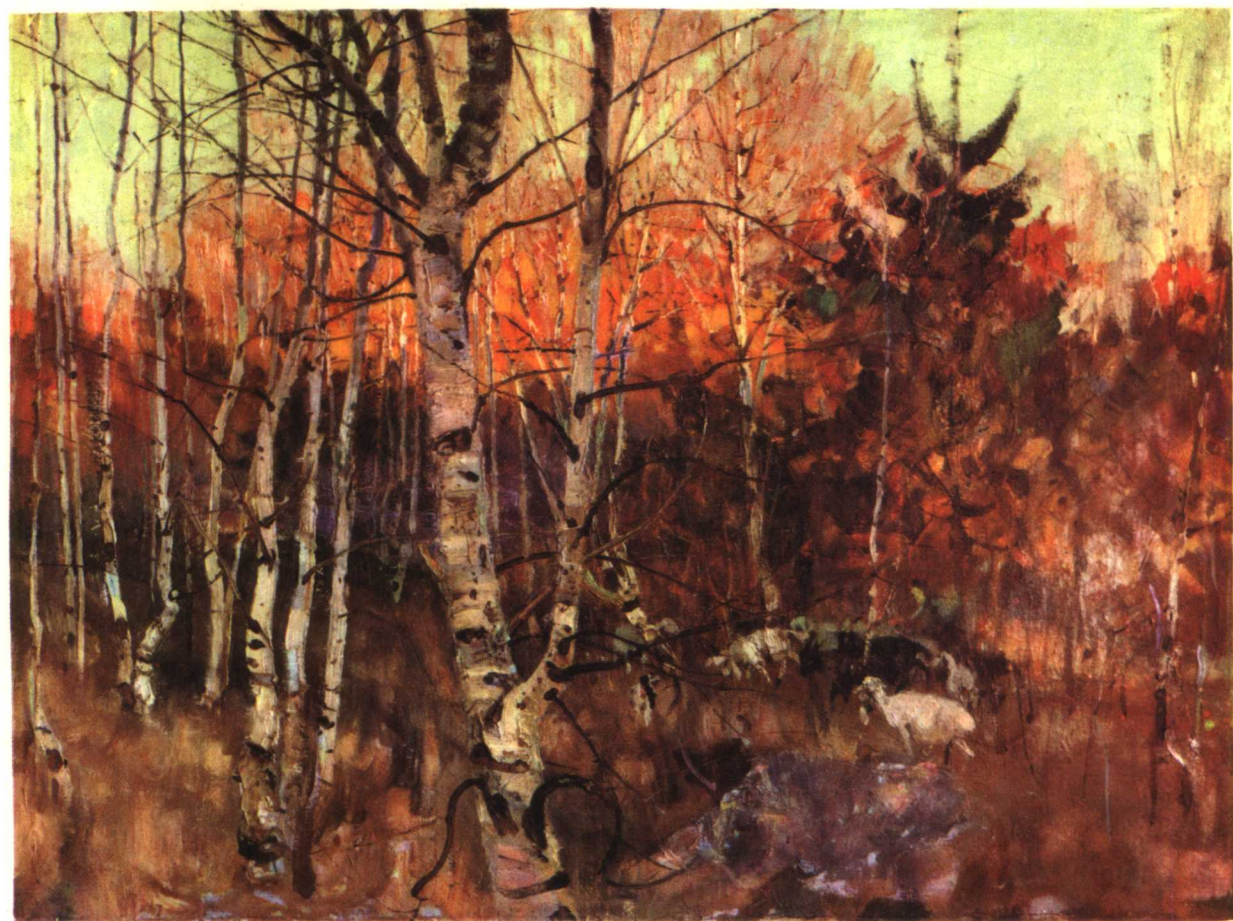
10 秋 1965年于北京 76×105厘米