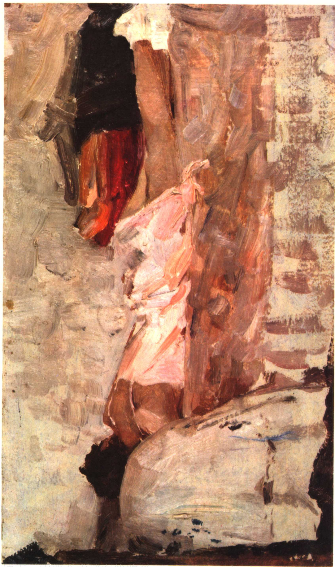
3 午 眠 1958年 18.5 × 31厘米