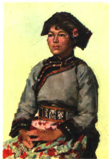
19 汶川县羌族学生 1974年 76×53厘米 (全图和部分)