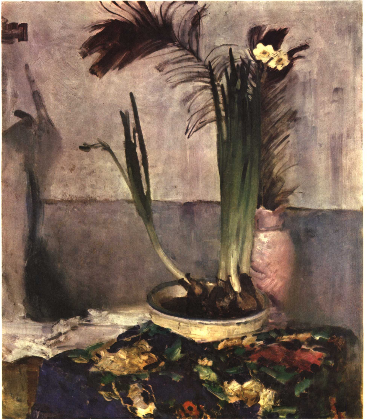
16 水仙 1958年 80×70厘米