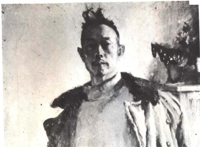
自 画 像