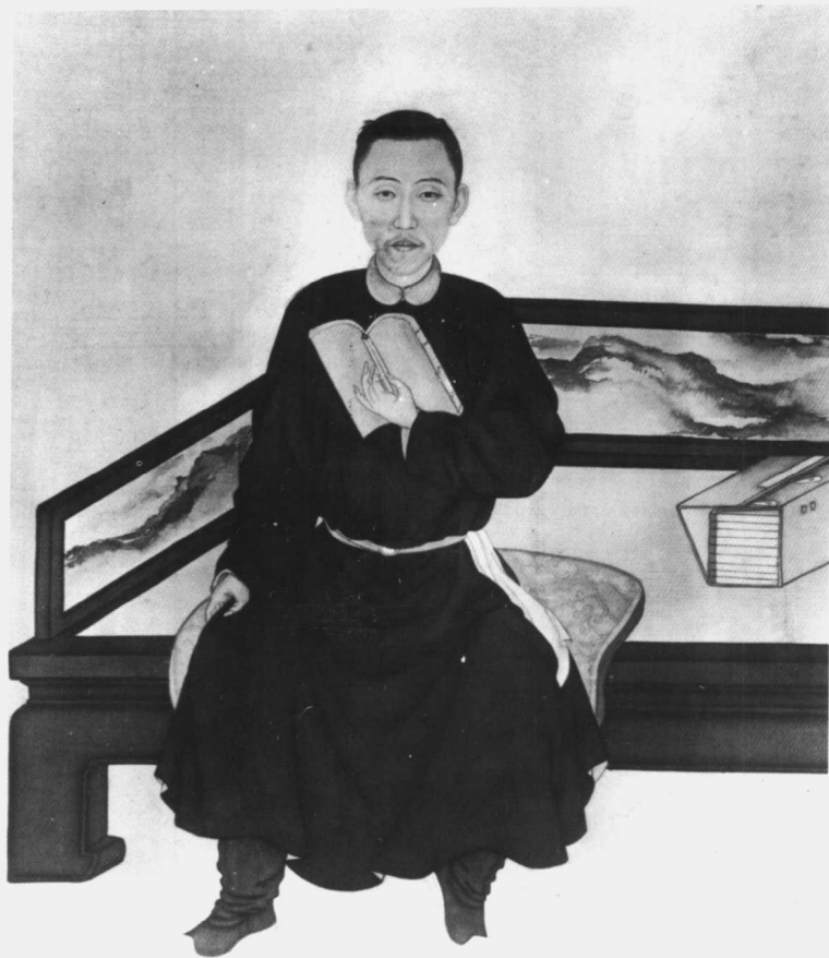
雍正青年时代画像