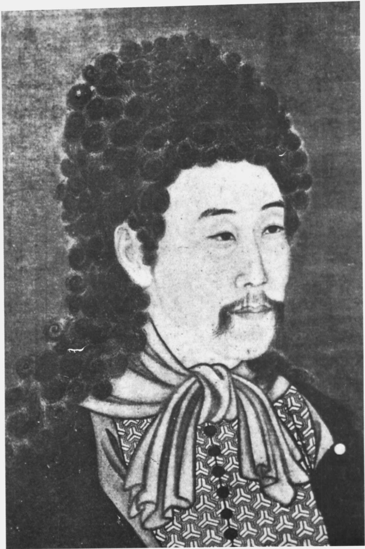
雍正披戴西洋发式画像