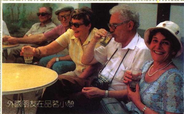
外國朋友在品茗小憩