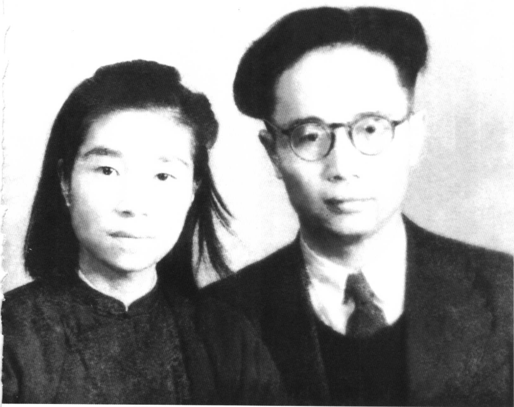
1946年春，何其芳与夫人牟决鸣摄于重庆。