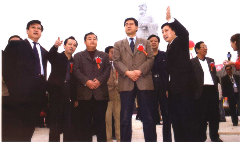
省、市、县三级领导出席荀子塑像揭幕仪式。