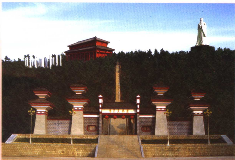
在荀子故里的高山上矗立的二十八米(基座八米)花岗岩荀子造像及巍峨雄壮的山门、大殿、书院碑林。