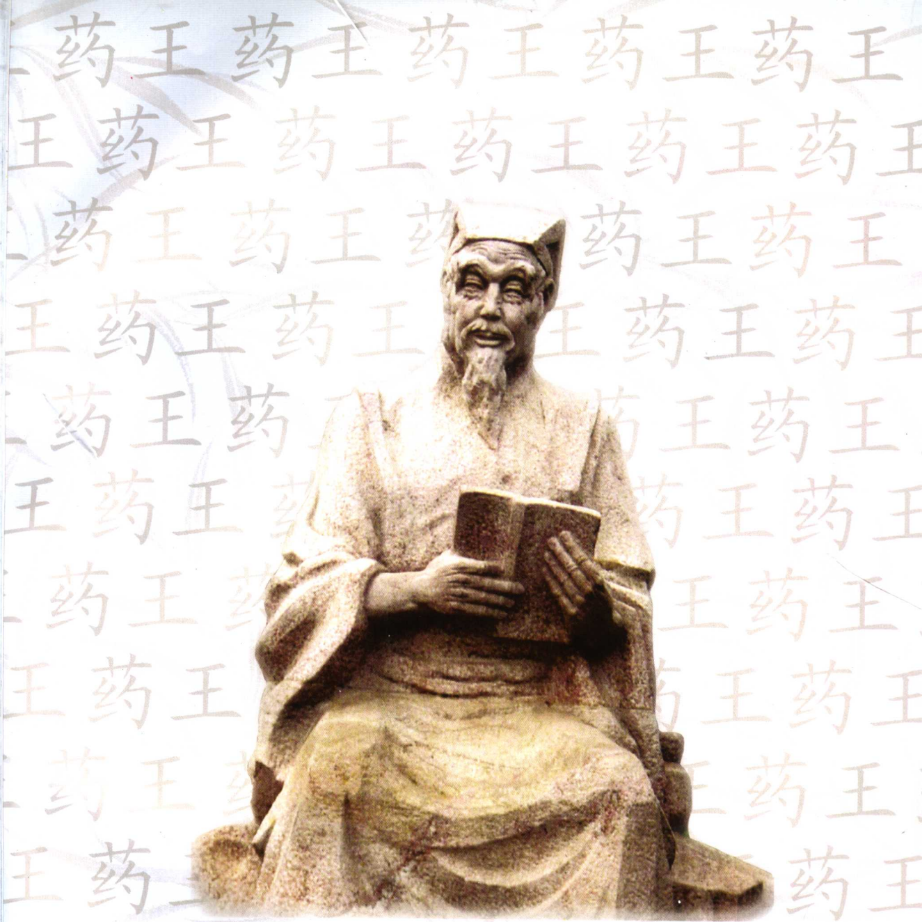
唐代医学家孙思邈