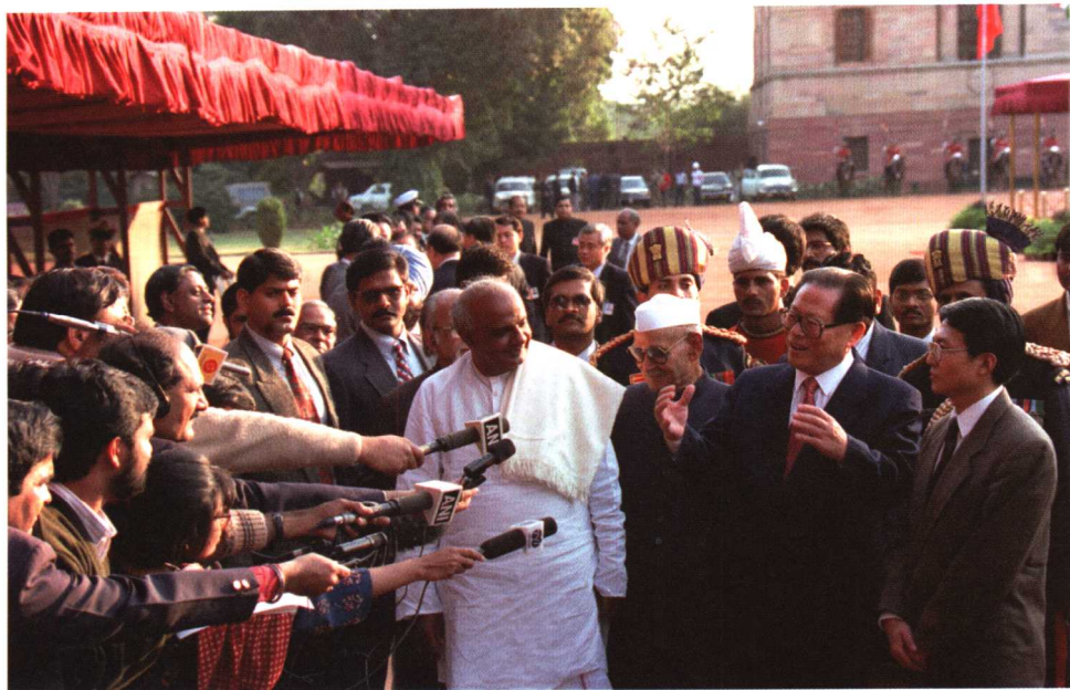
1996年11月28日，中国国家主席江泽民乘专机抵达新德里，在印度总统府同夏尔马总统（右三）、高达总理（右四）一起与记者见面。