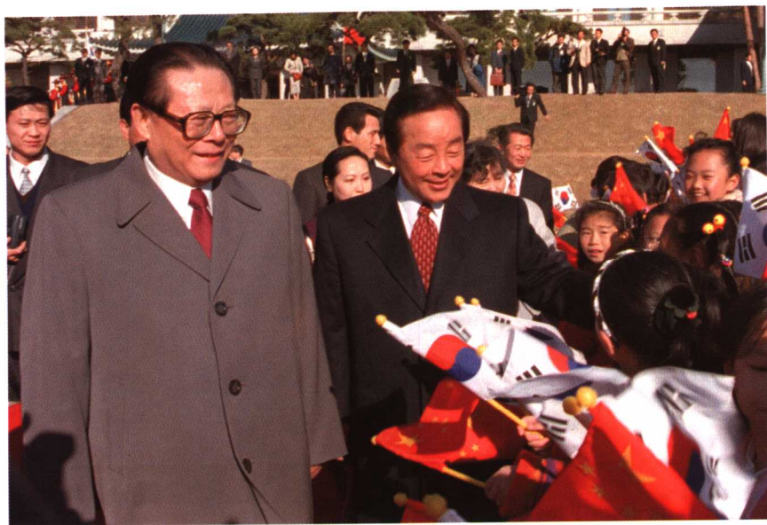
1995年11月14日，韩国总统金泳三在汉城青瓦台总统府举行仪式，欢迎来访的中国国家主席江泽民。