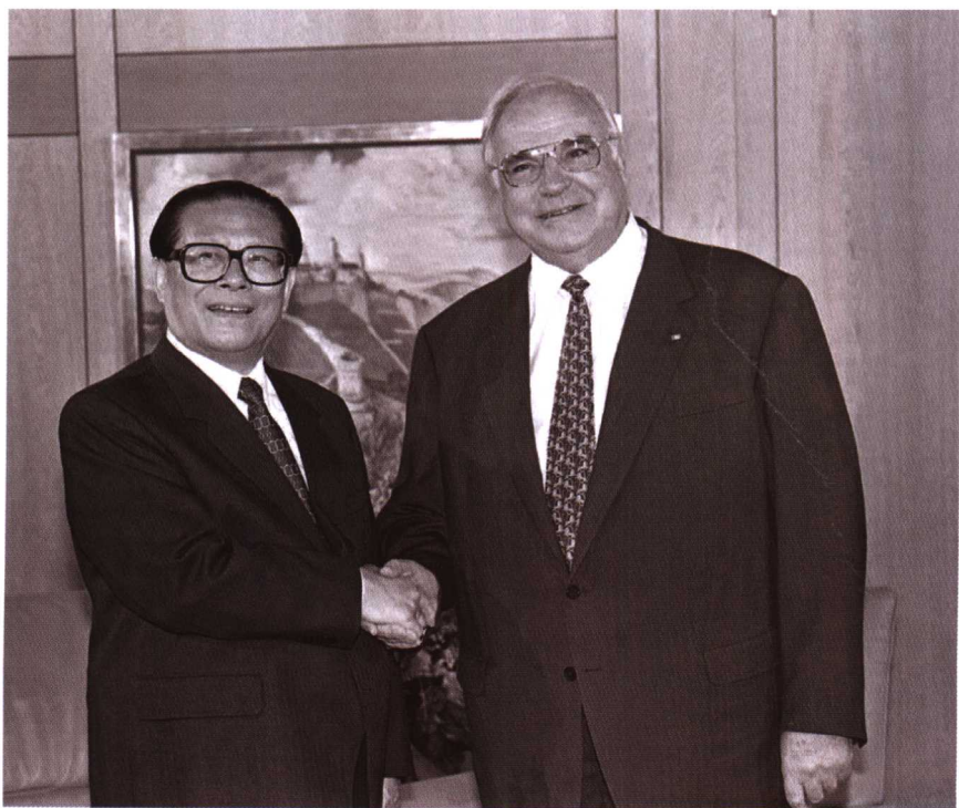
1995年7月13日，德国总理科尔在波恩总理府会见来访的中国国家主席江泽民。