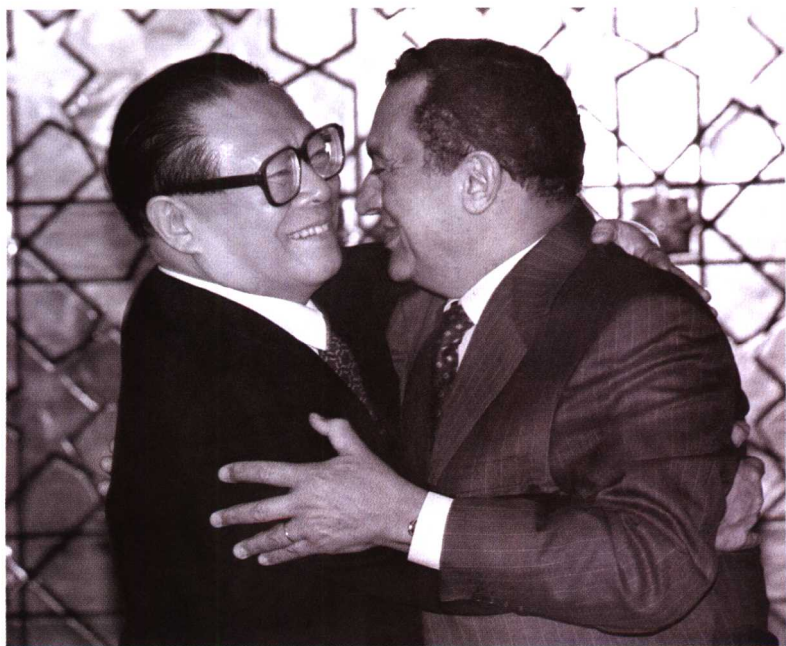
1996年5月14日，中国国家主席江泽民同埃及总统穆巴拉克在开罗总统府出席中埃经济技术合作等3项协议签字仪式后相互拥抱，表示祝贺。