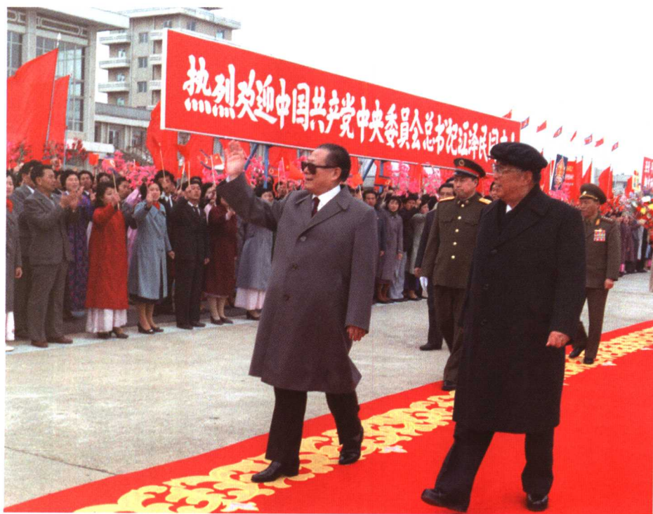
1990年3月14日，中共中央总书记江泽民在平壤机场受到金日成总书记和朝鲜人民的热烈欢迎。