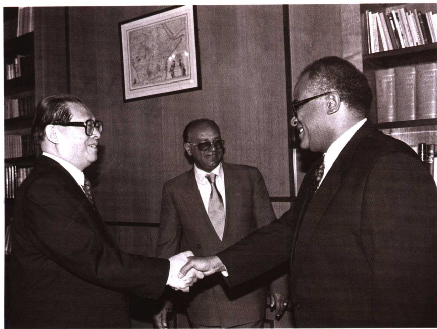
1996年5月13日，正在埃塞俄比亚访问的中国国家主席江泽民在亚的斯亚贝巴会见非洲统一组织秘书长萨利姆。