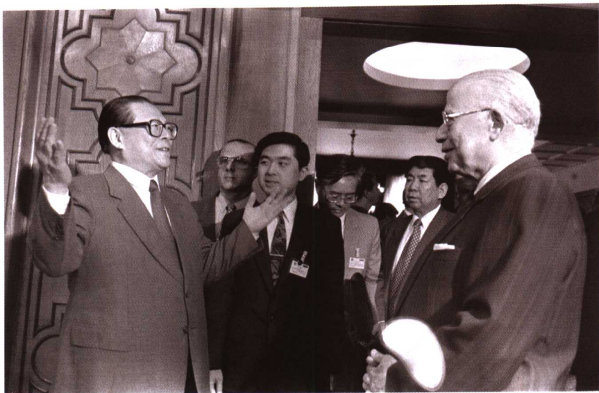
1996年5月14日，正在埃及访问的中国国家主席江泽民会见阿盟秘书长马吉德（右一），并在其陪同下参观阿盟总部会议厅。