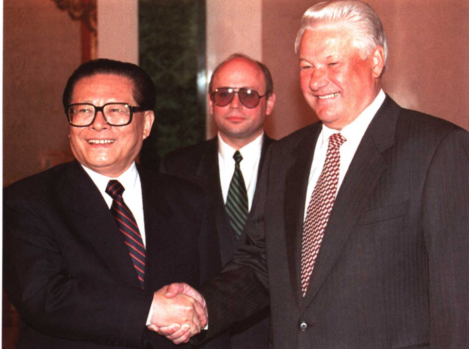
1995年5月8日，俄罗斯总统叶利钦在莫斯科克里姆林宫会见来访的中国国家主席江泽民。