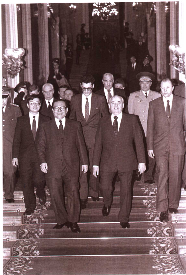
1991年5月18日，中共中央总书记、中央军委主席江泽民结束在苏联莫斯科的访问，苏共中央总书记、苏联总统戈尔巴乔夫在克里姆林宫为他举行了欢送仪式。