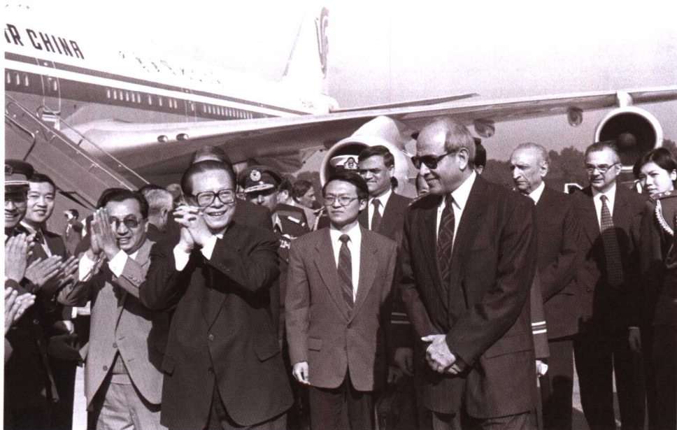
1996年12月1日，中国国家主席江泽民乘专机抵达伊斯兰堡，在机场受到巴基斯坦总统莱加里等的欢迎。