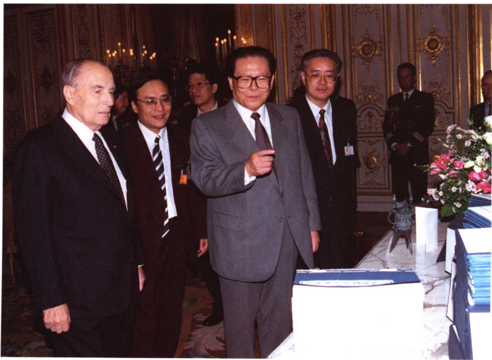
1994年9月9日，中国国家主席江泽民同法国总统密特朗在玛丽尼国宾馆互赠礼品。