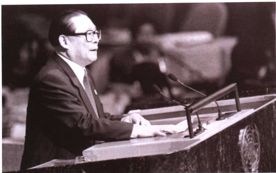
1995年10月24日，中国国家主席江泽民在联合国成立50周年特别会议上发表重要讲话。