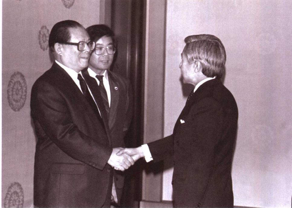
1992年4月7日，日本明仁天皇在日本皇宫会见来访的中共中央总书记江泽民。