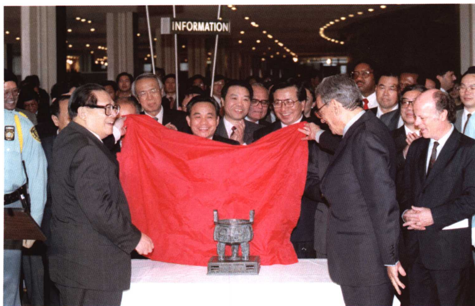
1995年10月21日，中国向联合国赠送“世纪宝鼎”仪式在纽约联合国总部举行。中国国家主席江泽民和联合国秘书长加利为“世纪宝鼎”模型揭幕。