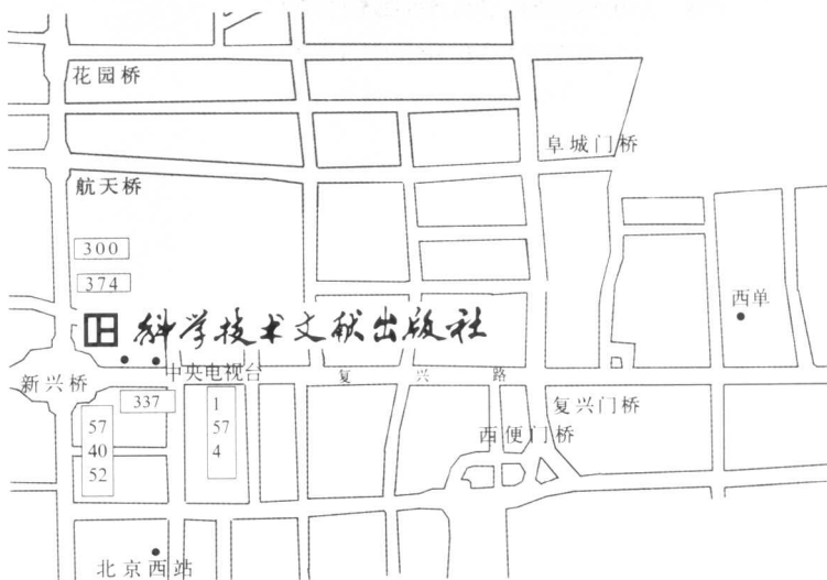
科学技术文献出版社方位示意图