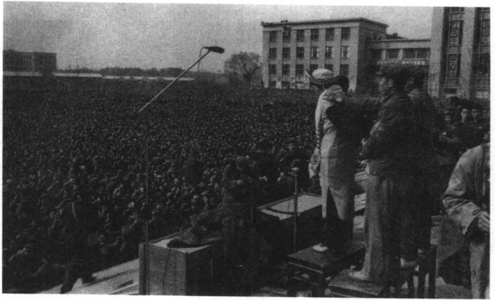
1967年4月10日，清华大学红卫兵将刘少奇的夫人王光美骗至清华大学批斗。