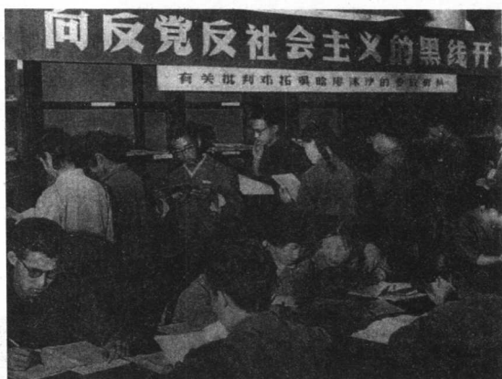
1966年4月，邓拓、吴晗、廖沫沙因《三家村札记》而受到批判。图为北京师范大学的学生在查阅资料，写批判文章。