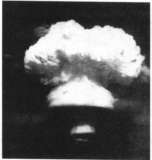
1967年6月17日，中国在西部地区上空成功地试爆了第一颗氢弹。