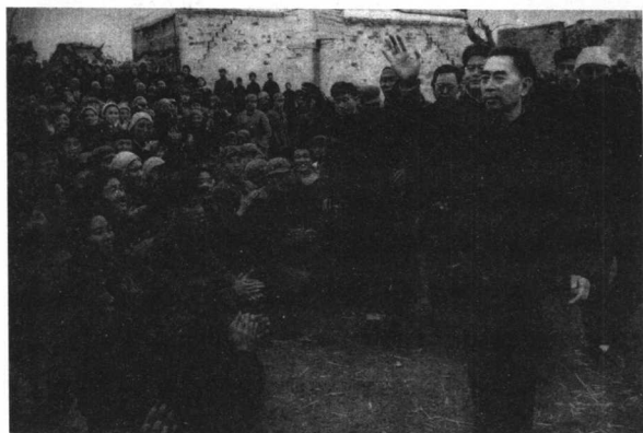
1966年3月8日，河北省邢台地区发生强烈地震。周恩来在余震未息之际，前往灾区慰问受灾民众。