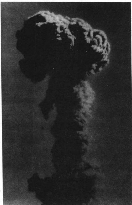
1964年10月16日,中国第一颗原子弹爆炸试验成功。