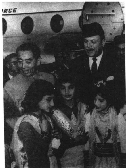
1963年12月13日至1964年2月29日期间,周恩来在陈毅陪同下,先后访问了巴基斯坦等14个国家。