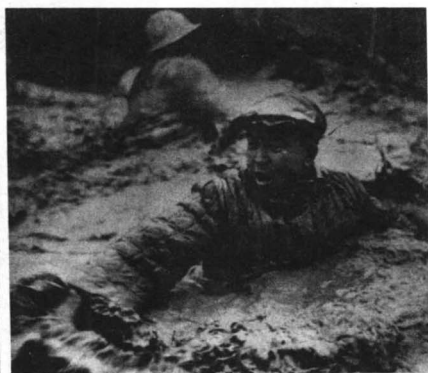
为大庆油田建设做出突出贡献的1205钻井队队长王进喜。图为他带领工人征服井喷。