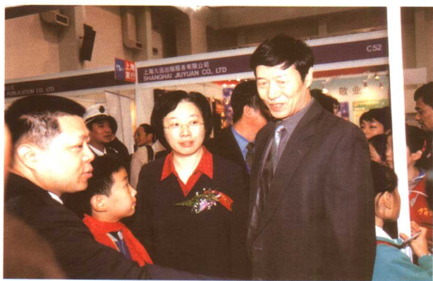
2003中国（上海）传媒业博览会上，向市委副书记殷一璀，市委常委、宣传部长王仲伟介绍上海教育报刊总社发展情况。