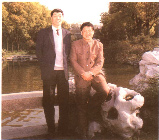
1992年12月，随中共中央政治局委员、国务委员、国家教委主任李铁映考察上海工作时，在驻地西郊宾馆留影。