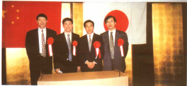
2000年11月，在日本大学中国语演讲比赛上担任评委。