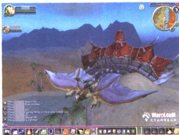
兽人骑着御风者旅行