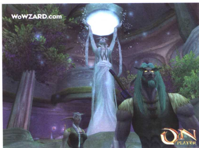
游戏中的暗夜精灵族

“魔兽世界”中的建筑包括小城镇和堡垒,还有6座分布在艾泽拉斯世界不同地点的主城。每一个城市还包含下属区域,用于社交、贸易和在地下城(游戏中有两种地下城:小型地下城和世界地下城)中冒险。据暴雪的资料,你甚至可以实现在水下探险的愿望。另一方面,世界