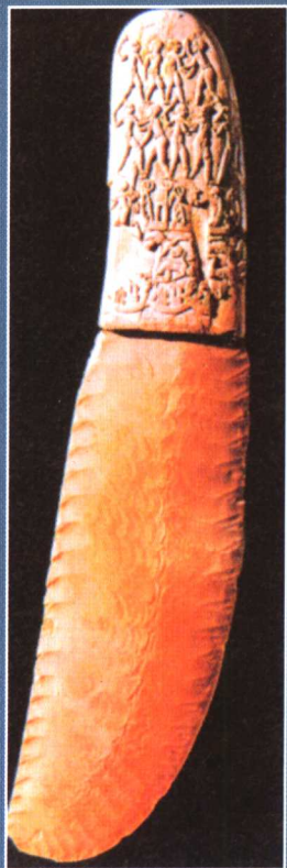
埃及新石器时代燧石匕首。