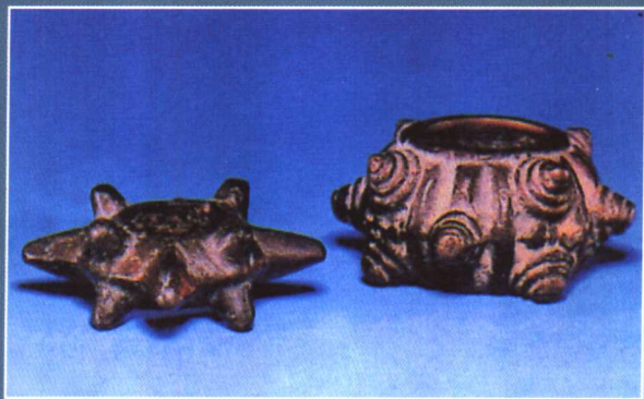
鄂尔多斯式铜锤头。