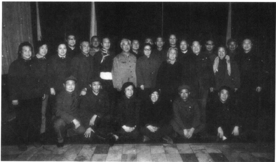
1979年11月，在第四次文代会上，丁玲与原中央文学研究所部分工作人员及学员合影。