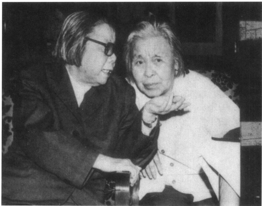
1979年6月，邓颖超与丁玲在全国政协第五届第二次会议上。