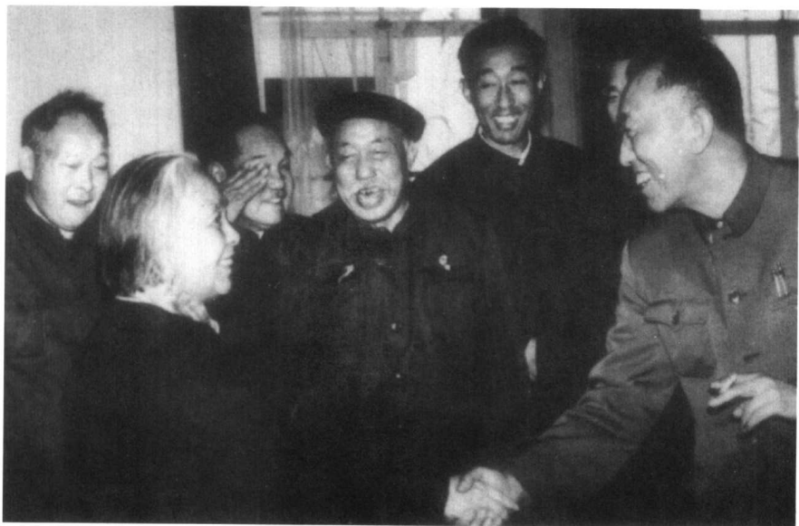
1979年11月，第四届全国文代会上，丁玲与作家马烽(右一)、陈森(右二，50年代曾担任丁玲的秘书)、石丁(右三)、吴伯箫(右四)在一起。