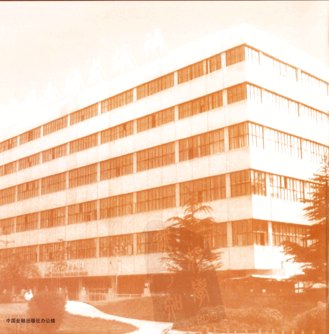
中国金融出版社办公楼