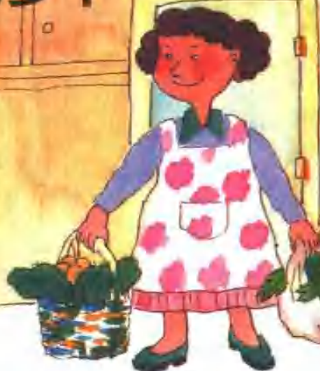
1. 星期天,妈妈买了许多菜。