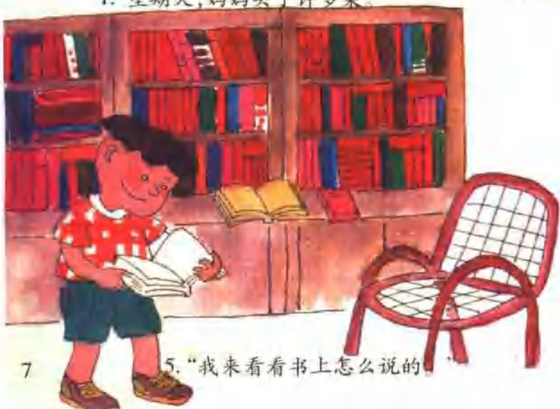
7. “我来看看书上怎么说的。”