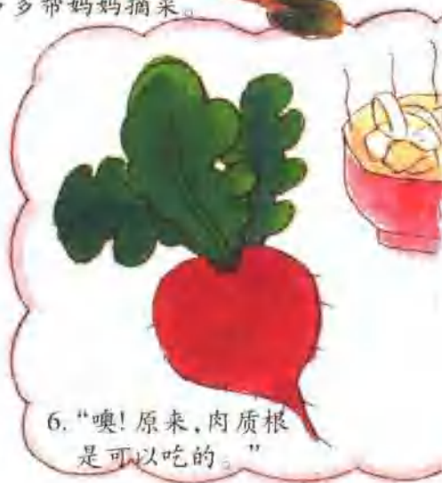
6. “噢!原来,肉质根是可以吃的。”