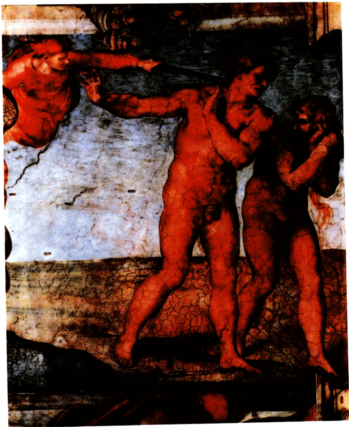
8 米开朗基罗：原罪与逐出乐园（局部） （1509—20年） 壁画 280×570厘米