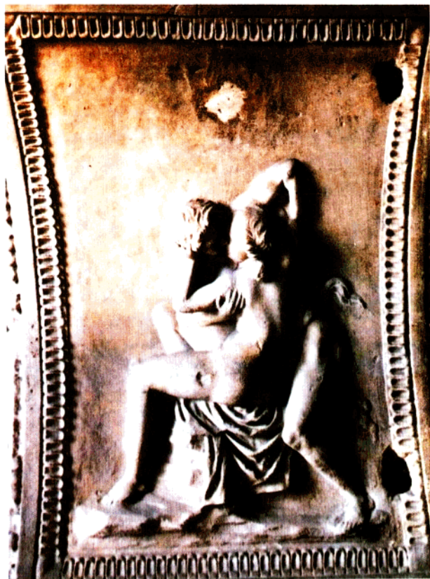
1 仙女与森林神兽撒提儿 (前一世纪) 大理石浮雕 95×93厘米