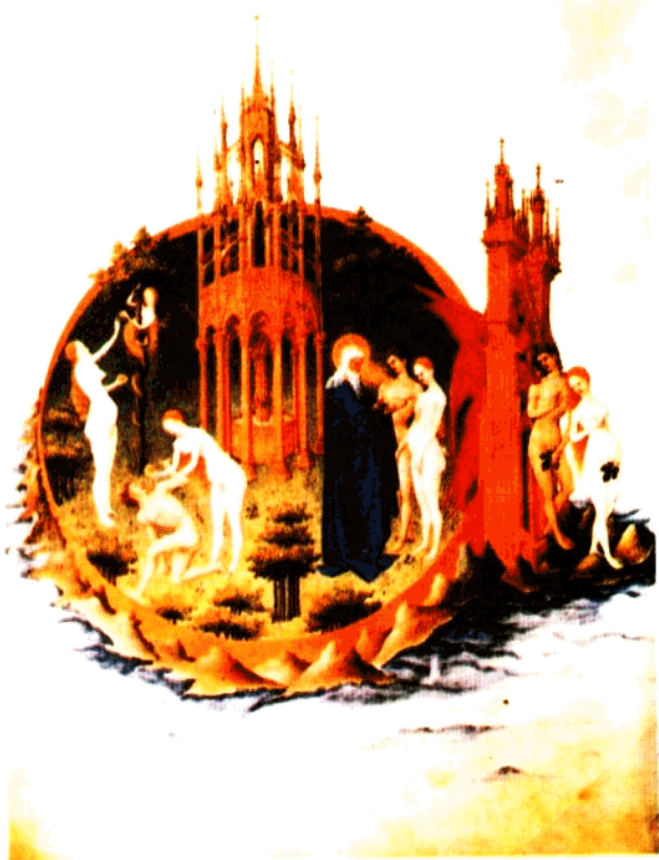
2 朗布尔兄弟：原罪与神驱逐亚当、夏娃离开 的伊甸园 (约1415年)