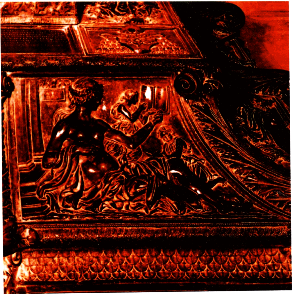
6 波拉约罗：文法（1484—93年） 青铜浮雕 长445厘米