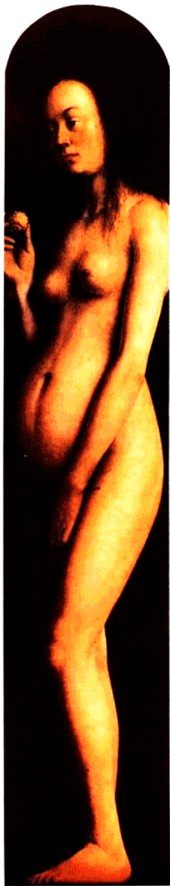
3 凡·艾克兄弟：夏娃（1432年） 木板油画 161×32厘米