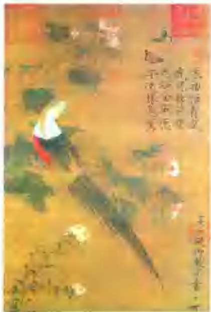
▲ 芙蓉锦鸡图(国画·花鸟) (宋) 赵佶

作为一种意识形态，美术与社会的经济基础和上层建筑之间，有着错综复杂的关系。一方面它受社会条件所影响，另一方面它又以特殊的方式影响社会，这就是通常所说的美术的社