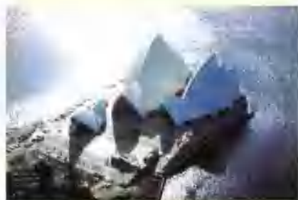
▲ 悉尼歌剧院(澳大利亚)伍重