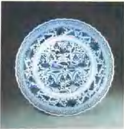
▼ 青花鸳鸯莲纹盆(陶瓷)实用类