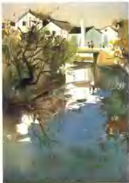
▲ 水乡小景(水彩画·风景)吴冠中

绘画是美术中主要的一种艺术形式。它是使用笔、刀、墨、颜料等工具材料,在纸、木板、纺织物和墙壁等平面上,通过构图、造型和设色等表现手段,创造出可视的艺术形象。这种艺术形象,既是现实生活的反映,也包含作者对现实生活的感受,反映了作者的思想感情和审美感受,使人从中受到教育和美的启迪。