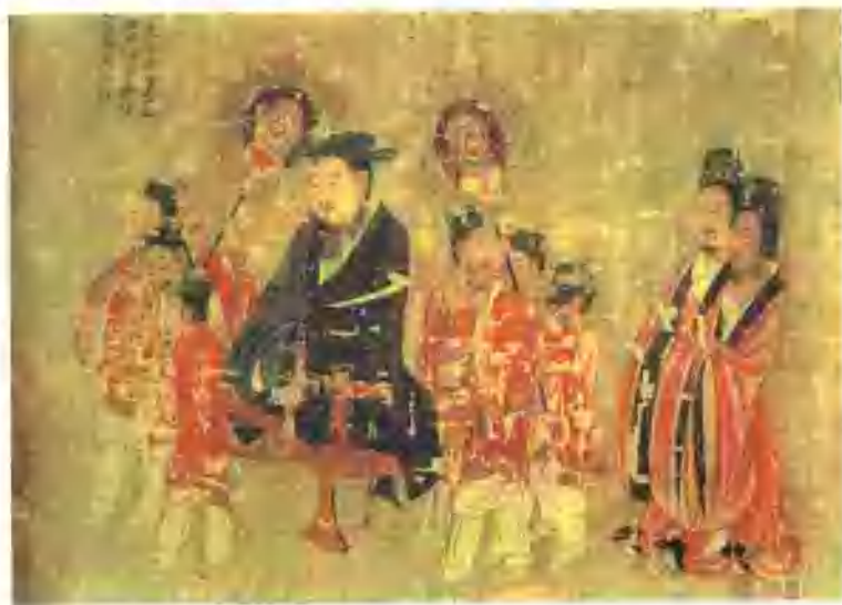
▼ 历代帝王图(国画·人物)(唐)阎立本