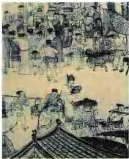
《清明上河图》的局部

幼儿师范学校的美术欣赏是一门必修的艺术教育课程。它旨在使同学们在义务教育阶段美术学习的基础上，进一步认识、了解人类创造的辉煌艺术成就，以及艺术在现代社会生活中的创造与发展，初步学会赏析艺术作品的方法，以此开阔同学们的文化艺术视野，提高审美文化修养，确立正确的审美观念，培养健康向上的审美情趣。现代幼儿教育的发展，对师资提出了新的、更高的要求，为了达到完善同学们的全面素质的目的，同学们应学会对艺术作品的内容和形式进行欣赏分析的方法，初步学会应用马克思主义的立场、观点去辨别、评价艺术作品的优劣。能从一个较高的层面上分析理解作品的内涵和艺术价值。在当今世界，各国为加强综合国力，在高新技术领域展开了激烈的角逐，而人才是基础。从根本上说，经济的振兴，社会的进步，都取决于劳动者素质的提高，而在构成人的全面素质的诸多方面中，审美文化素质是不可缺少的一个重要方面。中专阶段是同学们成长的重要时期，是身心发展的黄金阶段，通过艺术鉴赏这一重要途径实施的审美教育，对完善同学们的文化知识结构，发展个体情感，培养创新精神，成为跨世纪的全面发展的人才有着重要的作用和意义。