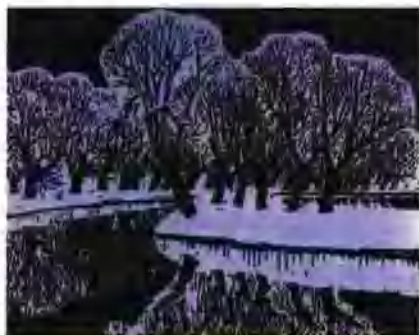
▲ 瑞雪(木刻版画)古元