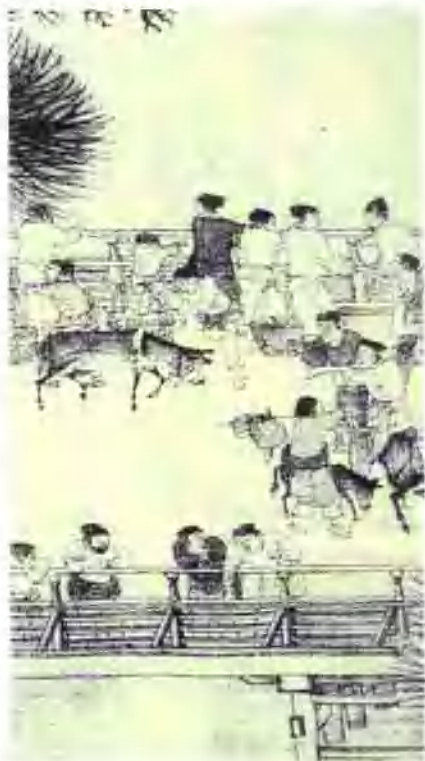
《清明上河图》的局部

总之,美术欣赏能使我们开阔视野,增长知识,陶冶情操,升华精神境界,提升人们的审美文化素质及审美能力。同时,它还有助于树立正确的审美观念,养成高尚的审美趣味,影响着一个人的道德品质的形成,所以美术欣赏对建设社会主义精神文明,培养造就 21 世纪的一代新人有着重要意义。