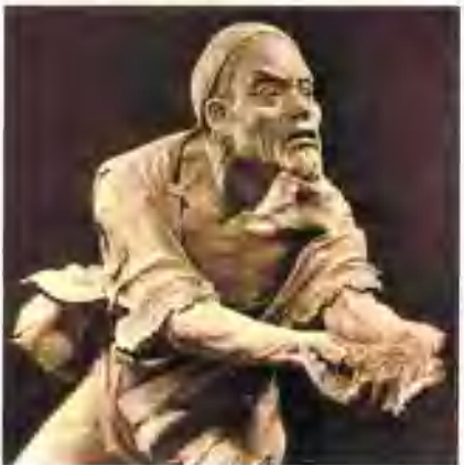
▼ 收租院之部分(泥塑)