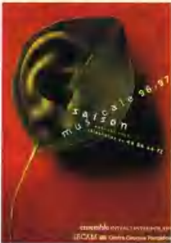
▼ 蓬皮杜艺术中心招贴画

绘画是一门最古老的艺术形式,远在公元前二万年,人类就已在岩壁上绘制图画,用以传递信息,表达他们的愿望和意志。在以后的历史发展过程中,绘画在人类的社会生活中起着不可缺少的特殊作用。随着时代的发展和科学的进步,新的绘画工具和材料不断出现,丰富了绘画的种类,导致不同的表现技法出现。尤其是近、现代以来,人类的艺术思潮空前活跃,绘画的形式、种类层出不穷,而东西方文化的交流,相互影响、融合、借鉴,也使得绘画种类,样式丰富多彩。