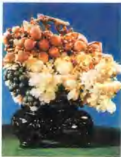
▲ 果实累累(玉雕)陈设类