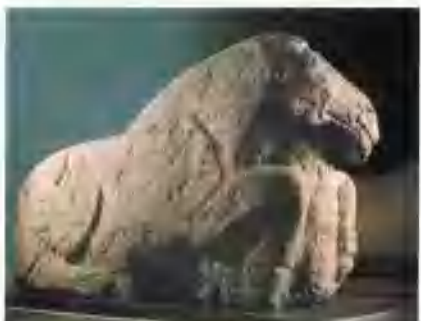
▲ 跃马(石刻)(西汉)霍去病墓