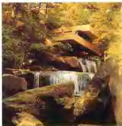
▲ 流水别墅(美国)莱特

建筑具有技术科学与艺术的双重属性。建筑艺术的美，依靠各种物质材料及建筑技术建立起来的形体呈现出来。具体讲，建筑的造型美体现在建筑的总体轮廓，建筑各部分之间的比例关系，建筑的体量、色彩、装饰等方面，同时也体现在建筑与周围环境的关系等方面。在欣赏现代建筑艺术时，应注意到以人为中心是设计的主导思想，因而，现代建筑的魅力在于其与人的亲和关系，体现在实用与舒适。另外，在欣赏现代建筑时，还应注意新型材料和新的建筑技术所体现出来的形式美感。