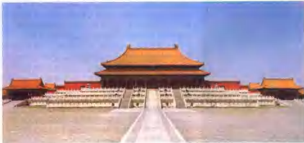
▼ 太和殿 (中国北京)