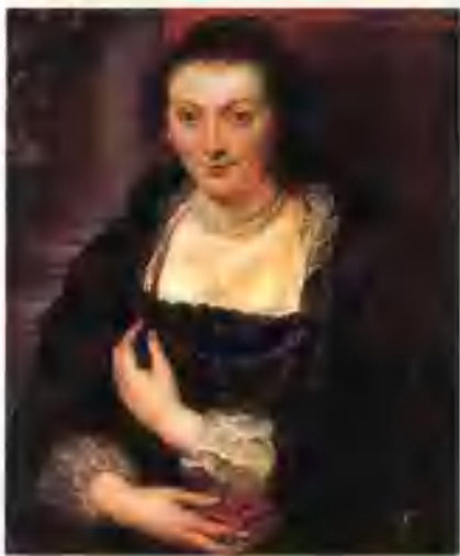
▲ 伊沙贝拉·布特肖像 (油画·人物肖像) (佛兰德斯) 保罗·鲁本斯