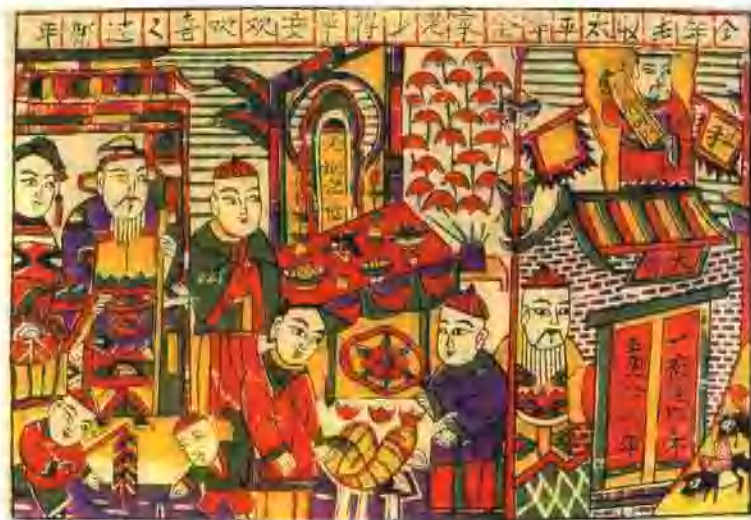
▼ 过新年(年画)山东杨家埠

中国传统绘画通常分壁画和卷轴画两大类。壁画又分为墓室壁画和宗教壁画等。卷轴画是中国传统绘画的一种独特的装裱形式。分为“手卷(长卷)”、“立轴”、“横披”、“册页”等。中国传统绘画按不同题材样式分为人物画、山水画、花卉、草虫、翎毛、鳞介等画科。中国画按不同技法特点分成工笔、写意和半工半写等种类。