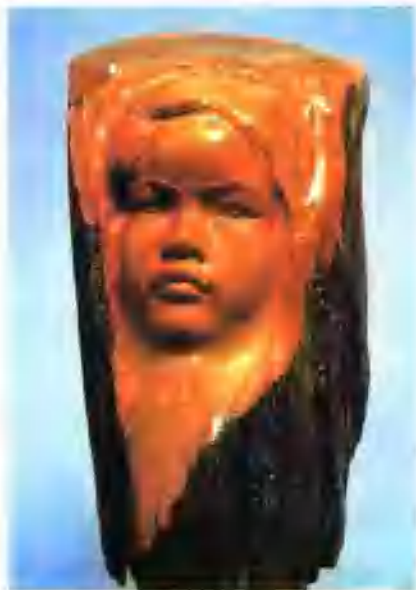
▲ 被毁坏的城市(现代雕塑) 妮(木雕)司徒兆光

雕塑作品是三维空间的实体,其予人的感受主要是它的形态和体积。雕塑作品的形象应简洁、有力,恰到好处地体现对象运动过程中最有表现力的瞬间。质材特点和加工痕迹是雕塑作品的艺术特征之一。雕塑作品还应与所置环境相适宜、相协调。