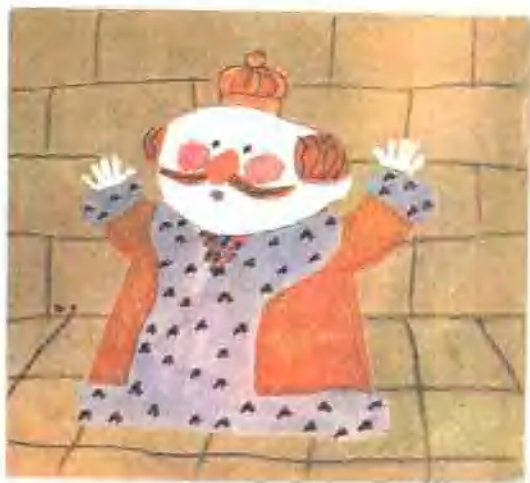
34. 这真是个美妙的主意，我要让所有的人看一看我漂亮的新衣服。