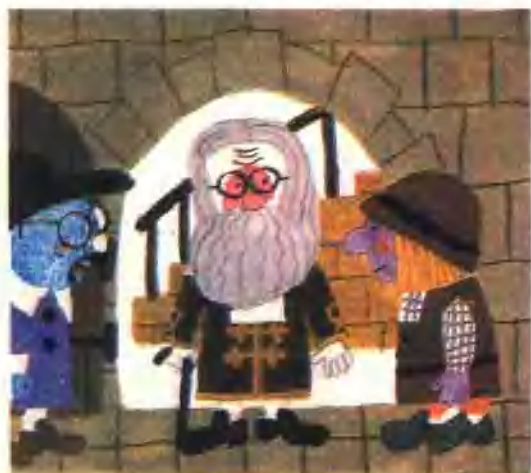
13. 老部长很快跑到骗子的织布房里。