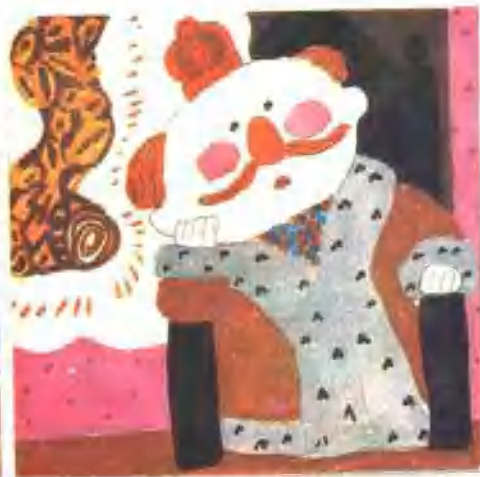
10. 皇帝想知道神奇的布织得怎么样了。