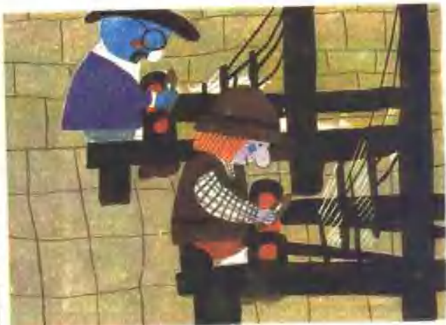
8. 织布机从早转到晚，可谁也想不到，那上面连一根线也没有。