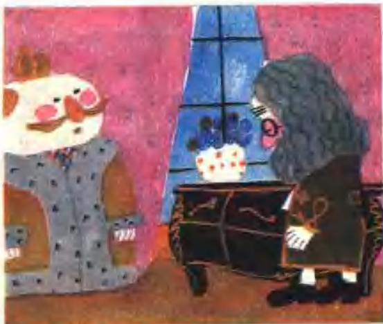
11. 他把老部长叫到面前。