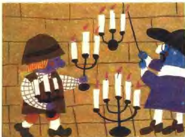
37. 游行大典的前一天,两个骗子点起许多蜡烛,一晚上都没睡觉。