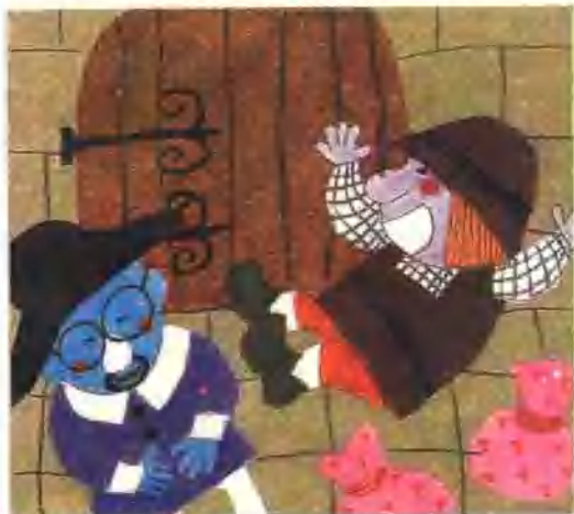
36. 皇帝和大臣们走了,两个骗子捧着肚子哈哈大笑。