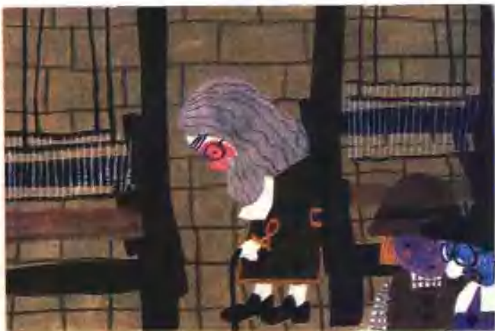
14. 上帝啊,我怎么什么也看不见!难道我是个大笨蛋吗?