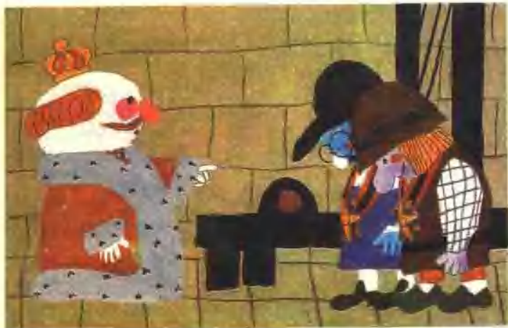
35. 皇帝命令两个裁缝尽快把衣服做好。