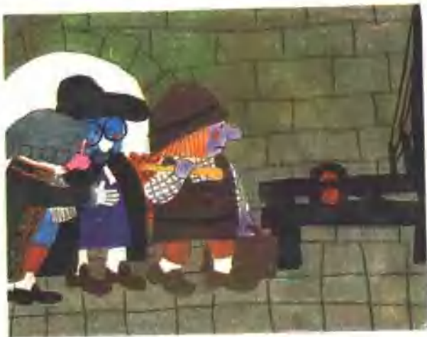
7. 两个骗子拿到钱，开始在两架织布机上忙忙碌碌干起活来。