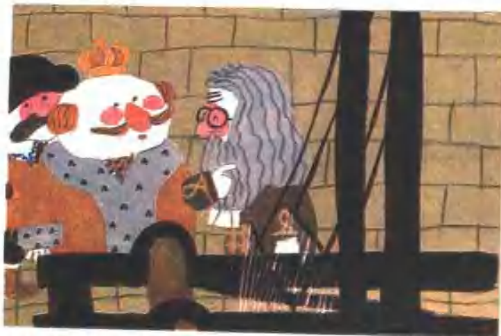
33. 陛下，您就穿上这种布做的衣服去参加游行大典吧！