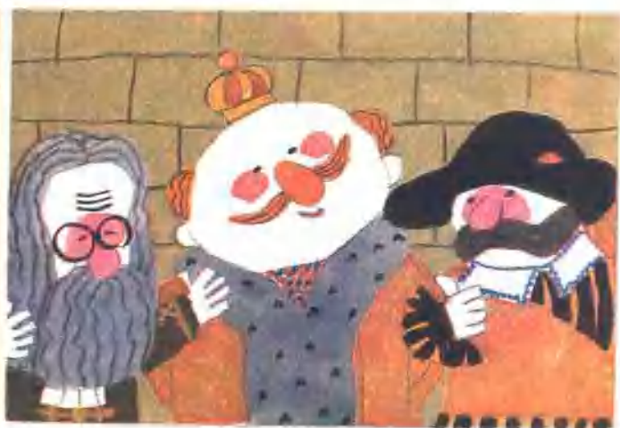
32. 在场的官员看上去全都很欣赏这种神奇的布。