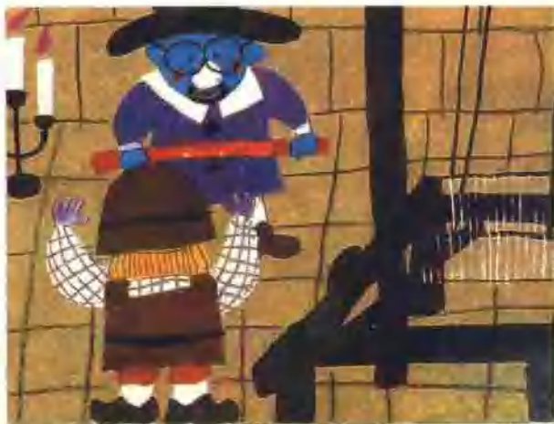
38. 他们假装把布从织布机上拿下来。