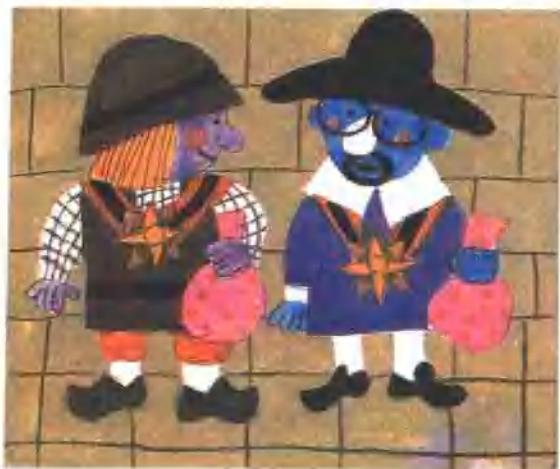
31. 皇帝又给骗子很大一笔钱，还奖给他们每人一个勋章。