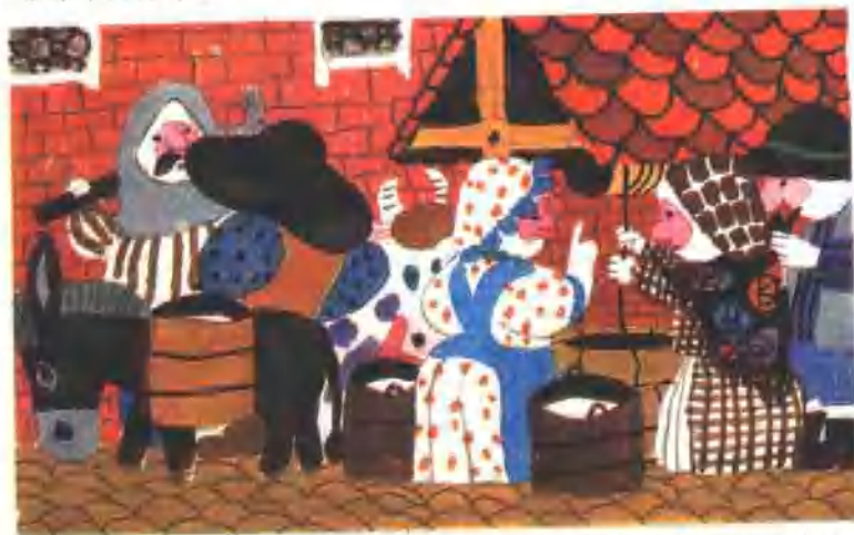
9. 全城的人都在谈论这种神奇的布，因为他们都想知道自己的邻居和朋友有多聪明。