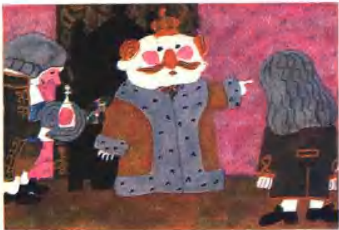
12. 你是最有学问的大臣,去看看那两个裁缝的布织得怎么样了?