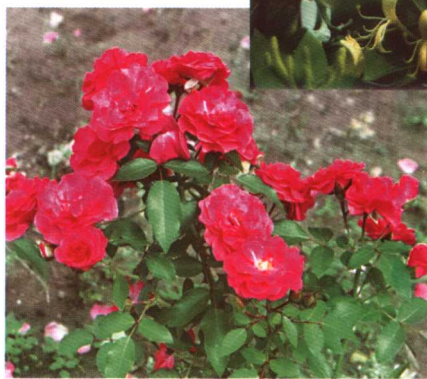
42. 香水 月季