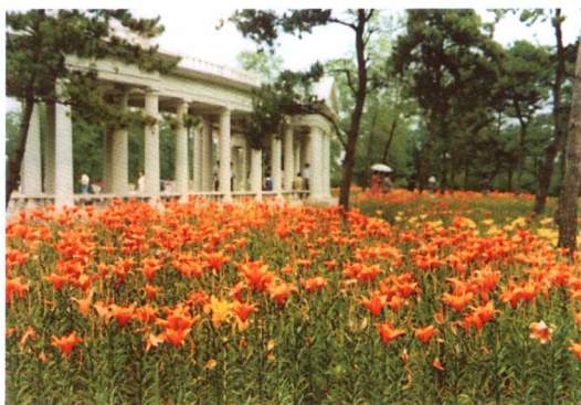
28. 沈阳植物园百合园