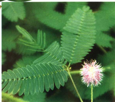
7. 含羞草的部分叶片合拢