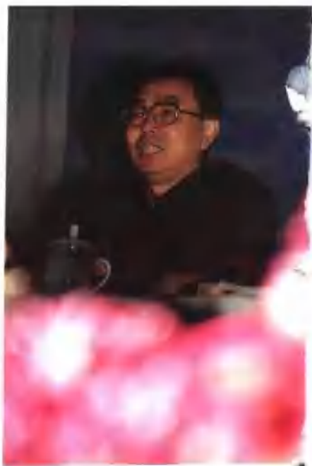
●河南省邮电管理局局长杨占富