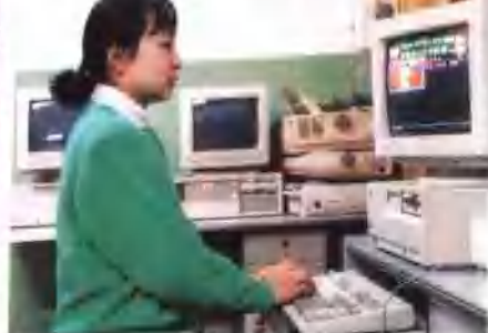
● 全省邮电部门向办公自动化迈进，图为省局支印室一角。