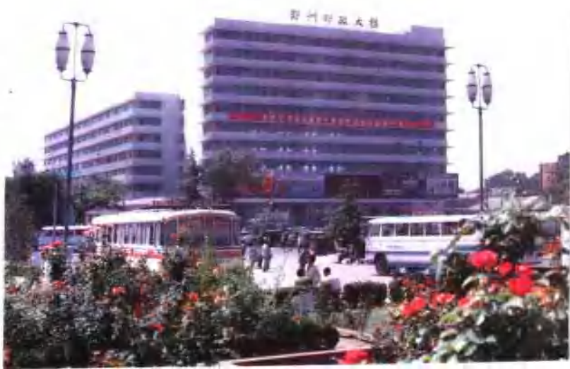
● 郑州邮政大楼（一九八六年）