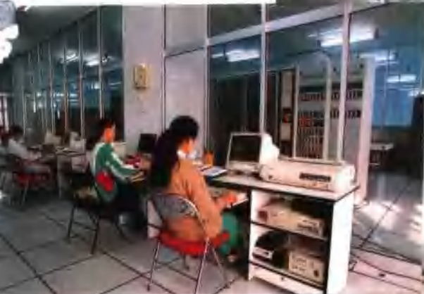
● 移动通信(大哥大)机房