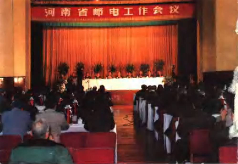
● 河南省政府首次邮电工作会议会场(一九九〇年十二月)