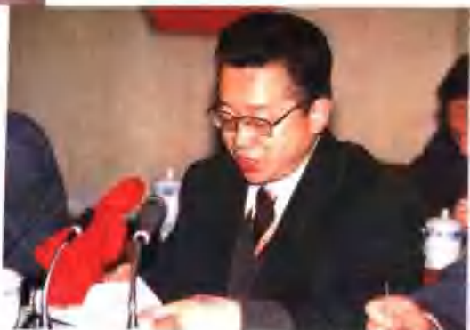
●河南省邮电管理局副局长罗会霖