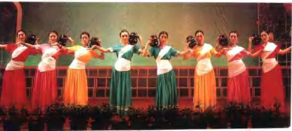
● 河南邮电职工自编自演文艺晚会