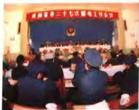
● 河南省第 27 次邮电工作会议会场 (一九八九年二月)