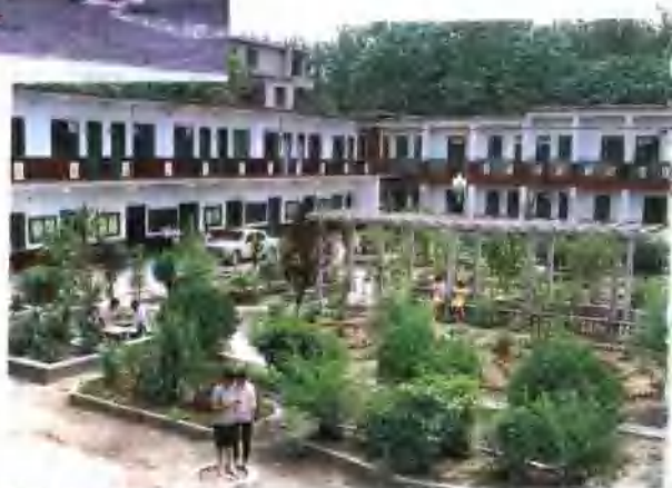
●长葛县邮电局一角