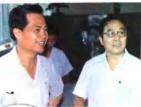
●原河南省委副书记吴基传、省局局长杨贤 足。视察邮电工作。(一九九〇年七月)