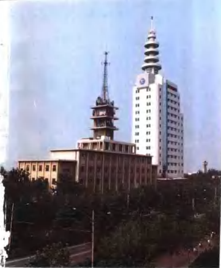
● 郑州长途电信枢纽楼（一九九三年）