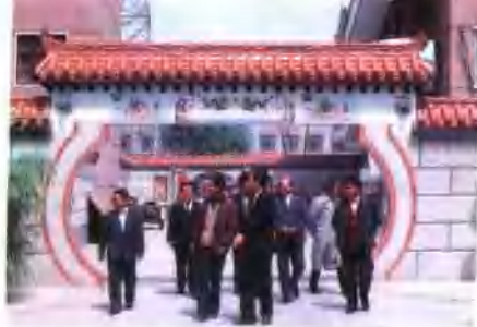
● 邮电职工住宅日臻完善，图为濮阳市邮电局家属院。