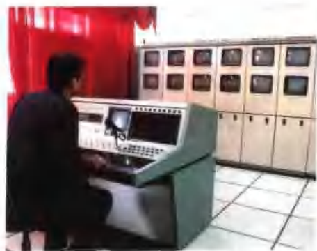
● 邮政通信电视监控系统