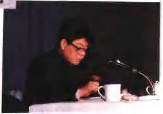
●河南省邮电管理局副局长孔德义