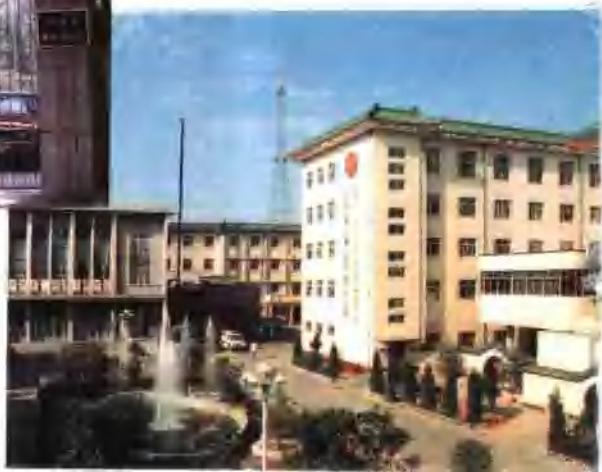
●开封市邮电宾馆外 景开封市自由路邮政 轻件楼