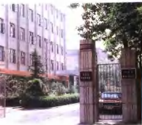
●河南省农村电话局