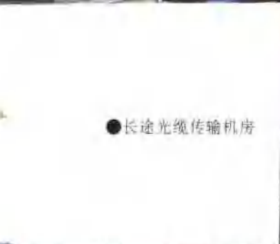
● 长途光缆传输机房