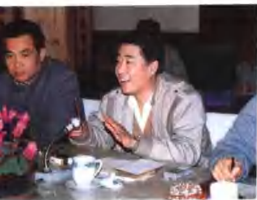
●刘德副省长在邮电工作会议上。(一九八九年)