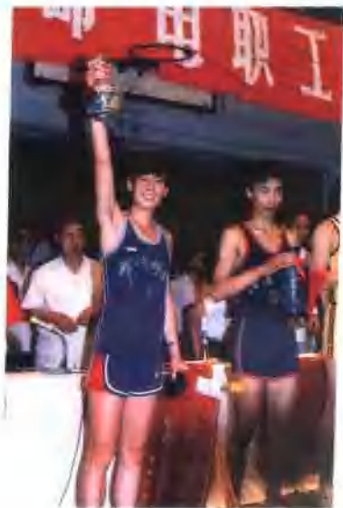
● 河南邮电体育在全国邮电系统比赛中名列前茅，图为一九九〇年获全国邮电男篮比赛亚军。（一九九〇）。