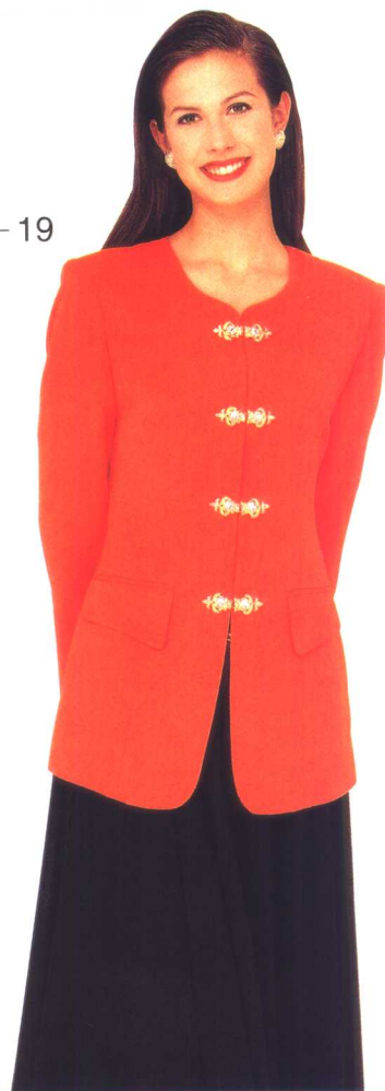
⑤ - 19