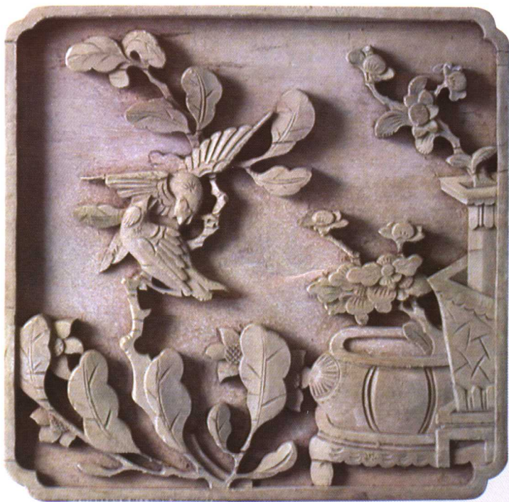
梅·鹤 / 清 樟木 尺寸: 32 × 32cm 参考价: RMB 4,000 元