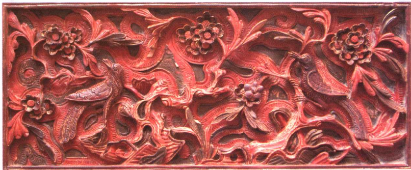
梅·鹊 / 清 梨木 尺寸: 16 × 40cm 参考价: RMB 6,000 元