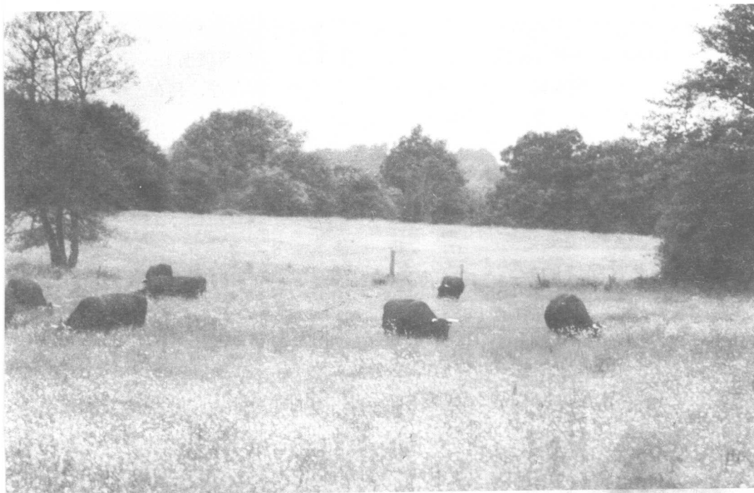
爱默生学院侧的牧场