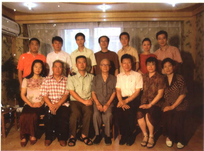
编委会部分成员合影