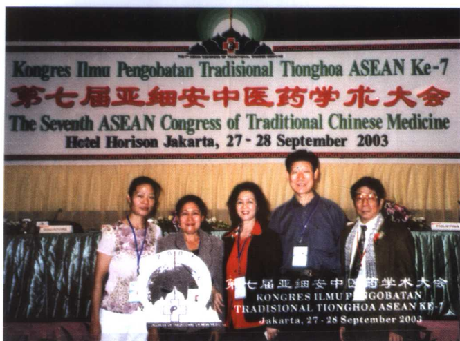
作者与印尼泗水中医协会负责人在国际会议上