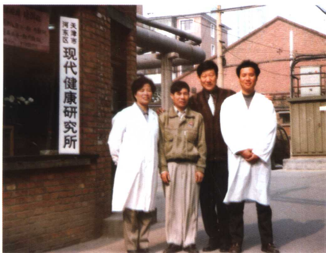
1996年创建现代健康研究所