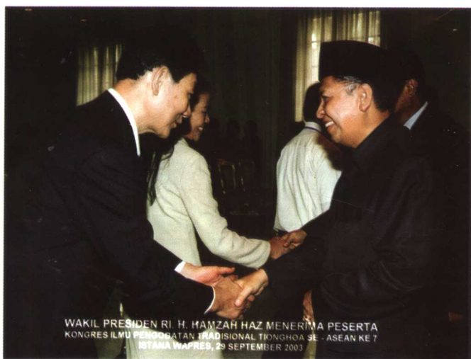
作者在印尼接受印尼副总统和卫生部长接见