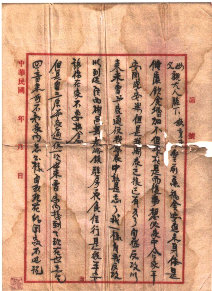
此书被中国国家博物馆收藏

1937年4月30日，一位普通的红军指战员在写给江西老家的一封信中，除了向父母双亲问安，深表惦念之情外，还用铿锵朴实的语言，谈到了当时第二次国共合作、一致抗日的形势，表现了红军指战员高度的政治觉悟和满腔的抗战豪情。