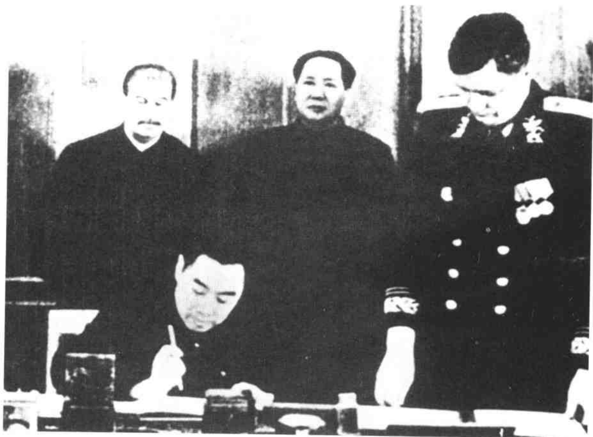
1950年2月14日，中华人民共和国中央人民政府主席毛泽东访问苏联，中苏两国政府在莫斯科签订了《中苏友好同盟互助条约》。图为中华人民共和国中央人民政府政务院总理兼外交部长周恩来在条约上签字。后排左1为斯大林，左2为毛泽东