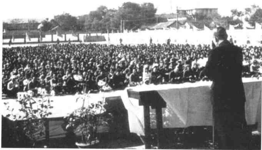
1952年，全国进行了高等院校的院系调整。原辅仁大学和原燕京大学的教育系合并到北京师范大学后，北师大举行开学典礼。