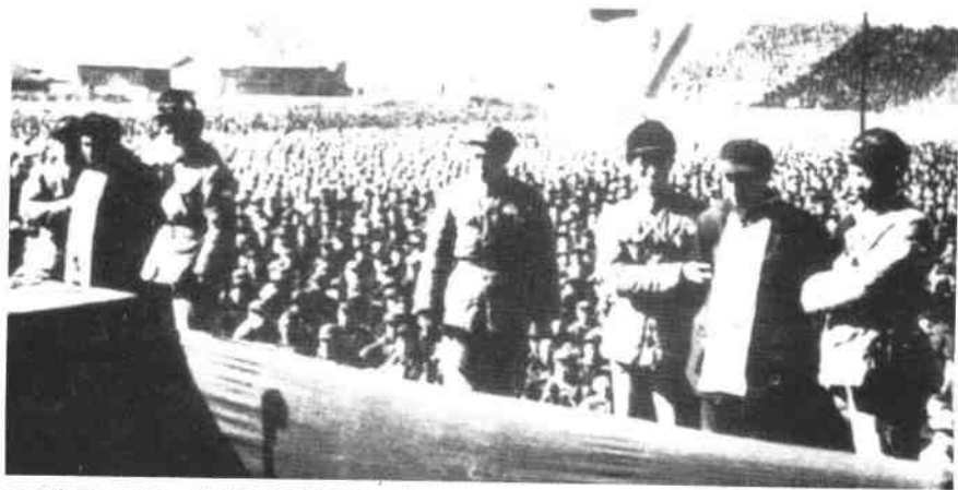
1952年2月10日，河北省高级人民法院在保定召开公审大会，以贪污罪判处前中共天津地委书记刘青山、前天津专区专员张子善死刑。刘、张二人利用职权贪污公款总计171.62亿元(旧币)