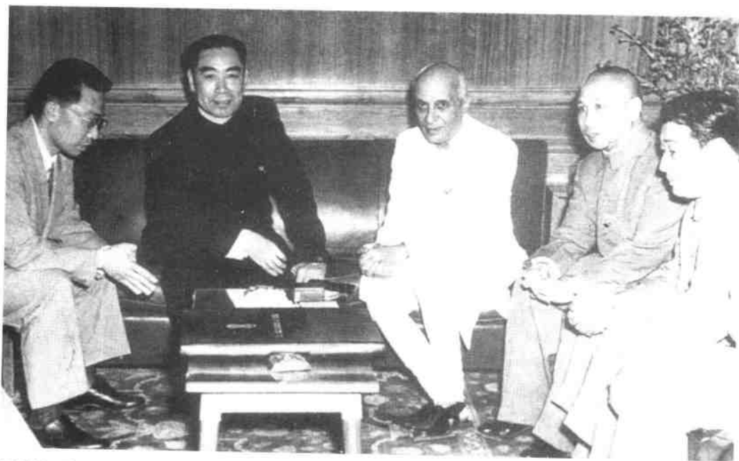
1954年6月25日至28日，周恩来应邀访问印度，与印度总理尼赫鲁(左3)举行了会谈。中印两国签订《关于中国西藏地方和印度之间的通商和交通协定》，协定提出了处理两国之间关系的五项原则：互相尊重领土主权；互不侵犯；互不干涉内政；平等互利；和平共处。