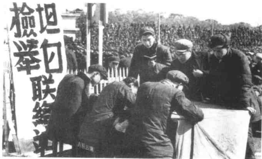
“五反”（反行贿、反偷税漏税、反盗骗国家财产、反偷工减料、反盗窃国家经济情报）运动开始后，全国各地纷纷设立坦白检举联络站。