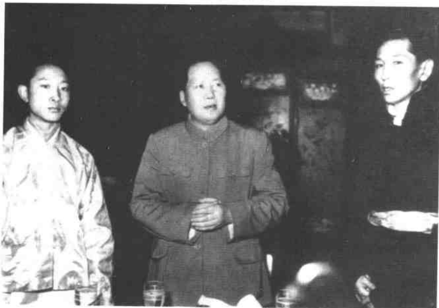
1951年5月24日，中央人民政府主席毛泽东设宴招待阿沛·阿旺晋美(右)与班禅额尔德尼·确吉坚赞(左)