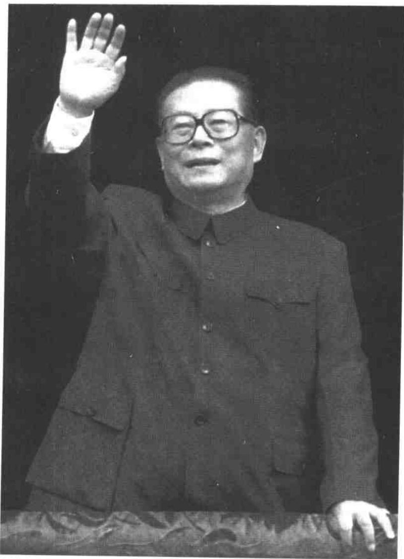
中共中央总书记、国家主席、中央军委主席江泽民在天安门城楼上