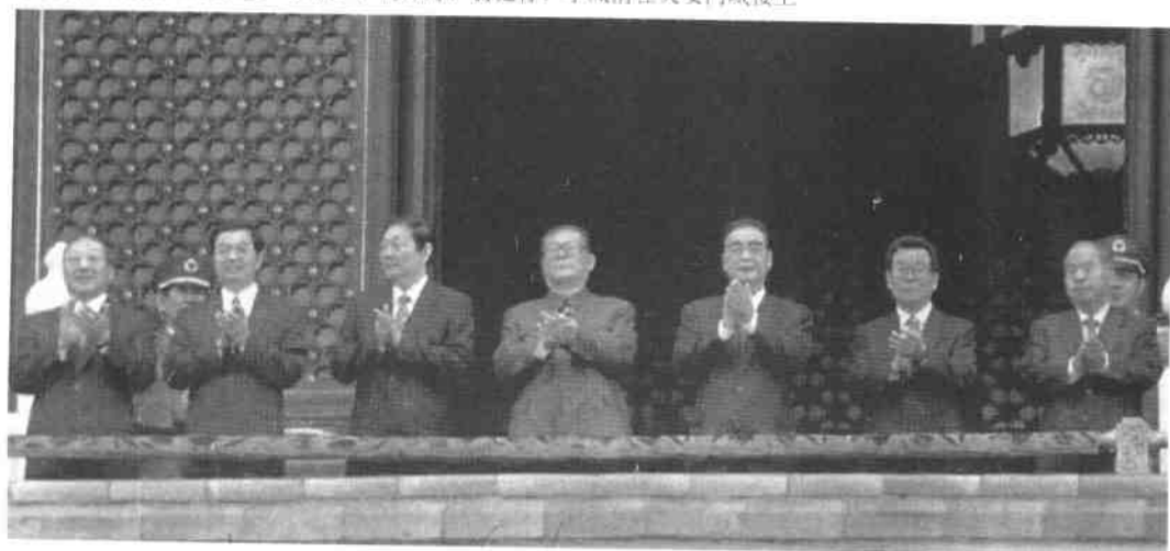
江泽民、李鹏、朱镕基、李瑞环、胡锦涛、尉健行、李岚清在天安门城楼上