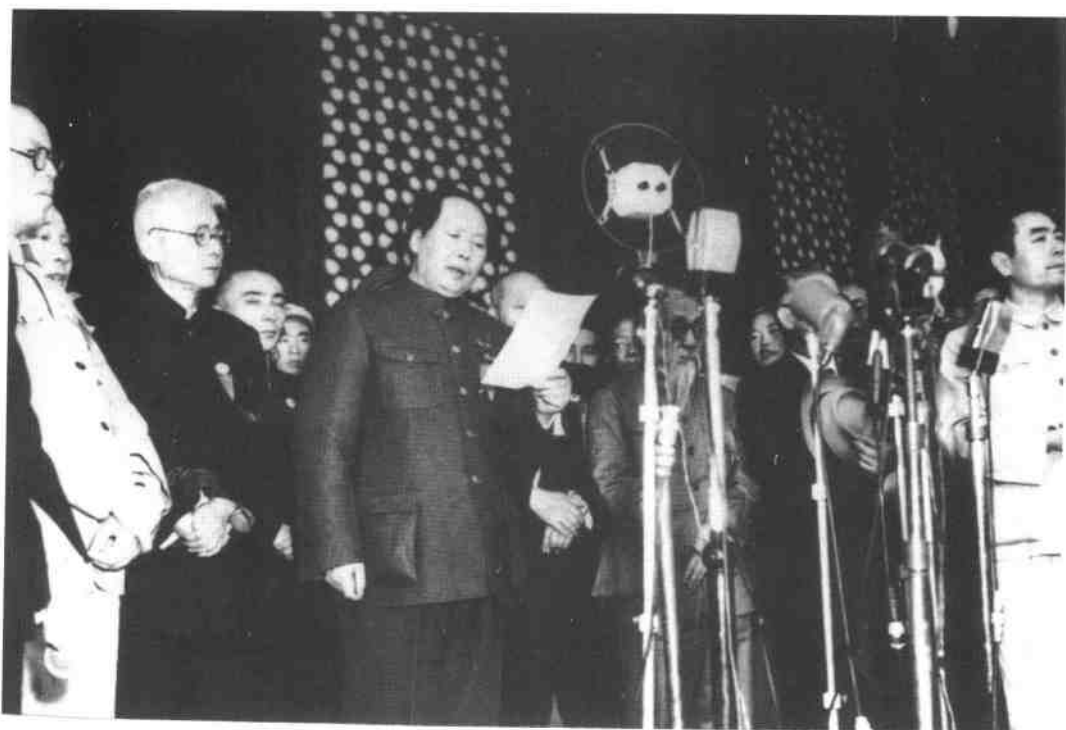
1949年10月1日，毛泽东在天安门城楼上庄严宣告中华人民共和国成立