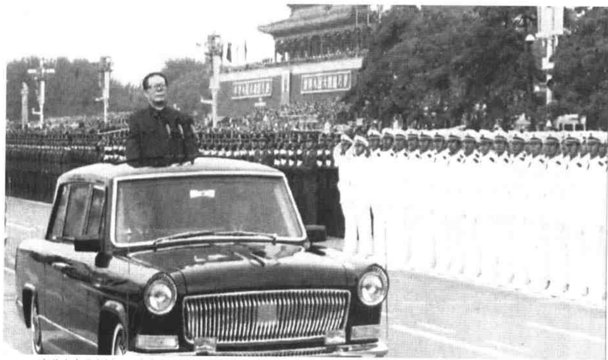
中共中央总书记、国家主席、中央军委主席江泽民检阅受阅部队