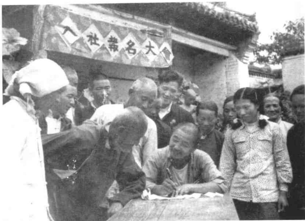
河北邯郸市郊区酒务楼村的农民报名入社。