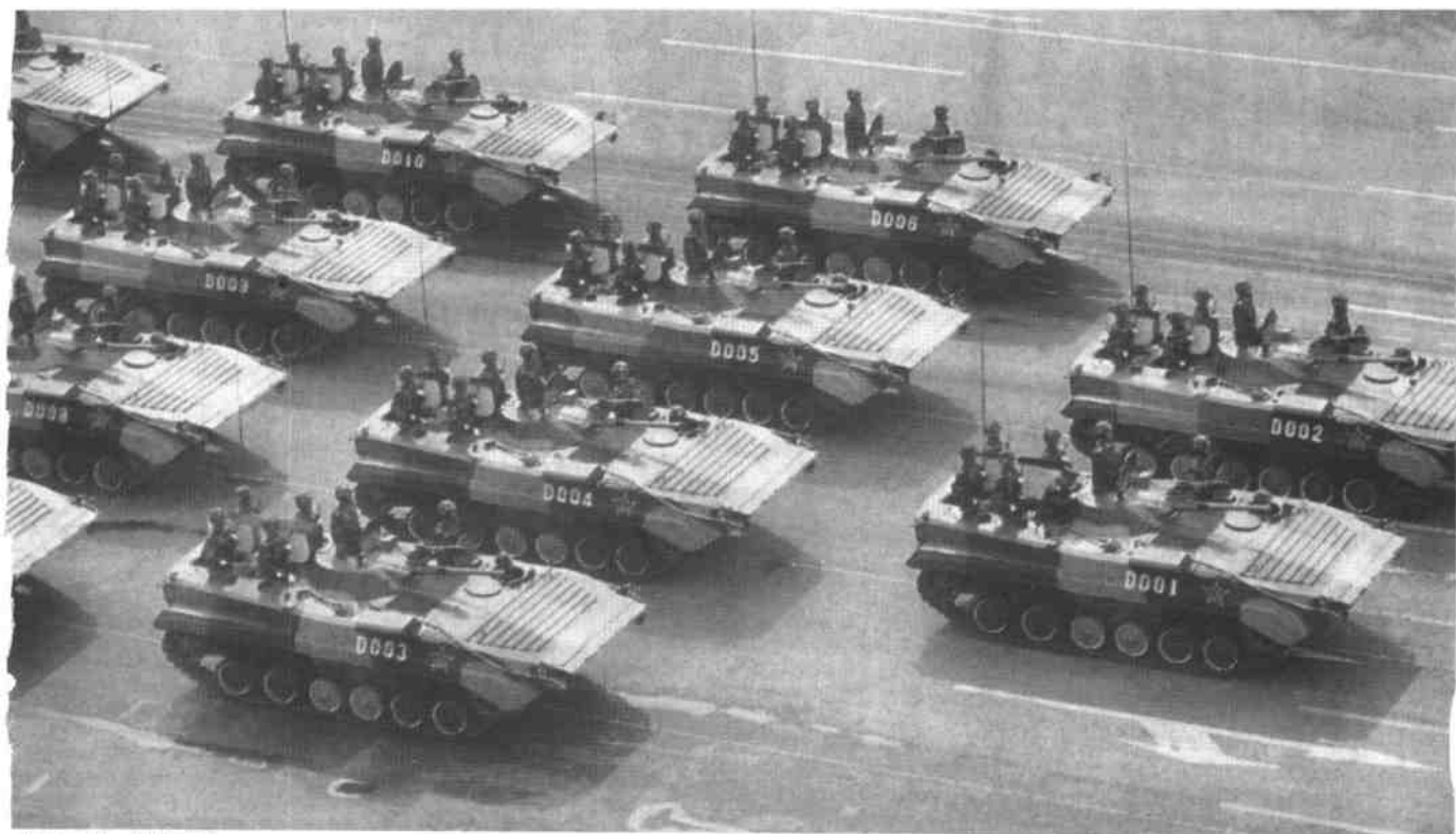
威武的装甲、导弹部队