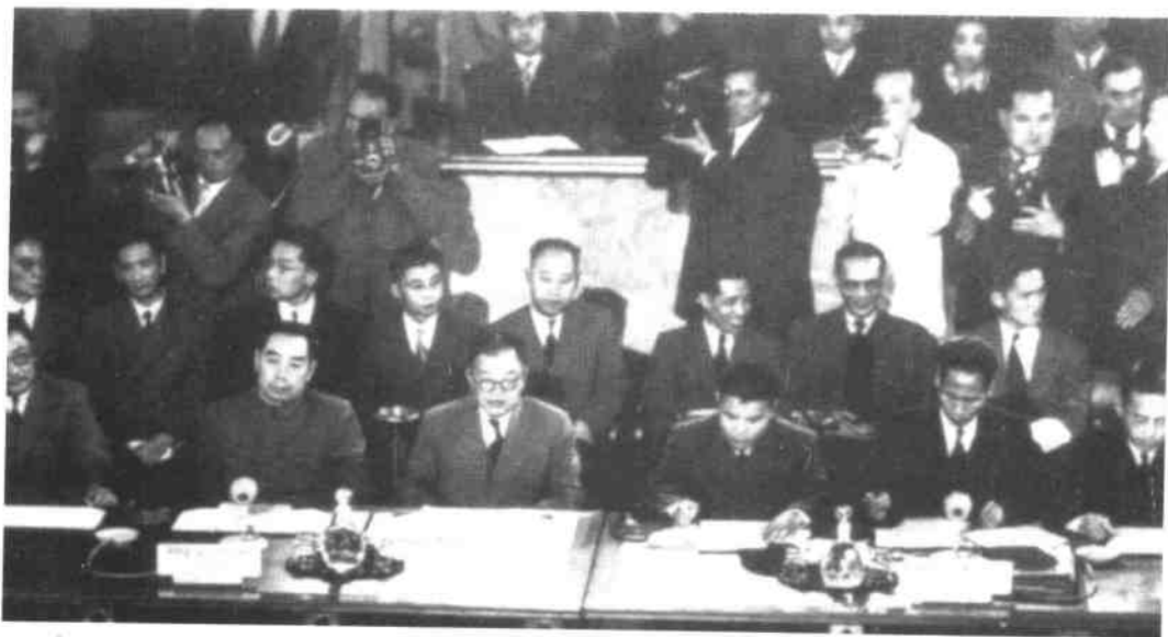
1954年4月26日至7月21日，周恩来(前排左2)率团出席日内瓦和平国际会议。在中国代表团的积极参与下，会议达成《关于和平解决印度支那问题的协议》，从而结束了长达8年的印度支那战争。