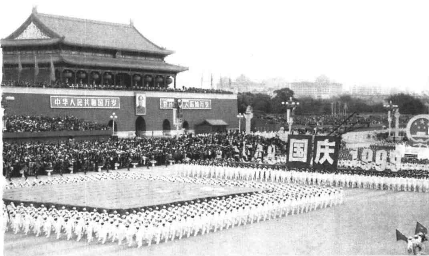
游行队伍中的国旗、年号、国徽三个方队通过天安门广场