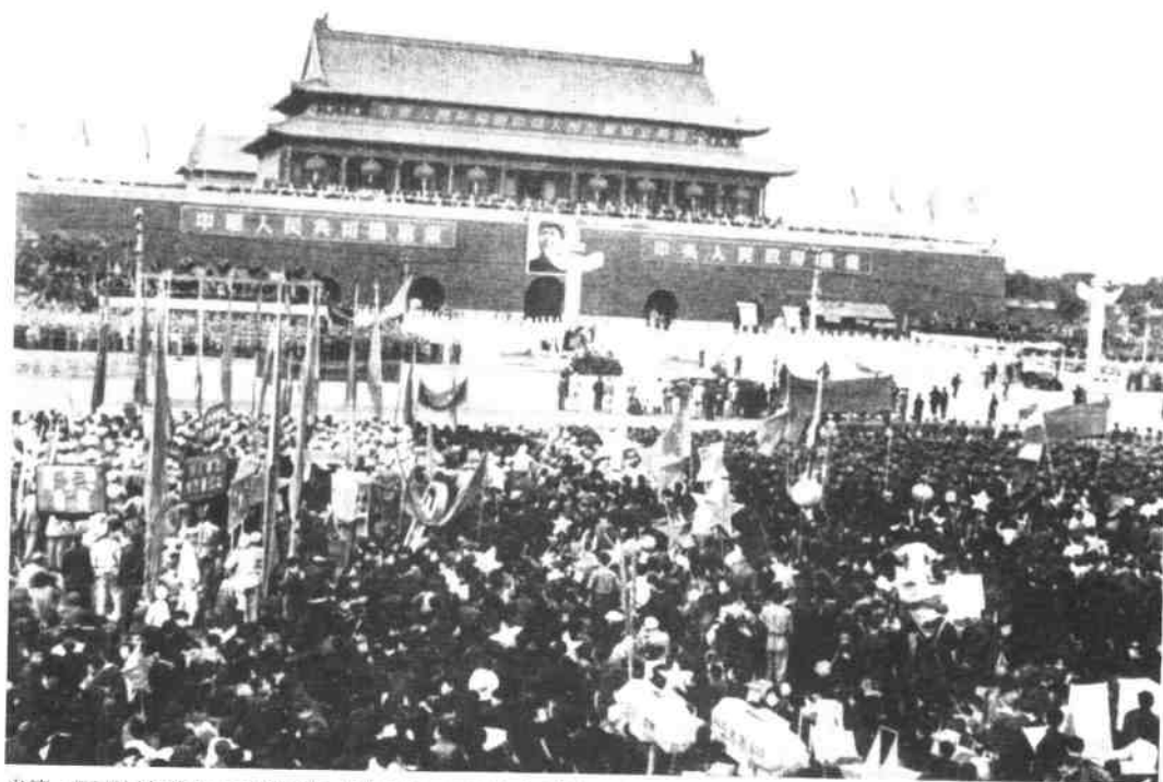
当第一面五星红旗在天安门广场上升起时，广场上欢腾的人群