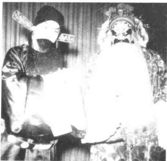
1951年5月5日，中央人民政府政务院发布了《关于戏曲改革工作的指示》，提出了“改戏，改人，改制”的要求。这是改编后的京剧《将相和》剧照。