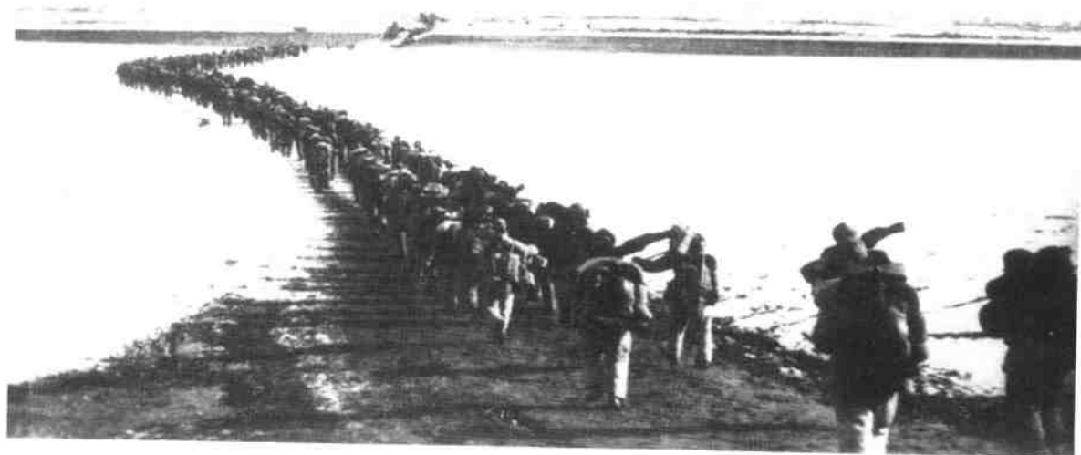
1950年10月19日，中国人民志愿军首批部队跨过鸭绿江，和朝鲜人民军一起与美国为首的联合国军作战