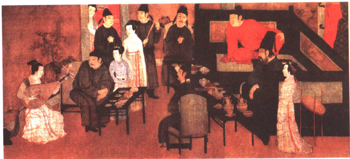
◇ 《韩熙载夜宴图》 顾闳中