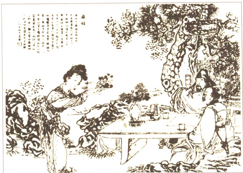
◇ 《麻姑》 清·吴友如