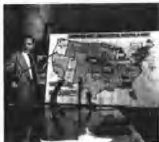
美国议员麦卡锡极力反共。

9日 美国参议员麦卡锡在西弗吉尼亚州惠林市宣称他已掌握 205 名渗入国务院的共产党人名单(此后该数字先变为 81 名,后减为 57 名)。但实际上毫无根据,由此开始对政府机构进行“共产主义渗透”调查。他攻击罗斯福政府和杜鲁门政府执政的 20 年是“叛卖的 20 年”。搜集黑名单并乱扣红帽子,攻击和迫害一切民主进步人士和持不同意见的人,在美国国内制造法西斯恐怖气氛。麦卡锡主义造就了美国历史的黑暗时期——麦卡锡时代,使战后美国的反共反民主的政治逆流达到高潮。随后 5 年里,美国国务院的许多官员和社会各界的大批民主人士受到“调查”、“指控”和审讯,美国共产党和其他进步组织遭到公开镇压,成千上万人遭到迫害。后来麦卡锡主义发展到粗暴干预行政,外交和军队事务,从 1953 年 11 月起把攻击矛头直指艾森豪威尔政府,1954 年又扩大到对陆军的调查,终于引起军队愤怒和共和党政府与其彻底摊牌。1954 年 4 月 22 日至 6 月 17 日陆军——麦卡锡听证会上,麦卡锡败阵,自此一蹶不振。1954 年 11 月,共和