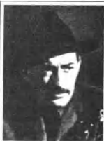
格里高利·派克是来自密西西比州的一名“枪战能手”。他曾经是一名暴徒，但已悔过自新，力图以行动洗清自己过去的罪名。