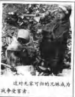
这对无家可归的兄妹成为战争受害者。

内担任该机构的首任主席。1953年2月到1954年8月，“联营”六国先后建立了煤、钢、铁砂、废铁、合金钢和特种钢的共同市场。“联营”的最高权力机构负责协调成员国的煤钢生产、投资、价格、原料分配和内部的有效竞争。欧洲煤钢联营促进了成员国冶金工业的发展，它的建立为50年代后期成立“欧洲共同市场”奠定了基础。