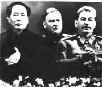
毛泽东、斯大林、布尔加宁在一起。

旅顺港和大连港归还给中国，并且答应提供价值3亿美元的贷款。在条约的两项秘密条款中，毛泽东同意供给苏联数十万工人，并同意在中国军队、警察和共产党要害部门任用苏联专家。