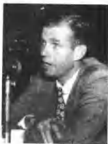
“马共狂”的最近的牺牲品希斯。

显然，马立克这一行动是为了表明，坚决支持苏联与之真诚联盟的毛泽东和共产党中国。报道说，这两个强有力的共产党大国一直在争论满洲的前途问题。俄国人长期以来想得到满洲，在联合国的这一举动，也许是为缓和紧张气氛所作的努力。