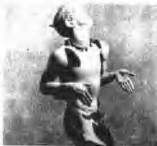
尼任斯基在《牧神的午后》中的表演

瓦斯拉夫·尼任斯基出生于基辅，1907年加入皇家芭蕾舞团，并很快结识了加吉列夫。加吉列夫是一位演出主持人，帮助尼任斯基编排了《牧神的午后》(1912年)和《春之祭》(1913年)。尼任斯基因弹跳好，思路广而闻名。