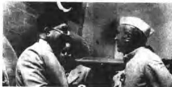
阿里·汗在新德里一下飞机就受到尼赫鲁的热情欢迎。

5日 东、西孟加拉最近因回教、印度教的信仰不同而发生冲突，印度总理尼赫鲁和巴基斯坦总理阿里·汗在今天就《少数民族权利法案》达成协议。