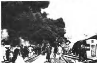
上海遭受国民党的轰炸。

31日中国国民党飞机对大陆沿海城市发动骚扰性袭击。试图阻止共产党进入大陆沿海岛屿。以海南岛为基地的国民党飞机轰炸和扫射了南方港口广州市，造成了相当程度的破坏和伤亡。这种轰炸被看做是为延缓共产党进入海南岛所做出的努力的一部分。从台