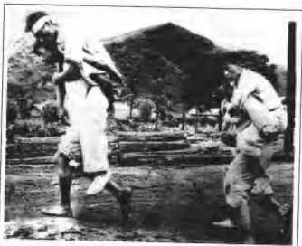
两名受伤的北朝鲜人被抬离战场。

由于峰顶独具特色，这座山峰变得神秘莫测。这一点或许胜过喜马拉雅山的最高峰，也是世界最高峰——珠穆朗玛峰。实际上，安纳布尔纳峰并非一座山，而是沿着一条35英里长的山岳的四座山峰之一。赫尔佐格登山队此次攀登的是安纳布尔纳峰的第一峰，即这条山脉的最高峰，也是最西面的山峰。