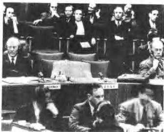
苏联代表退出安理会会议。

10日 苏联驻联合国代表——马立克愤怒离开联合国安理会。他的退席，是对“中华民国”代表蒋廷黻出席会议的抗议。苏联曾经提出一项把失去对中国大陆统治的国民党逐出联合国的议案，但遭到否决。 马立克在安理会上说，让蒋参加会议是“荒唐的”。他说：“我作为苏联代表，在开除国民党代表的安理会成员资格之前，是不会参加安理会工作的。”