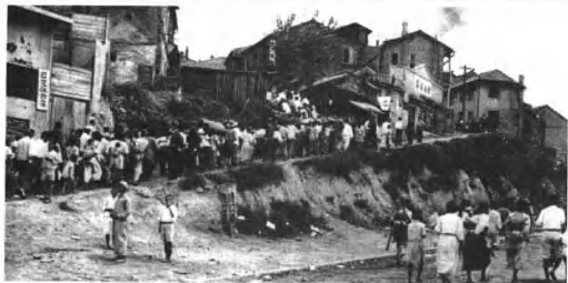
朝鲜战争中的南朝鲜难民。