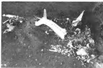
英国客机坠毁，80人死亡

12日 今天发生了航空史上最惨的灾难。一架租用客机在威尔士坠毁，死亡80人，仅有3名乘客幸免于难。这架英国“阿弗罗都德式”飞机的机头栽进了加的夫附近西金斯顿村外的田地里。这次伤亡人数超过了上次的纪录。上次空难发生在去年，一架战斗机和一架客机在华盛顿附近相撞，