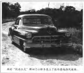
新的“凯迪拉克”牌四门小轿车装上了弧形整块挡风玻璃。

约瑟夫·麦卡锡 1908 年 11 月 14 日生于威斯康星州。14 岁辍学,20 岁又复学。1935 年毕业于马克特大学法学院。后担任律师,但成就不大。1940—1941 年任州巡回法院法官。1941 年突然结束法官之职,加入美国海军。1945 年退役时因从未参加过战斗而获“尾巴枪手乔依”绰号。1946 年当选参议员。1950 年 1 月开始借反共言论提高政治声望。1952 年连任参议员并成为参议院工作委员会主席。1957 年 5 月 2 日,麦卡锡在政治冷遇中病故。