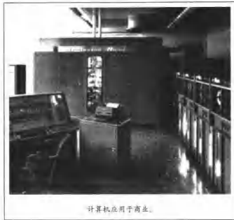
计算机应用于商业。

1000倍。原子弹利用原子的分裂，而氢弹利用原子核聚变释放的能量，一如太阳产生热能的方式。杜鲁门的决定，离苏联试爆原子弹成功仅4个月。