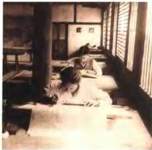
1940—1946年间中国营造学社在四川宜宾李庄上坝的工作室