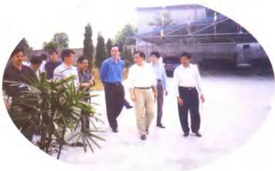
1999年6月2日，浙江省常务副省长吕祖善（右三）在衢州公司考察。