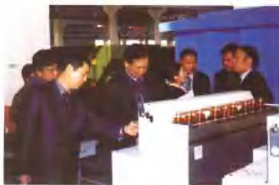
2003年11月2日，韩国客商来公司参观。