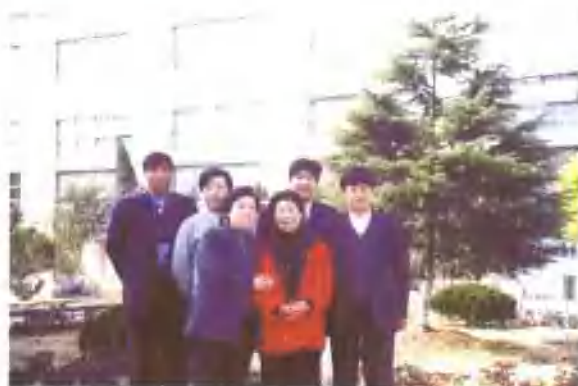
著名越剧表演艺术家张桂凤（前排右一）来公 司参观时与公司领导合影。