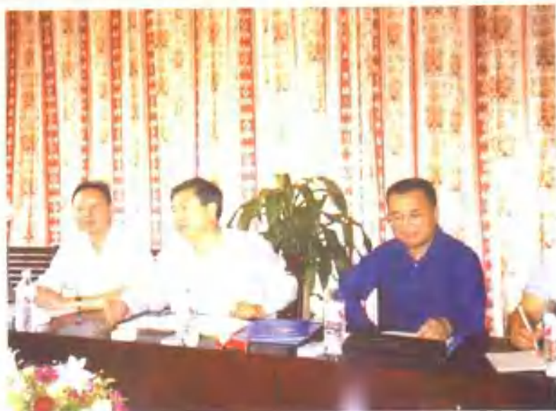
1999年10月15日，中共浙江省委书记张德江（中）、浙江省委秘书长王国平（右一）、原衢州市市长茅临生（左一）考察衢州公司。