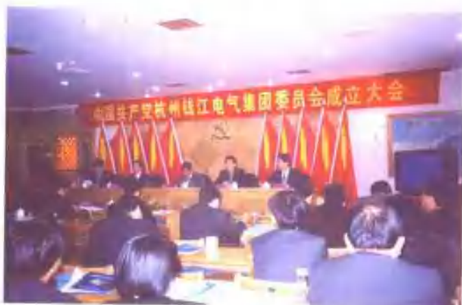
2000年1月10日， 集团党委成立大会。