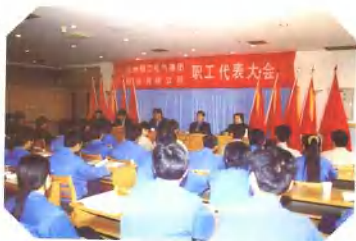
公司职工代表大会会场