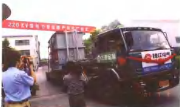
2003年7月9日，220kV级变压器出厂仪式。