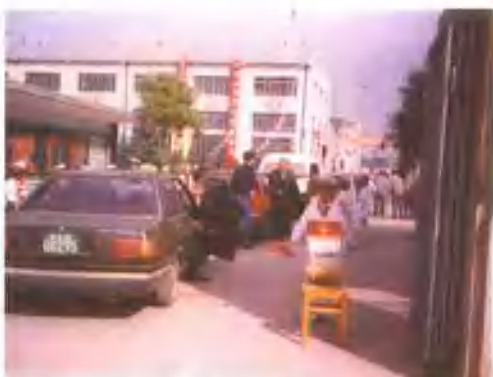
1991年庆祝建厂15周年时的情景