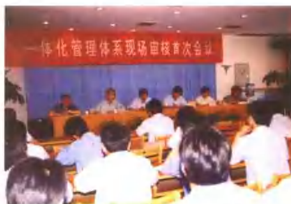
公司一体化管理体系现场审核首次会议