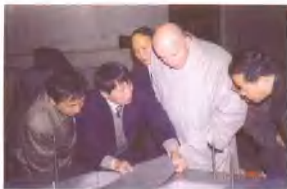
2002年12月18日，德国客商（右二）在车间参观。