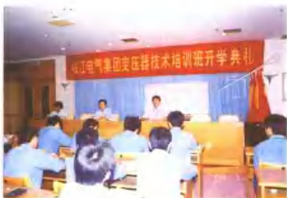
2003年7月14日，公司变压器技术培训班开学典礼