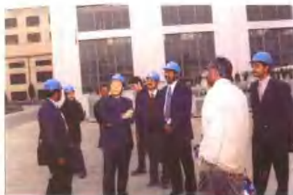
2004年2月12日，印度客商来公司考察、洽谈。