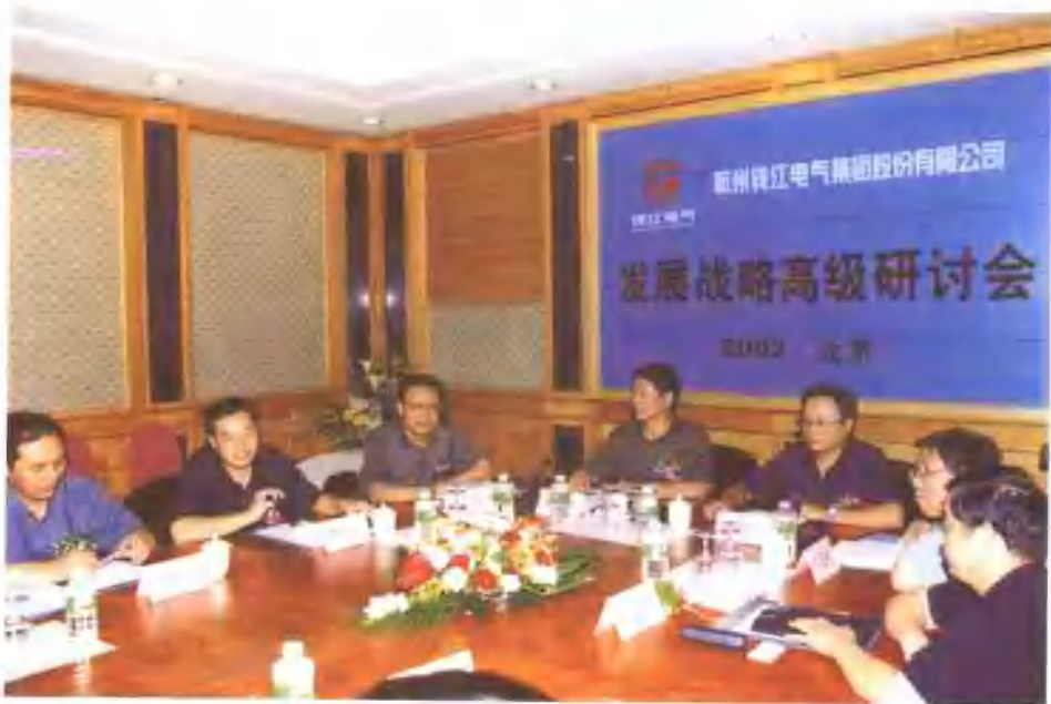
2002年9月7日，公司在北京友谊宾馆召开的钱江电气发展战略研讨会场景。