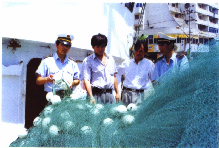
渔政人员现场执法