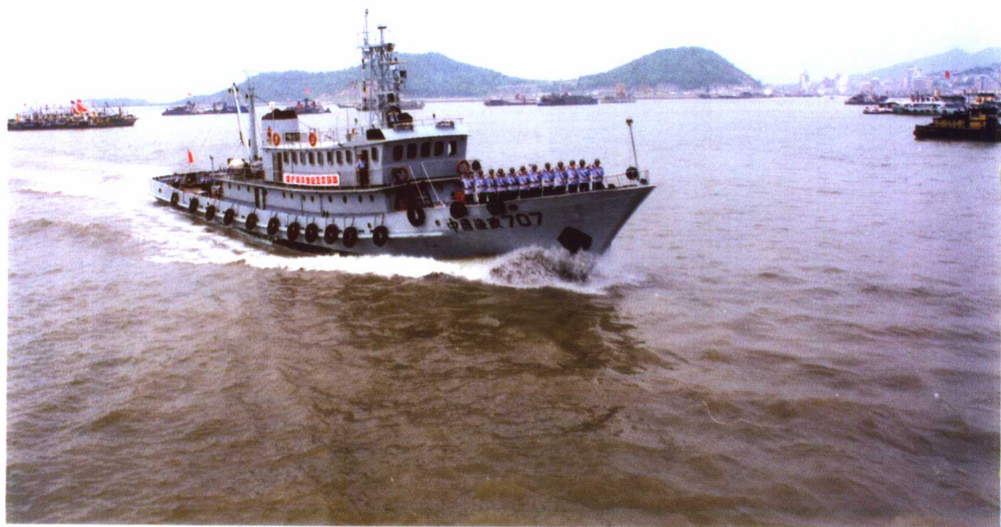
渔政船出海执行任务