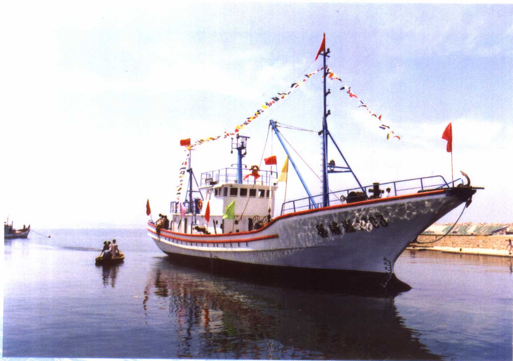
我国自行研制的玻璃钢渔船