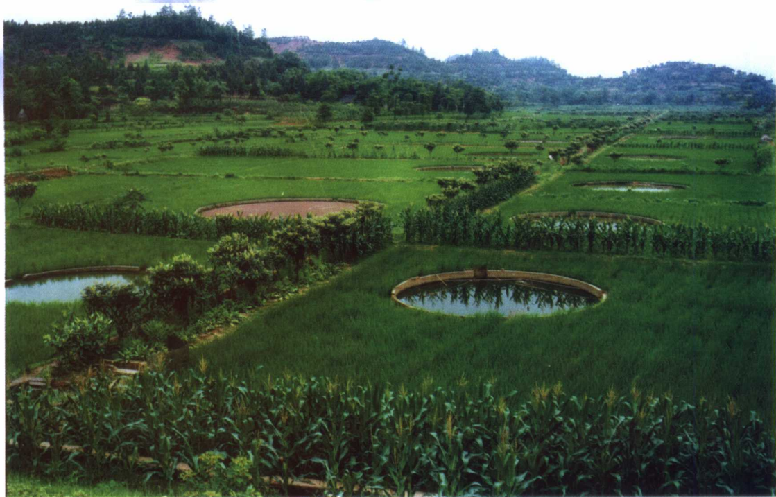
南充市顺庆区金台镇稻鱼果生产基地