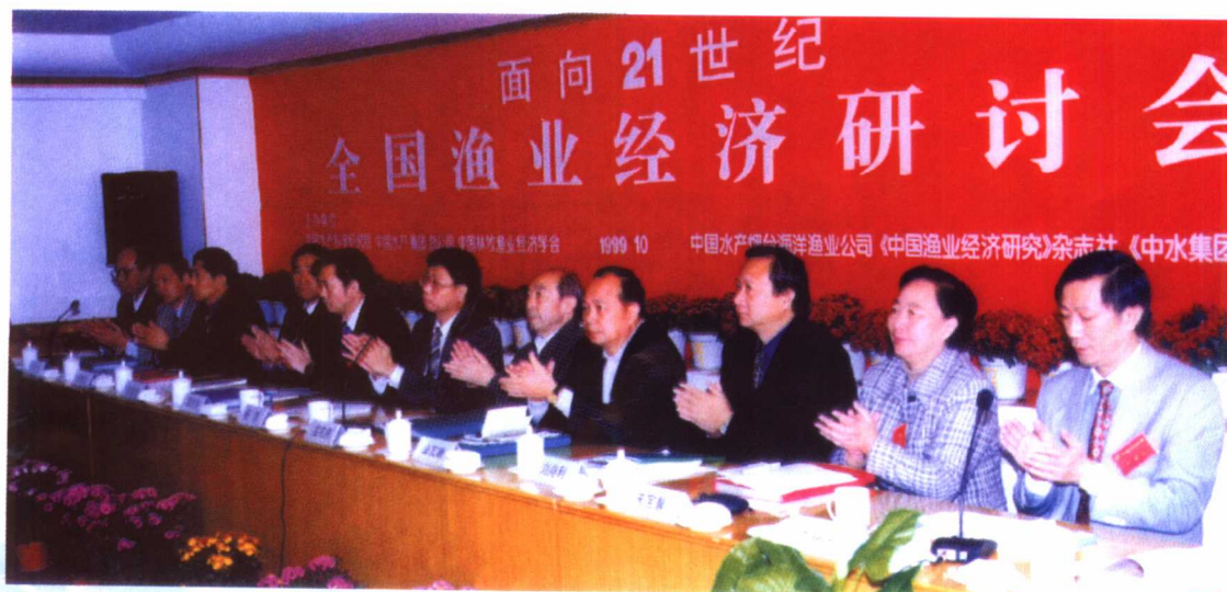
面向 21 世纪全国渔业经济研讨会