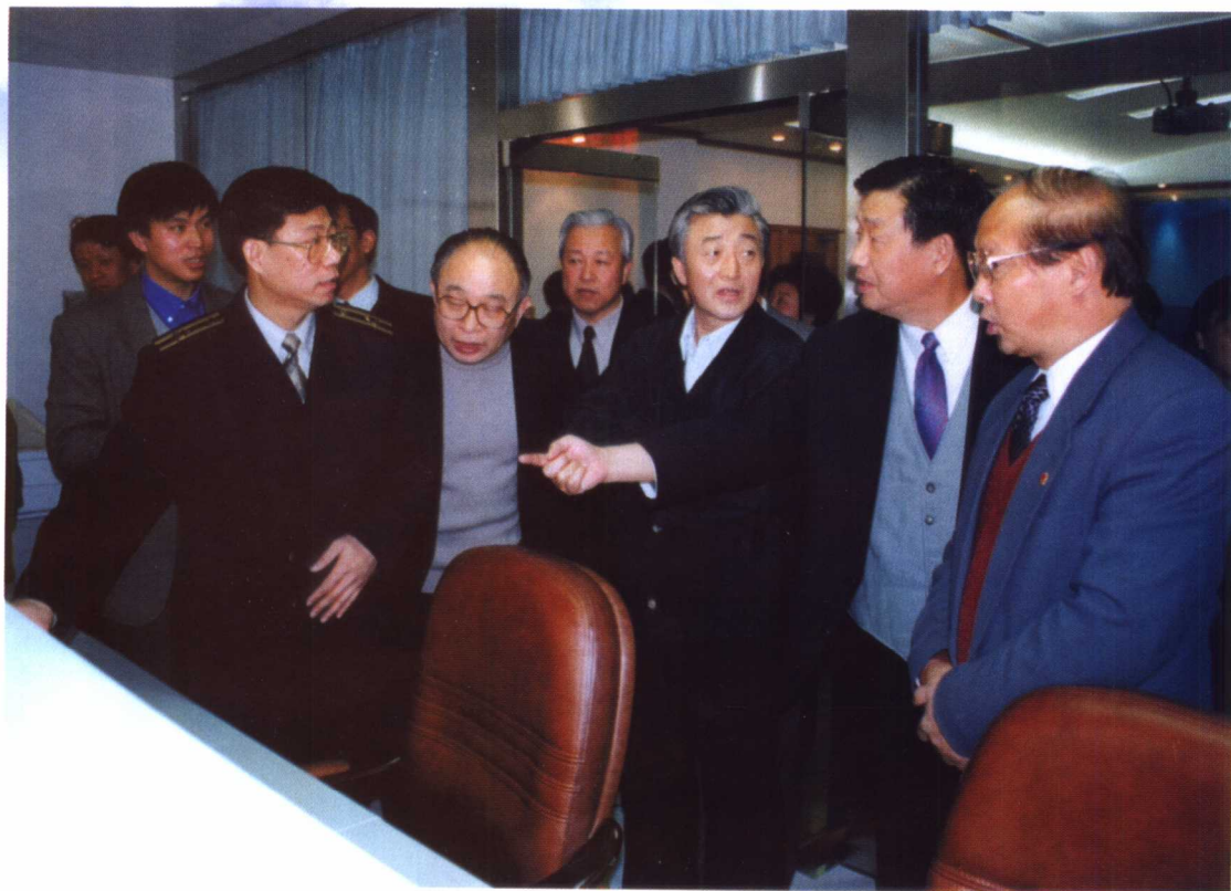
万宝瑞副部长等部领导视察渔政指挥中心