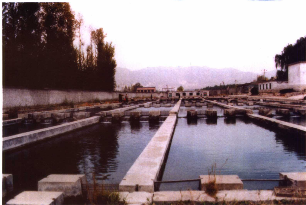
山西省虹鳟鱼实验场三文鱼养殖试验池