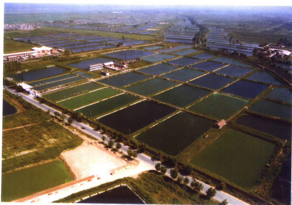
西安市北郊商品鱼基地