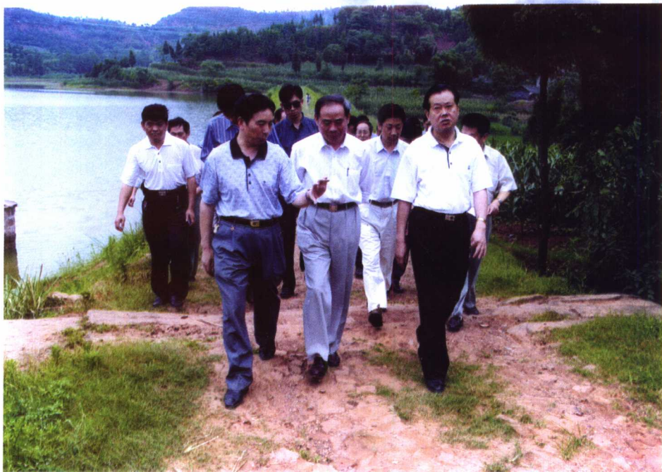
陈耀邦部长视察四川省规范化稻田养鱼