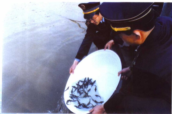
渔业资源增殖放流