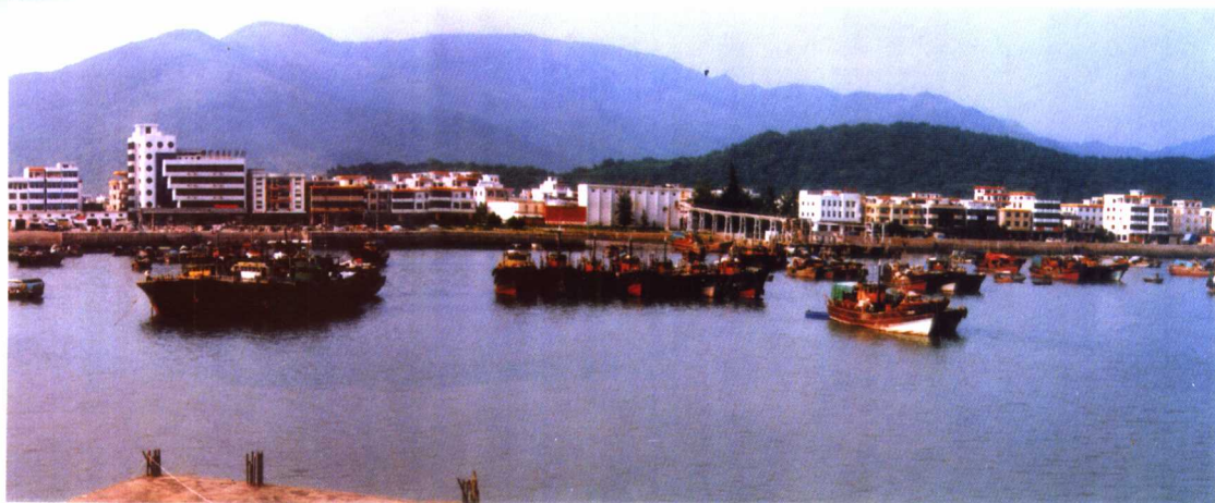
以愚公移山精神建设起来的广东阳江市东平渔港