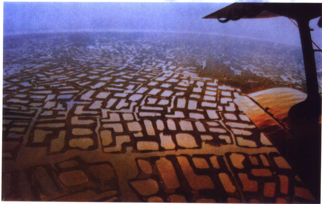
珠江三角洲塘鱼基地