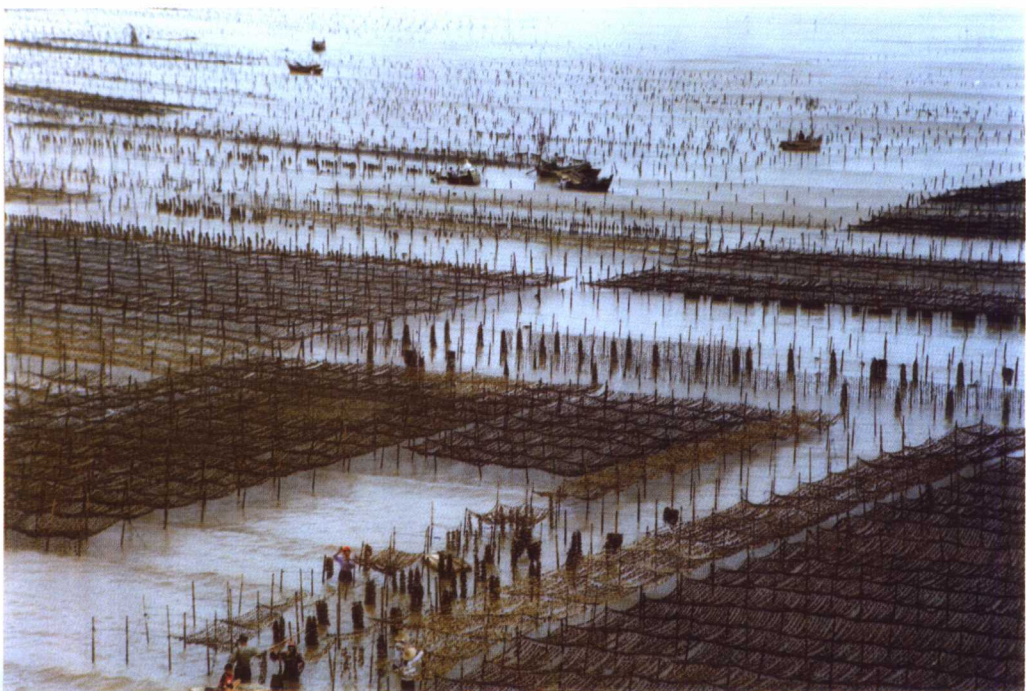
浅海棚架式吊养牡蛎