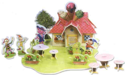
三维立体模型《粉红猫的冰激凌屋》