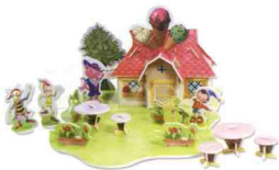
《粉红猫的冰激凌屋》

这个房子完全是依据动画片里粉红猫小姐的冰激凌屋而设计的，同时设计了粉红猫小姐、阿瓜、阿呆、Noddy和蹦蹦狗等玩具乐园里人物的造型，营造出一个十分逼真的场景。