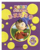
活动书《形状对对书》