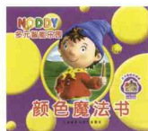
活动书《颜色魔法书》