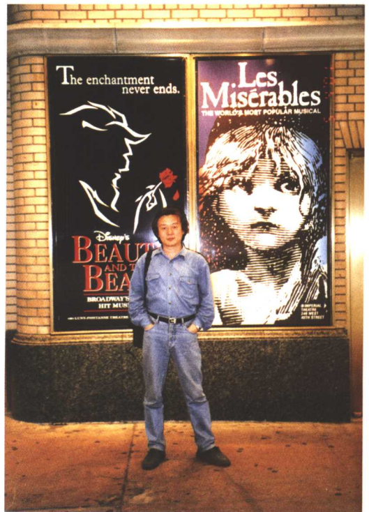
□ “戏剧之旅”在纽约百老汇（2001年）