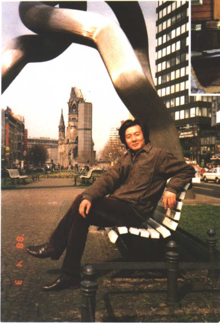
□ “戏剧之旅”在柏林（1988年）