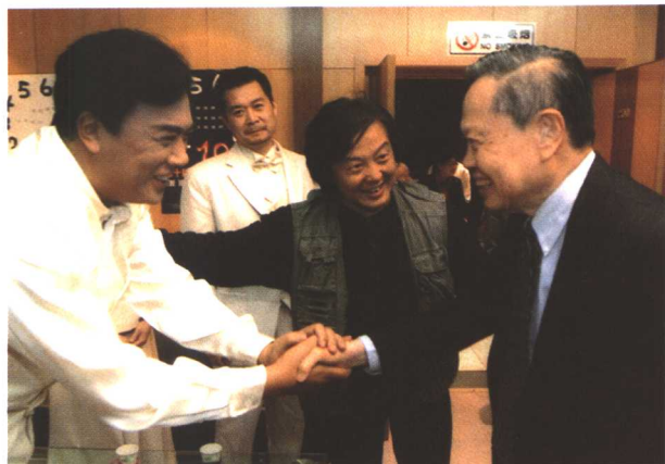
□ 杨振宁博士在《哥本哈根》“重逢”海森堡