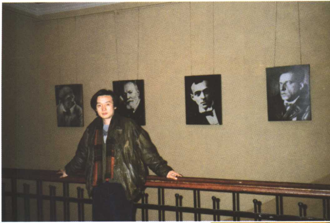
□ “戏剧之旅”在莫斯科卢那察尔斯基戏剧学院（1993年）