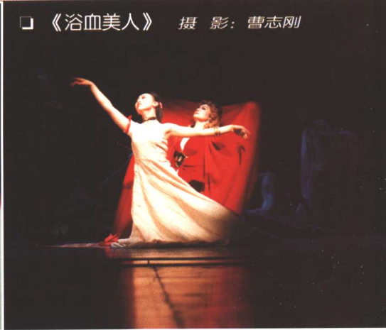
□ 《浴血美人》