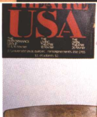
□ 拜访美国戏剧家、“环境戏剧”理论创建人理查·谢克纳