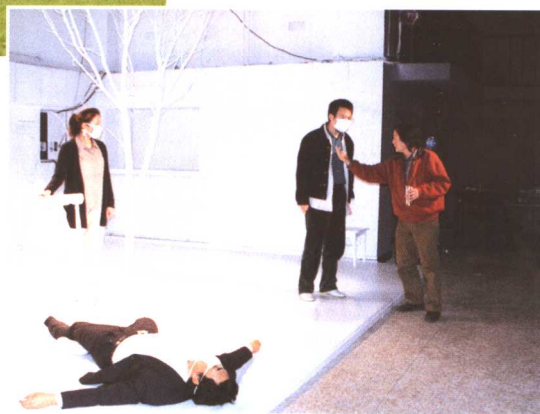
□ “非典型排练”(2003年)