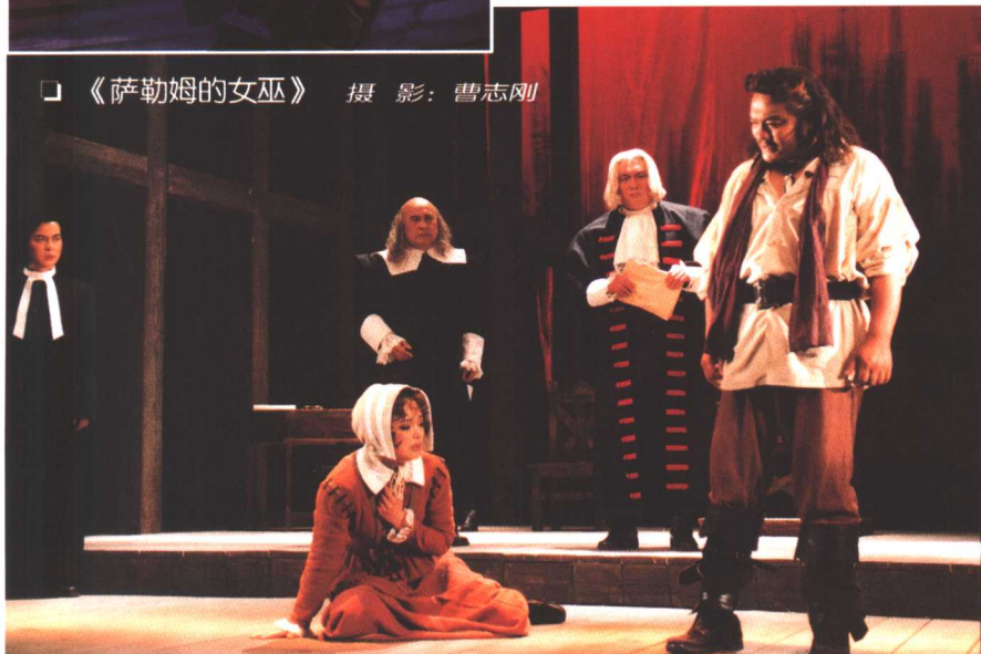
□ 《萨勒姆的女巫》