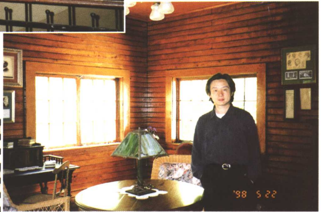
□ “戏剧之旅”在尤金·奥尼尔故居（1998年）