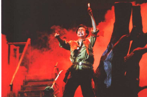
□ 《第十七棵黑杨》