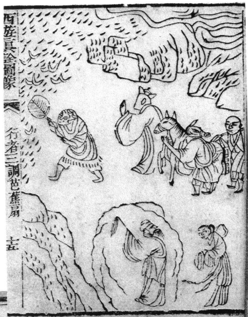
清咸丰本 西游真途行者三调芭蕉扇