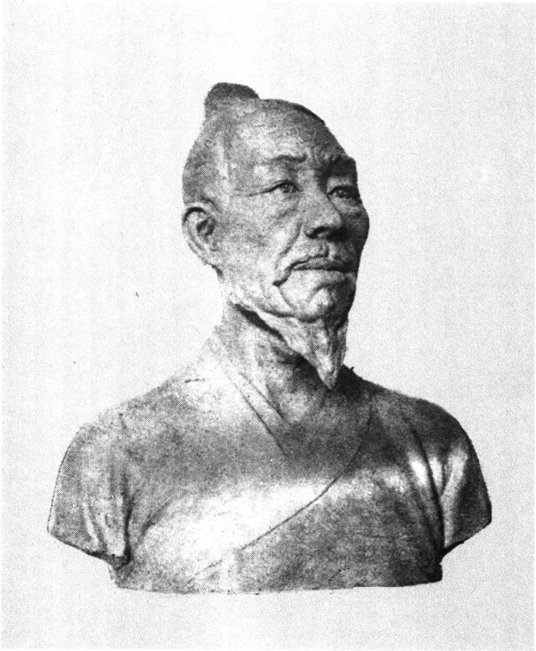
吴承恩像（中国科学院据颅骨复原）