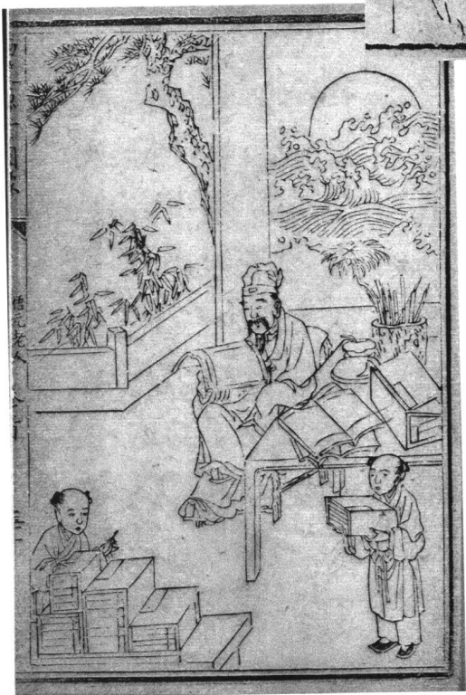
清嘉庆本 悟元老人刘一明像