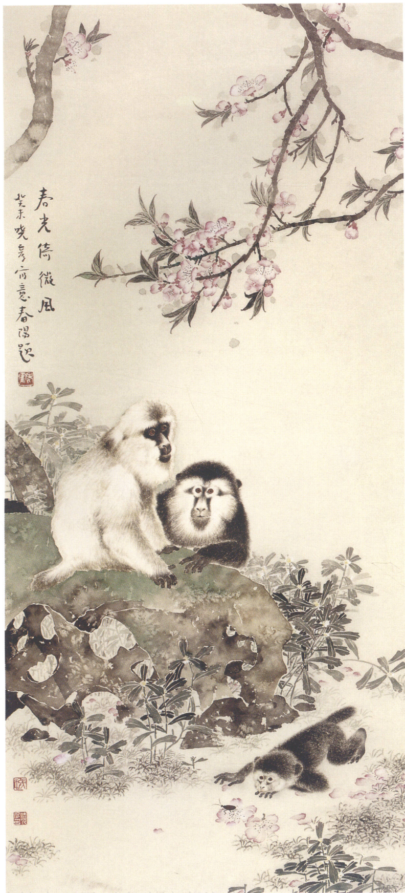
(左) 春光倚微风 (右) 日长如小年