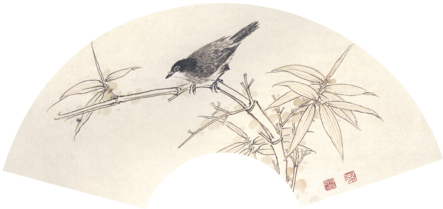
(上) 秋芳唯我独自赏