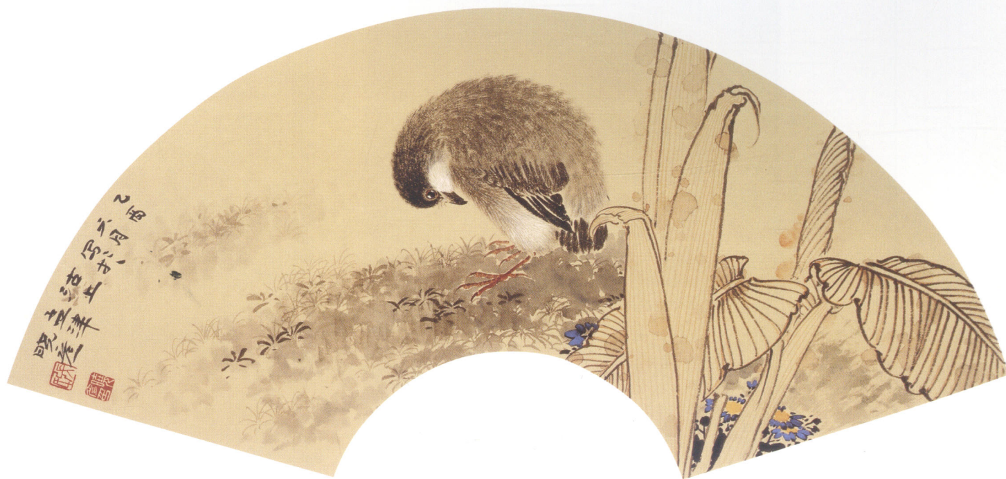
(上) 醒来方觉春风早 (下) 常啄自身不洁处