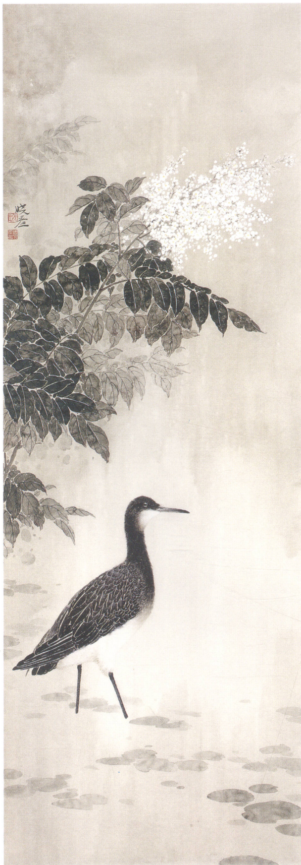
(左) 清闲一身听太古 (右) 一花一世界