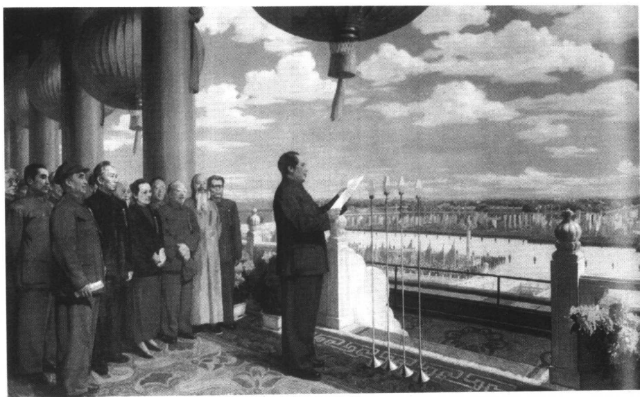
油画《开国大典》，董希文，作于1953年秋