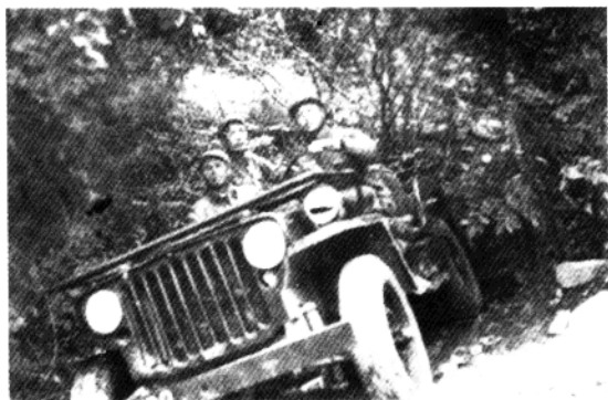
缴获敌人的吉普车