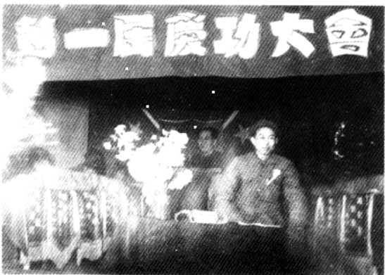
政委在庆功大会上讲话