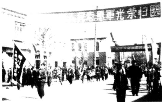
欢迎志愿军光荣归国