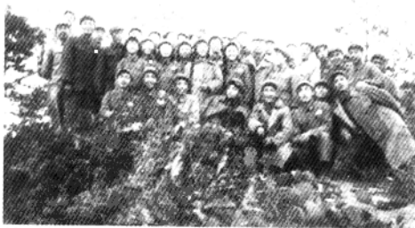
与祖国人民慰问团合影