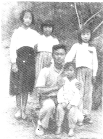
和朝鲜孩子在一起