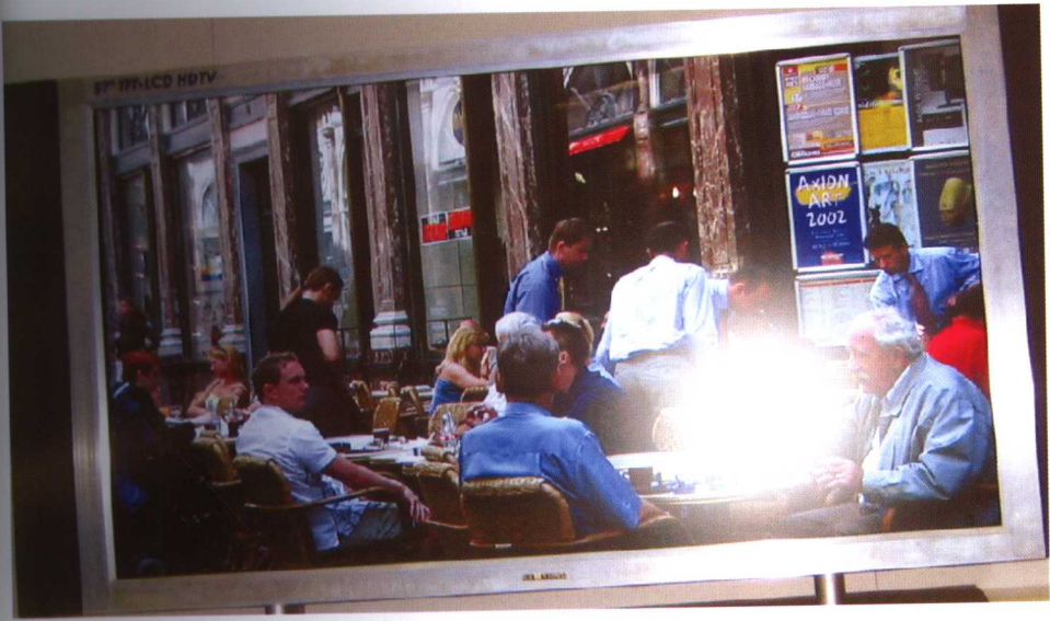
彩图I 57" 高清晰度彩色TFT液晶电视，正文图6-22