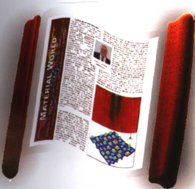
彩图II 理想的柔性彩色液晶显示，正文图6-75