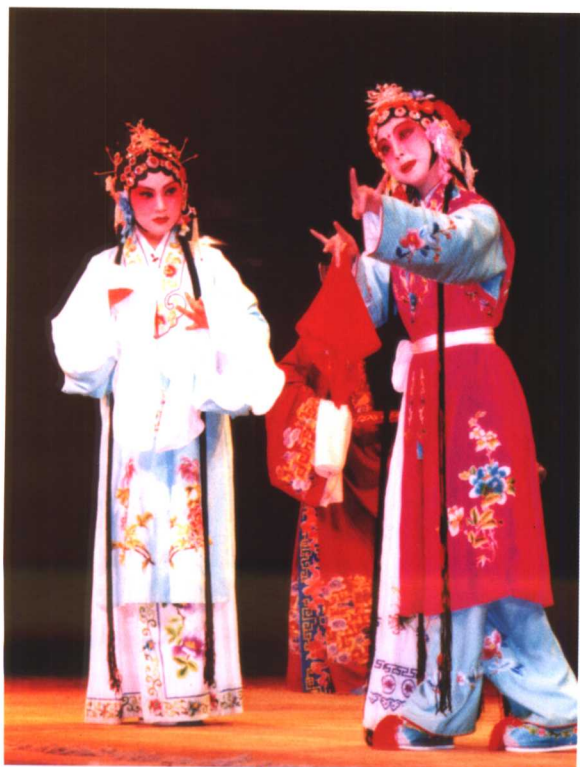
黄苗苗饰钱玉莲 汤泼泼饰梅香 (2003)