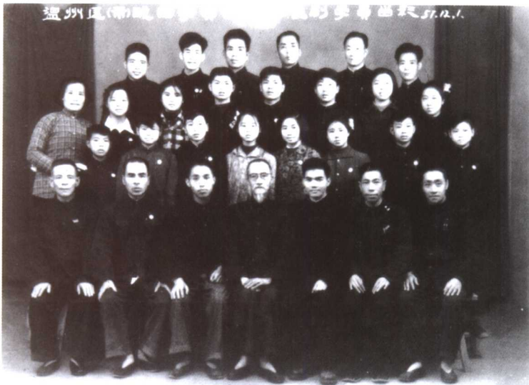
温州市文化处主办的戏曲学员训练班昆剧学员合影(1957)。