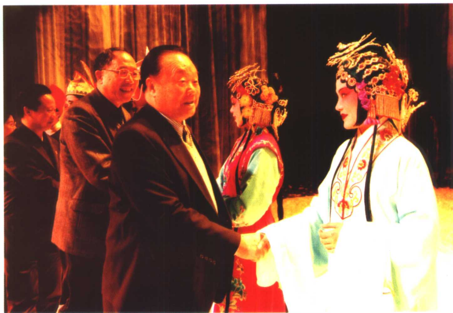
2003年11月12日，万国权同志带领15位全国政协委员到永嘉考察并观摩永嘉昆剧目《杀狗记》。