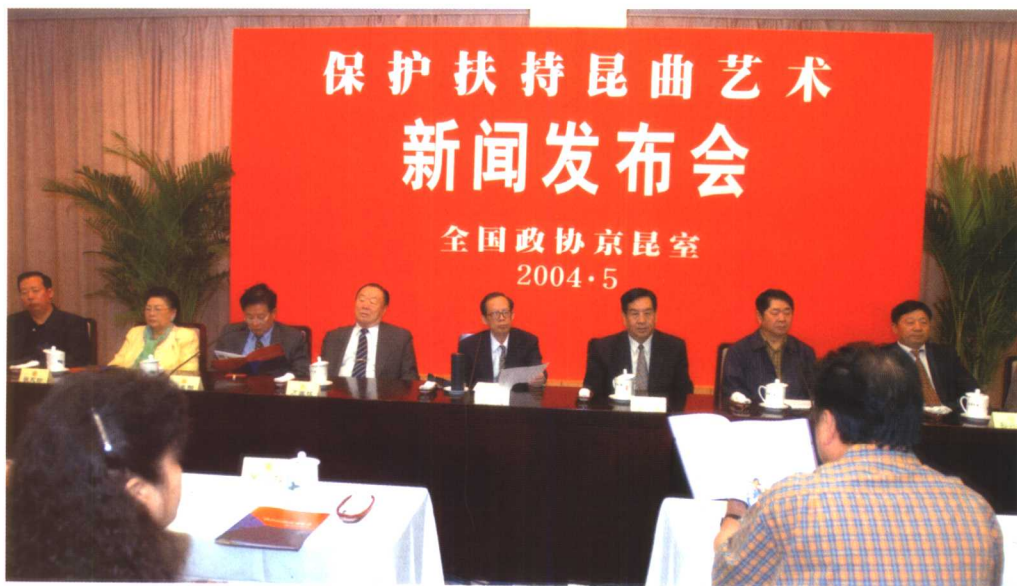
“保护扶持昆曲艺术”新闻发布会 2004年5月12日由王选在全国政协会议中心主持。