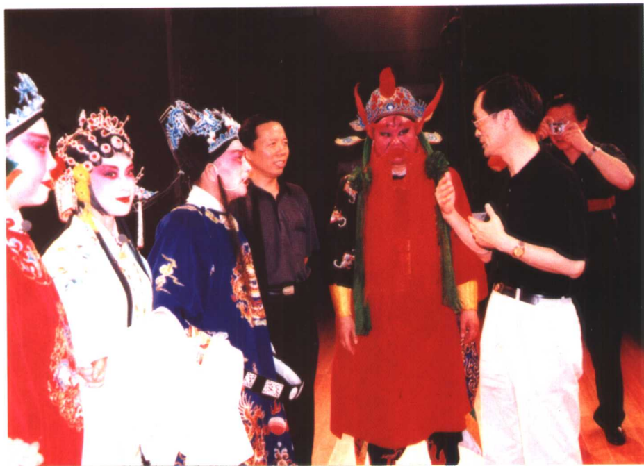
2001年8月，文化部昆剧指导委员会在永嘉县召开年会，潘震宙、王文章等领导同志出席并观摩永嘉昆剧目《张协状元》。