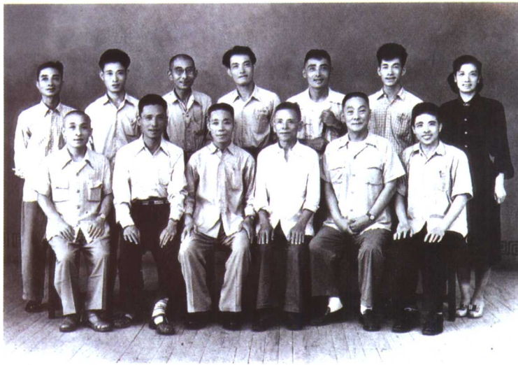
昆剧表演艺术大师俞振飞(前排右二)及周传瑛(前排左二)、王传淞(后排右三)与永昆演员章兴梅(前排右三)、杨银友(前排左三)等合影(1957)。