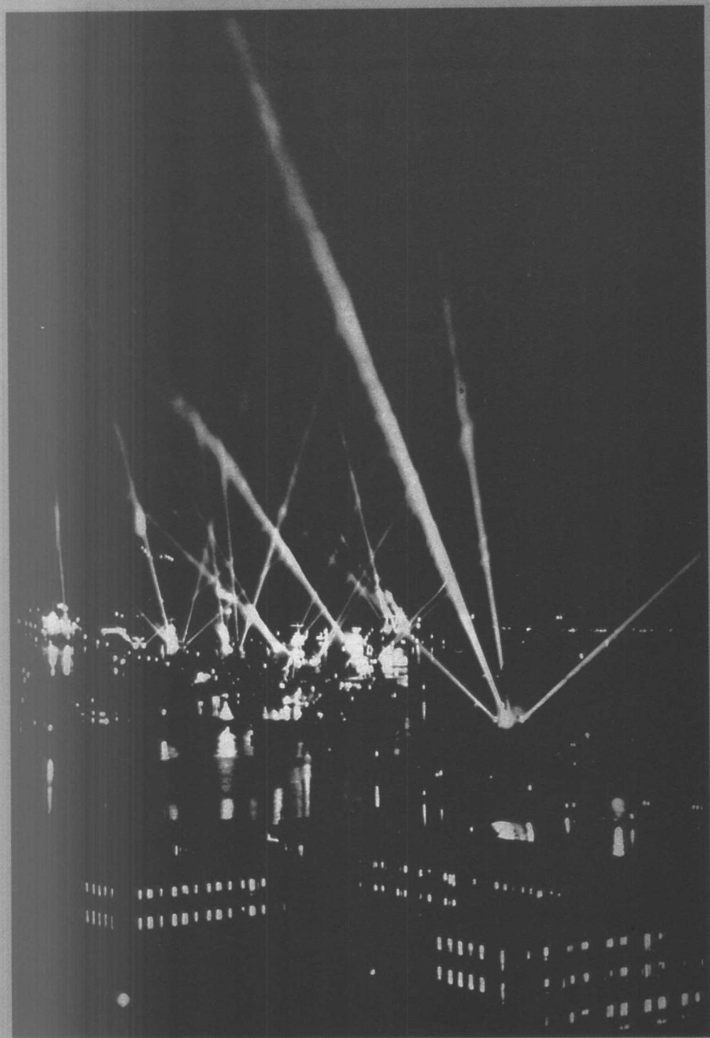
◎ 探照灯下的夏威夷夜景