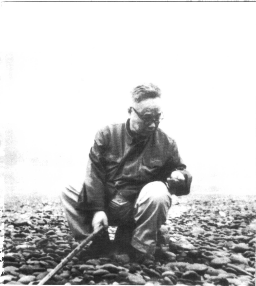
1976年4月，何其芳回乡探亲时，摄于四川万县长江边的红沙碛。在少年时代，他常常到这里拾取五光十色的卵石。