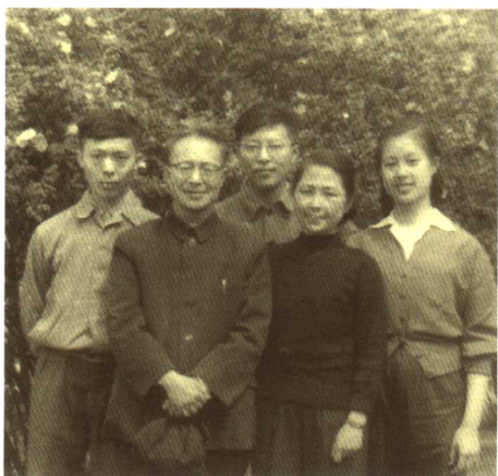
1959年，沈从文一家合影。