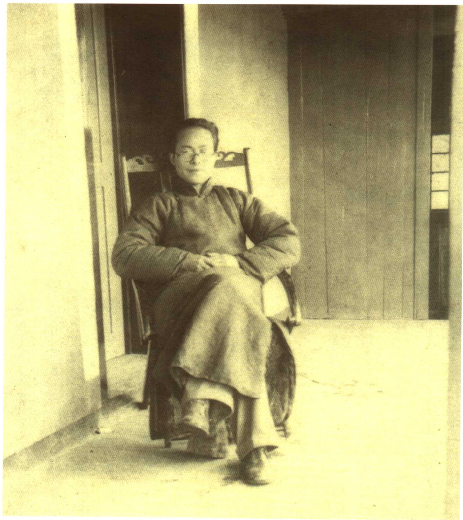
1938年，沈从文在沅陵云庐。