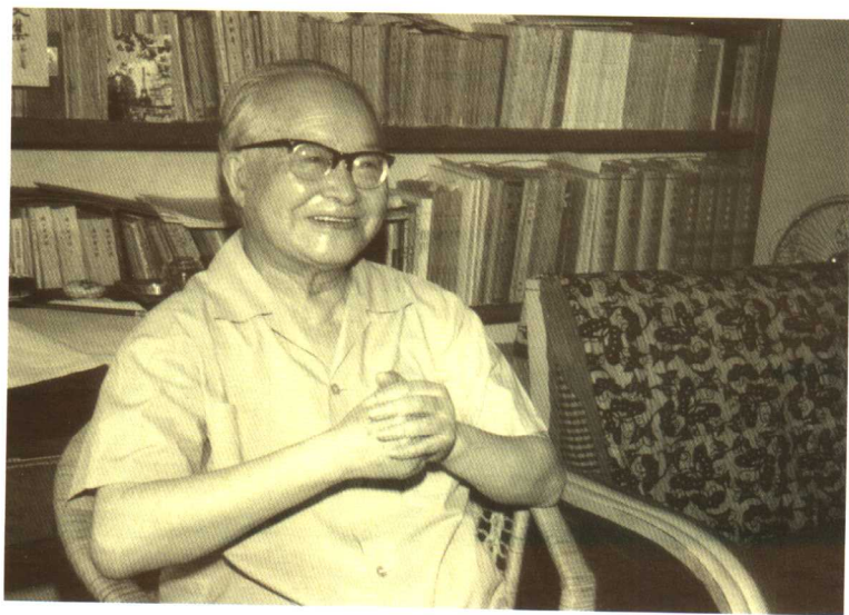
1982年，沈从文在北京家里。