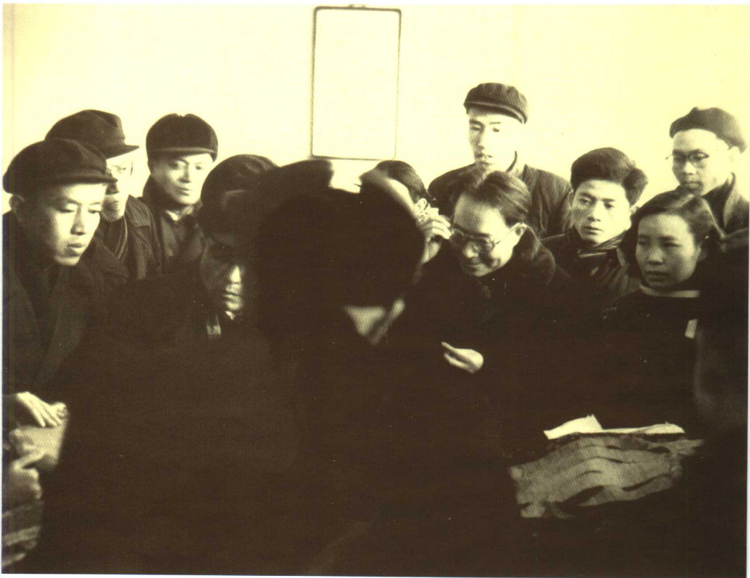
1957年，沈从文为苏州锦绣工人讲课。