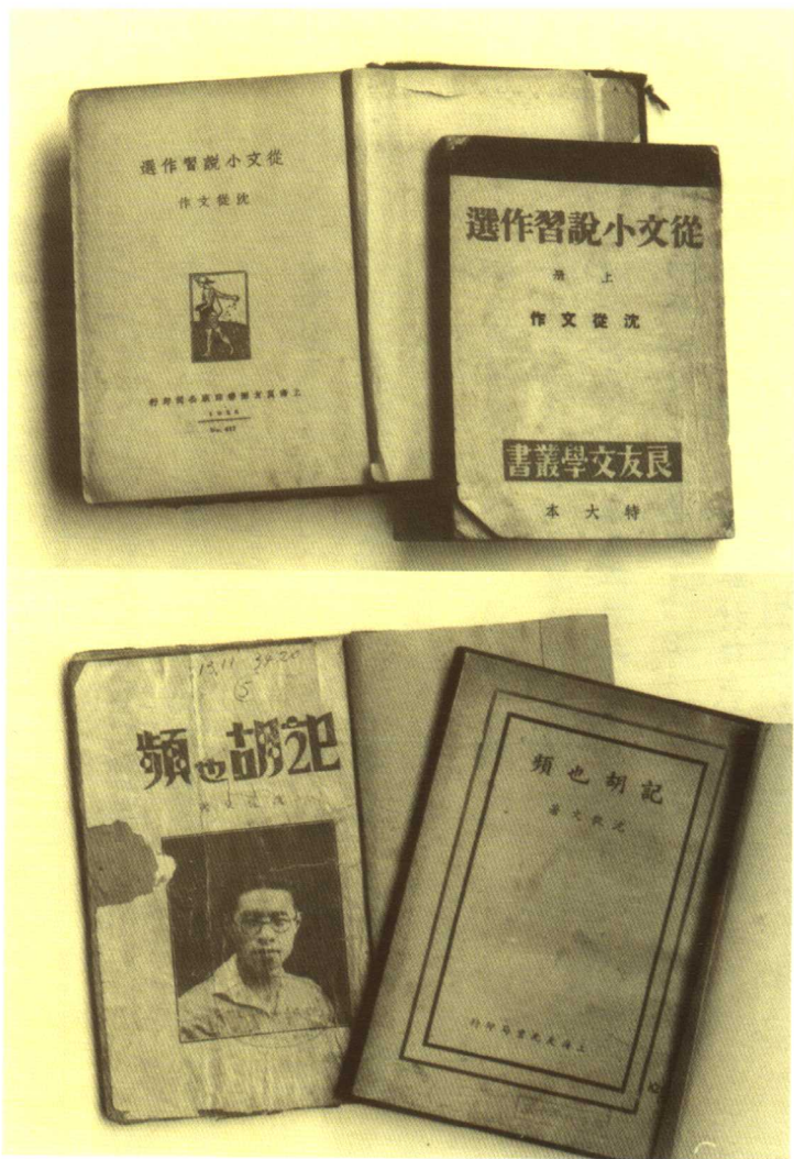
沈从文早期版本书影。