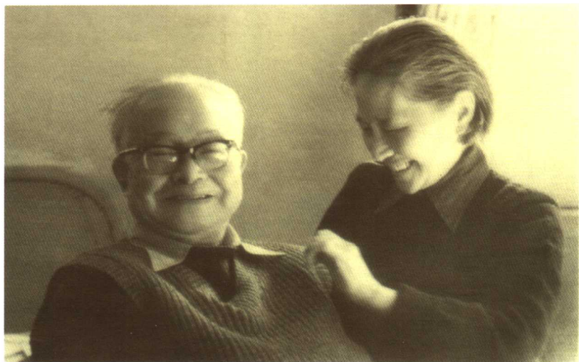
1982年，沈从文在北京家里。