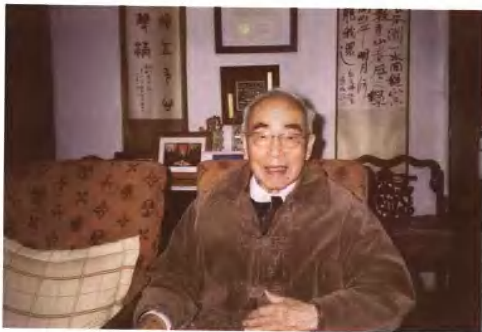
▲2005年九十四岁高龄的侯仁之院士在北京大学燕南园客厅留影