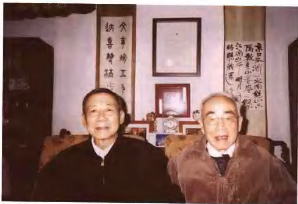
▲2005年作者（左）与侯仁之院士在燕南园客厅合影