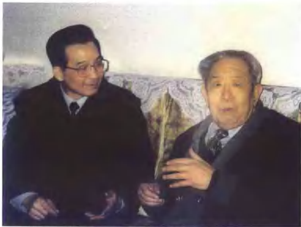
▲时任中共中央书记处书记的温家宝代表党中央看望九十岁高龄的贾兰坡院士