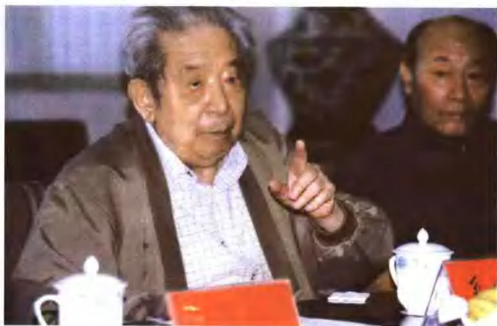
▲2000年九十二岁高龄的贾兰坡院士（左）与北京市前文物局局长王金善一起出席会议