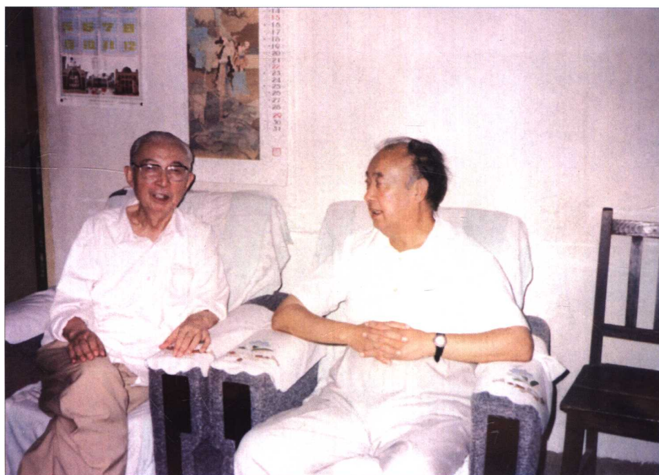
看望白寿彝先生（20世纪80年代）