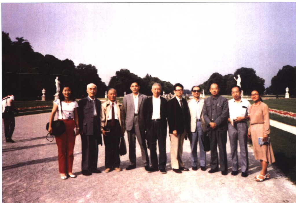
第16届国际历史科学大会中国代表团部分团员合影于德国斯图加特（1985年）