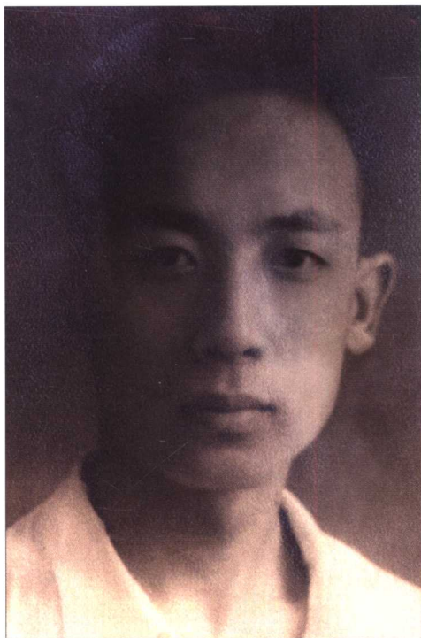
1946年摄于北京， 时为大学二年级学生