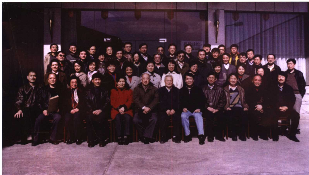
2001年参加首都师范大学历史系77届同学毕业20周年活动