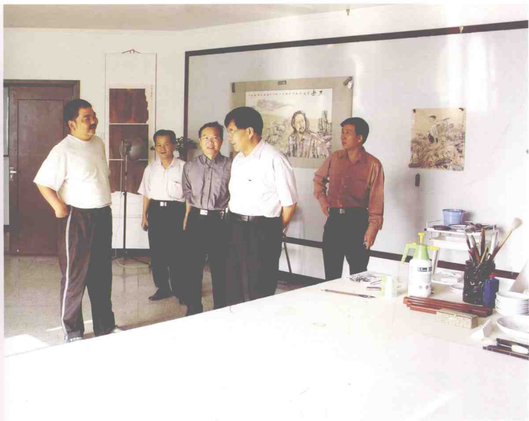
福田区委副书记、区长张礼铜(右二)在福田街道文化站指导工作