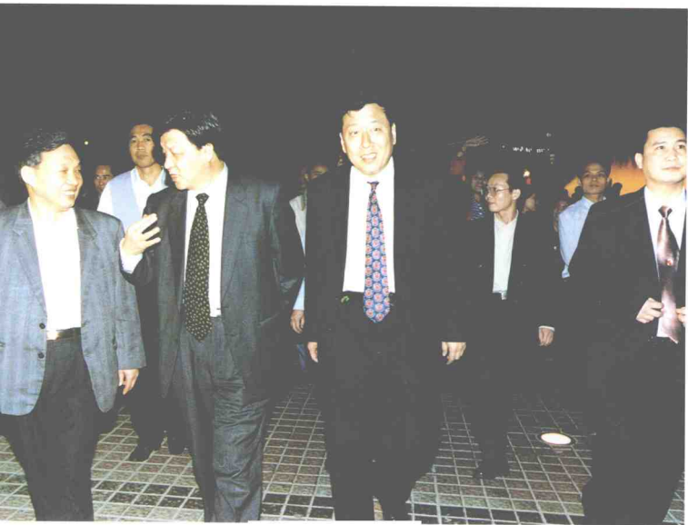
中央政治局委员、中宣部部长刘云山(左二)在福田街道皇岗社区视察