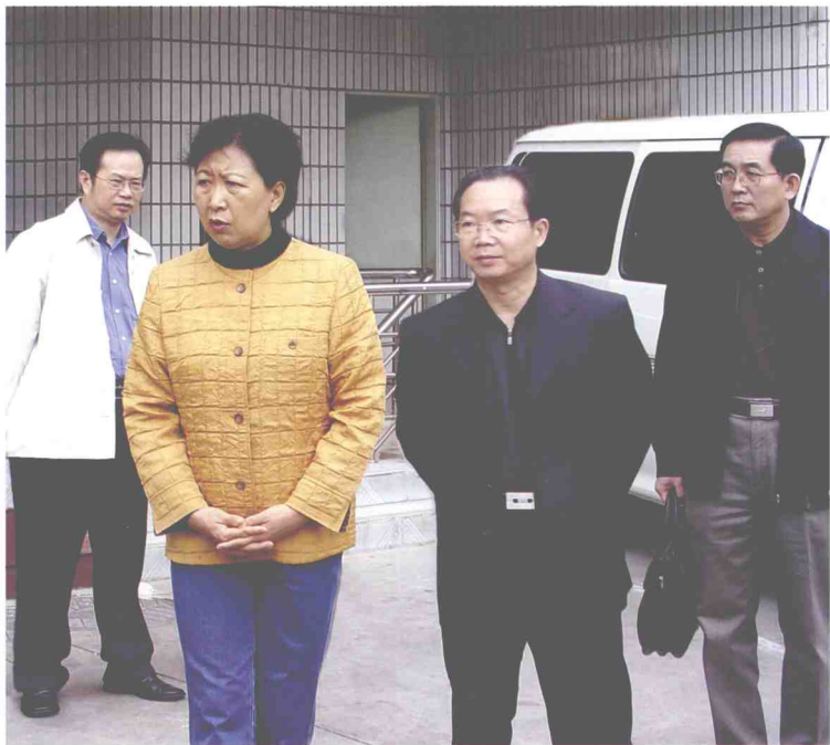
广东省副书记、深圳市委书记、市人大常委会主任黄丽满(左二)到福田街道视察