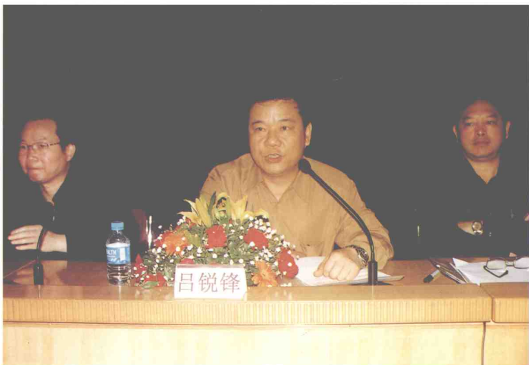
福田区委书记吕锐锋在福田街道社区工作会议上讲话