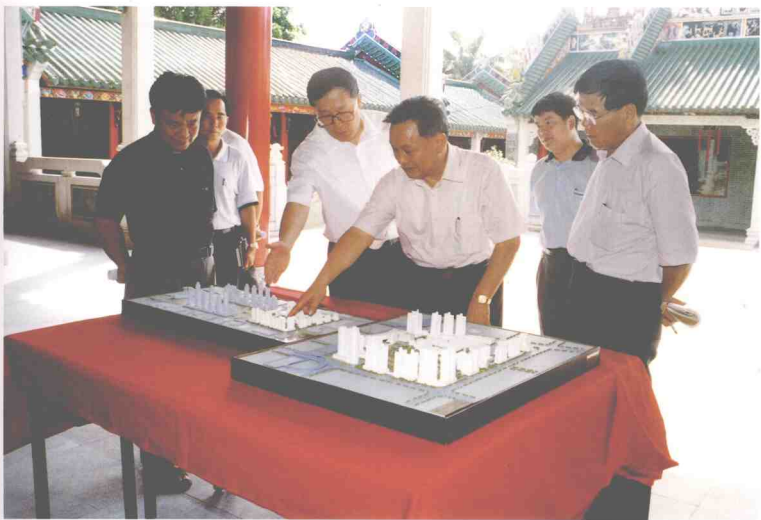
广东省委常委、深圳市市长李鸿忠(右四)在福田街道皇岗社区视察