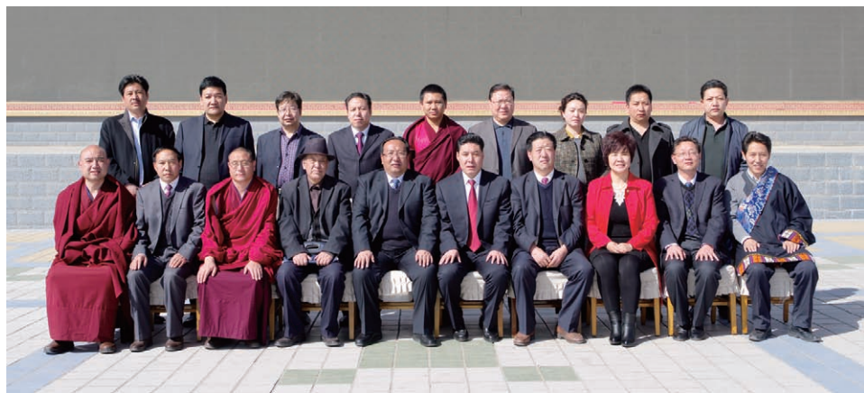
编委会人员合影