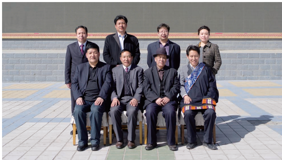
编辑部人员合影